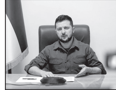
ლობის რაოდენობით, მნიშვნელოვანი უპირატესობა აქვს, - აღნიშნა უკრაინის პრეზიდენტმა.