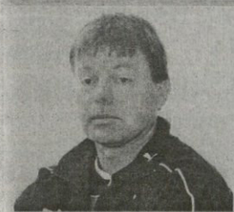
რუსები მანქარით დაინტერესდნენ