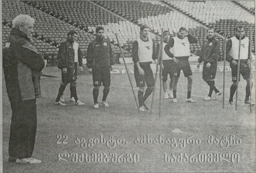
22 აგვისტო. ამხანაგური მატჩი ლუმეზურბი — სამართხელი