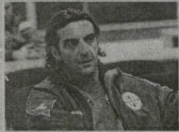
კალჯ ვინჯა და ჩვენებური განსხვავებული: არ ვინდა!