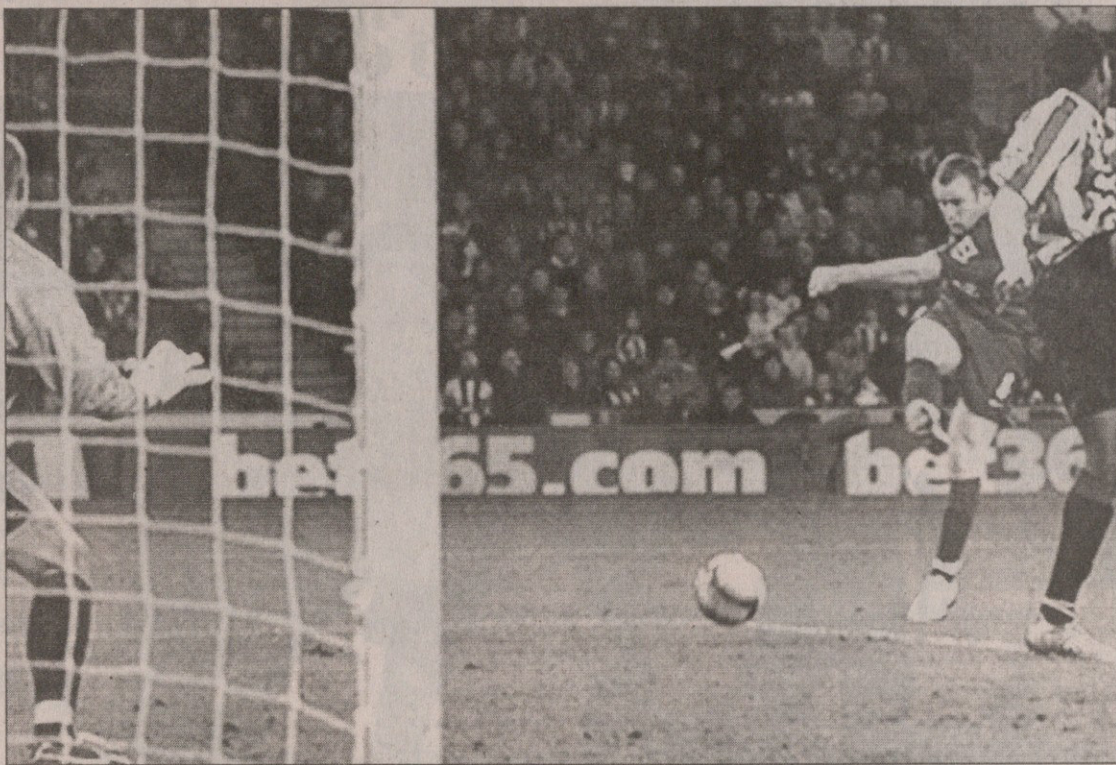
„მანჩესტერმა“ შეფილდში უენ რუნის დუბლით მოიგო