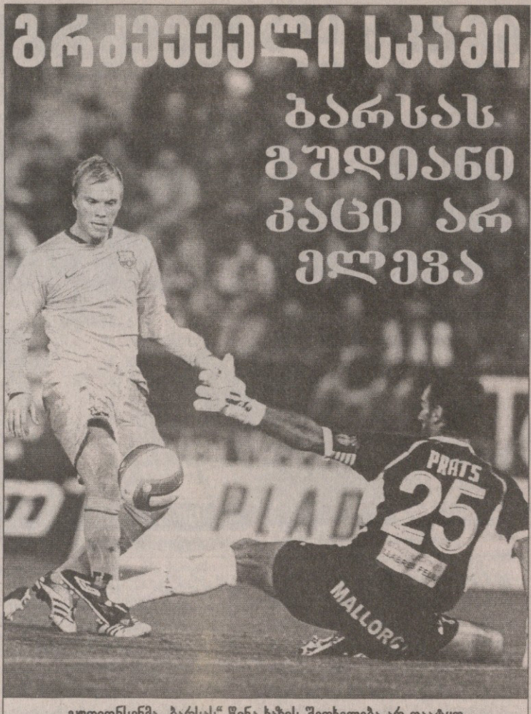
ბალბა და მალიორკიდან