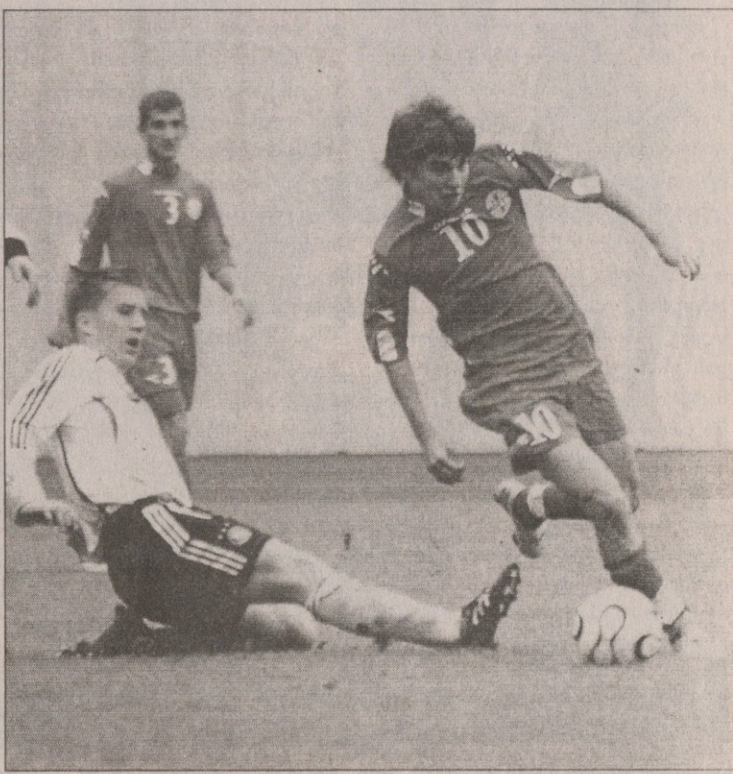
გადიან კამერონი ფოტო