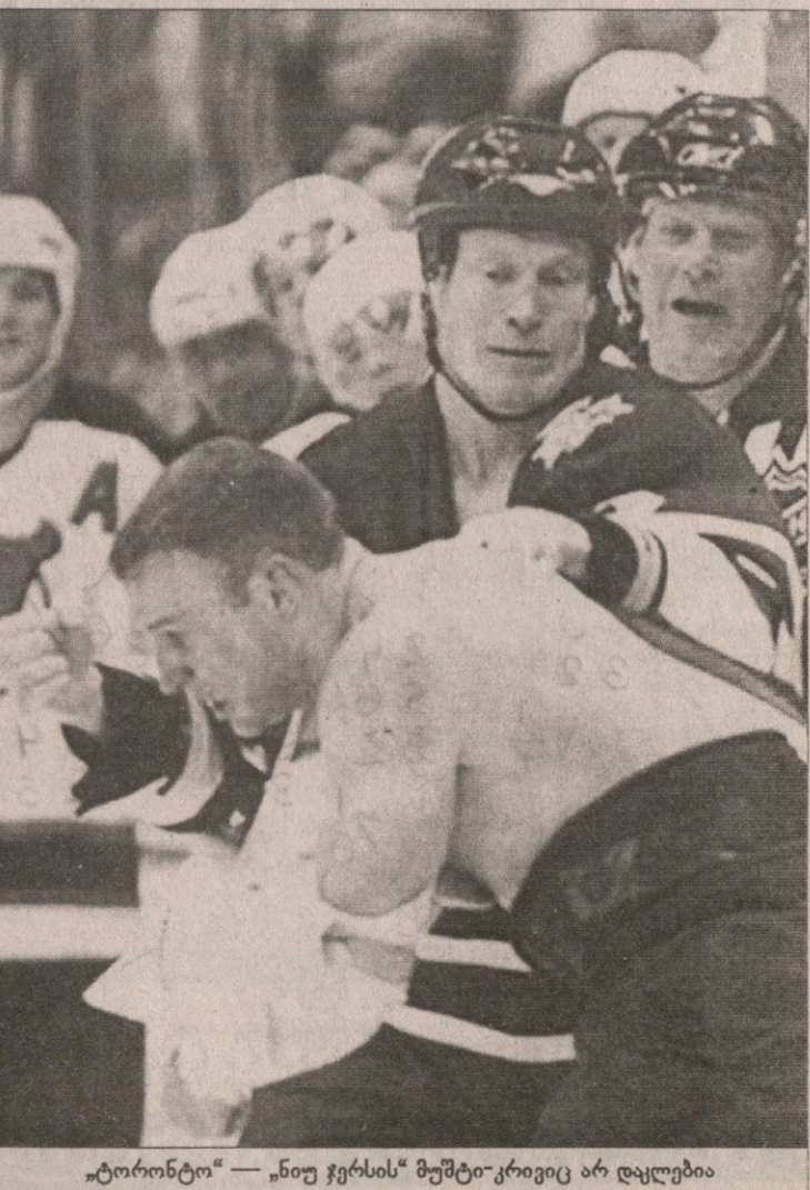
„ტორონტო“ — „ნიუ ჯერსის“ მუშტი-კრიკეტი არ დაყლებია