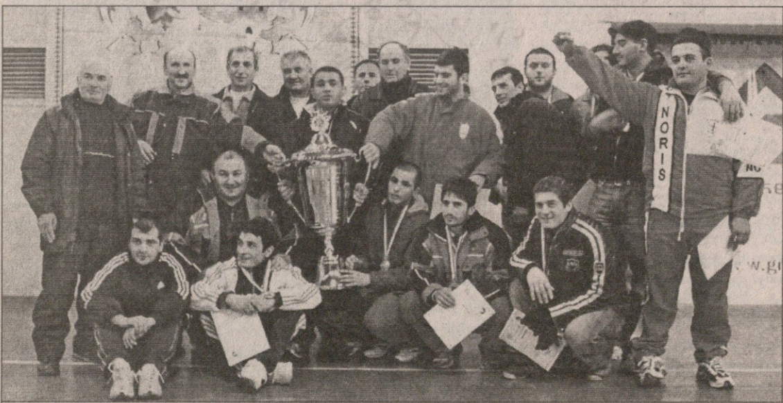
პრეზიდენტის თასის მფლობელი თბილისის გუნდი