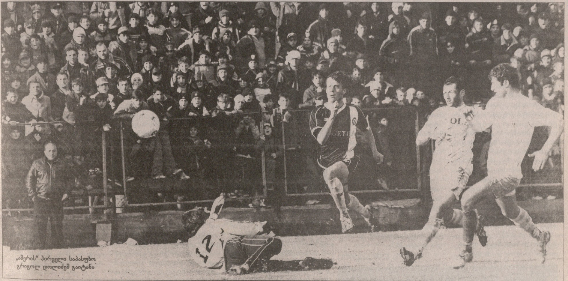
„ამერის“ პირველი საპასუხო გოლი დოლიმემ გაიტანა