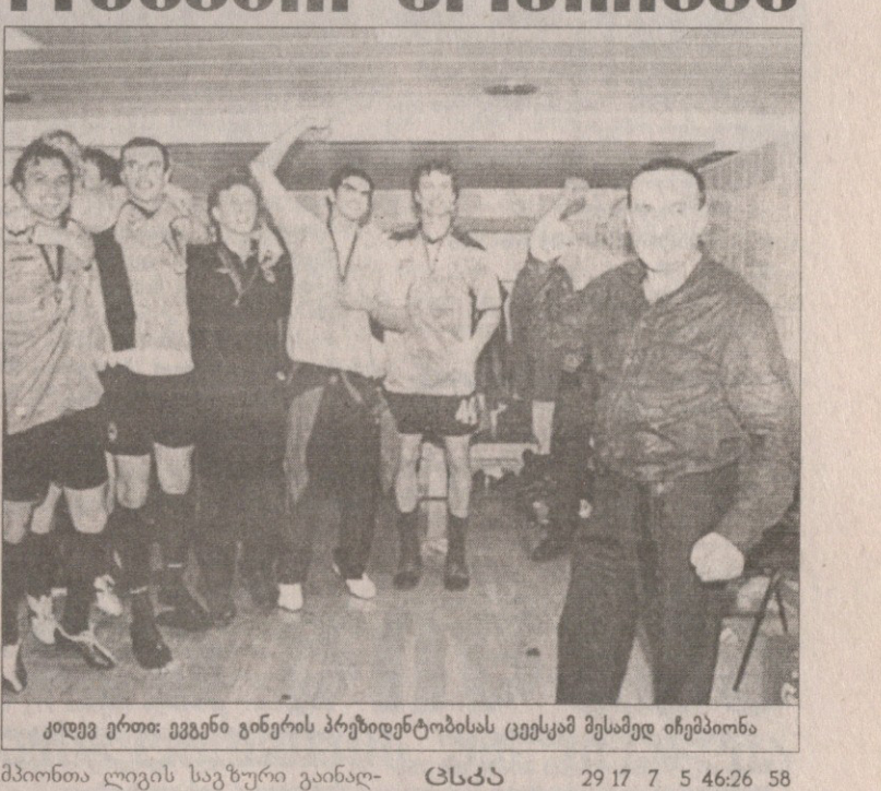
კილვე ვითი: ეგვენი გინერის პრეზიდენტობისას ცეკვამ მესამედ იმპეტიონა

სარკივილი მსხვერპლი „ინვერენსია“ — გორდონ სტრანჩანის გუნდმა იოლად კი მოიგო, მაგრამ ერთ-ერთი ძირითადი მცველი ვარი კოლდუელი დაუშვავდა, რომელმაც ზეგ შესაძლოა, ჩემპიონთა ლიგაში „მანჩესტერ იუნაიტედთან“ ვერ ითამაშოს.