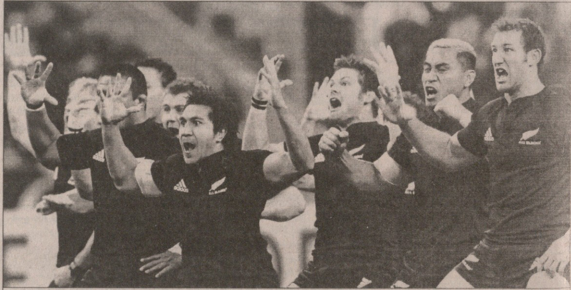
„ოლ ბლექსის“ ჰაჰამ „მამლები“ ამჯერადაც დააფრთხო

სამი ოკეანეთური სარაგბო ქვეყნის — სამოას, ფიჯისა და ტონგას ნაკრებმა ვერ აჯობა, მაგრამ ხასიათი კი გაუფუჭა შოტლანდიელებს. სქითებს ჯერ გამარჯობაც არ ჰქონდათ ნათქვამი, რომ კუნძულებმა ორი წამყვანი მითამაშე — კიუსიტერი და ბათი ისე დაუწიხლეს, სასწრაფოდ ხასწრაფოს წასაყვანები გაუხადეს მასპინძლებმა კი სამაგიერო კარგი თამაშით გადაუხადეს და ოთხი ლელო რომ აძერეს და 31:5 დაწინაურდნენ, მერეღა მოუშვეს სადაკეობი.