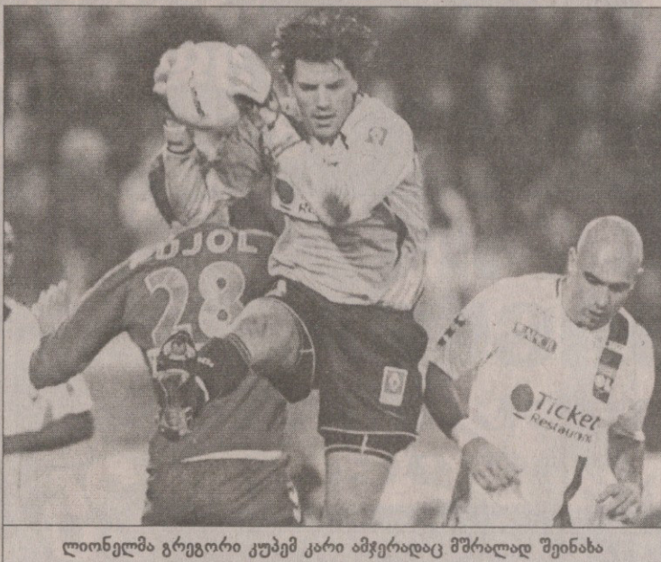
ლიონელმა გრეგორი კუბემ კარი ამჯერადაც მშრალად შეინახა

შერარ ულიეს „ლიონი“ ბოლო მატჩებში ისე დამაჯერებლად გეღარ თამაშობს, მაგრამ მოგებას მაინც ახერხებს. „ლიონებმა“ ამჯერად ცხრილის ფსკერზე დასველეს „სელანთან“ იწვალეს და მე-80 წუთზე მასპინძელთა მცველ ნავიმ აბდუს უნინიოს ჩაწოდებული ბურთით საკუთარ კარში რომ არ ჩაეჭრა... თუმცა უნდა აღინიშნოს, რომ „ლიონს“ ტრავმების გამო ფრედი, ქარიმ ბენზემა და სილვენ ვილტორდი აკლდა.