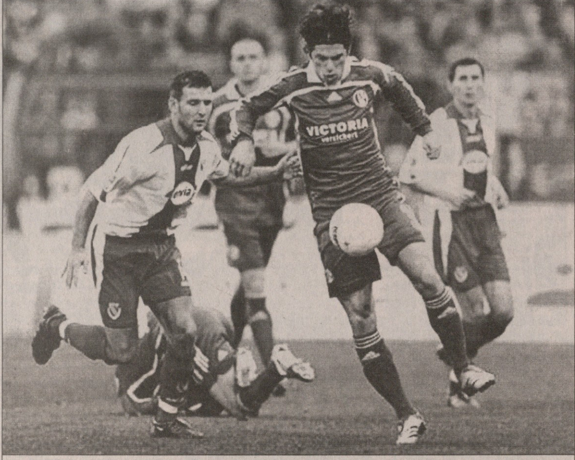
ლეიპციგის კობახიძემ ზოლტან შელტონს „კობახიცი“ არ დაინდო

ბუგელი, ა. შტრატი, ა. მეიერი, ტაკა-პარა (კირიაკოსი 34), ანანტიდისი მწვრთნელი: ფრიდმულმ ფუნკელი გაძეგება: ვასოსკი (28) მსაჯე: გაგელმანი 21 260 მაყურებელი