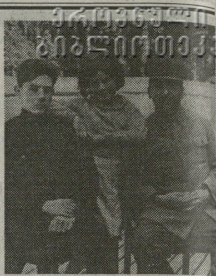
სტალინი და მისი ტრაგიკული ბედის შვილები - ვასილი და სვებლანა

უღრმბა შეითონა „სამხედრო ფაშისტური“ შეთქმულება გერმანიის შეიარაღებული ძალების წარმომადგენლებთან ბრალდებულთა კონტაქტების მითითებით. ეს სიბნელეს არ წარმოადგენდა 1926 წელს ტუხაჩევსკი გერმანიაში იყო მივლინებით, სადაც ხელი მოაწერა გერმანიის ერთ-ერთ ფირმასთან ავიაციის სფეროში თანამშრომლობის დოკუმენტს. იაკირი გერმანიაში გენშტაბის კურსებზე სწავლობდა 1929 წელს. კორკი გერმანიაში იყო სამხედრო ატაშეს თანამდებობაზე.