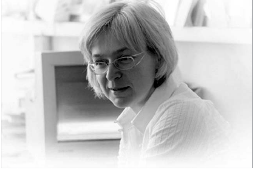
ანა პოლიტკოვსკაიას მკვლელობიდან სამი წელი გავიდა

რამდენიმე თვის წინ, მოსკოვის საოლქო სამხედრო სასამართლოს ნაფიც მსაჯულთა ჟიურის გადაწყვეტილებით, პოლიტკოვსკაიას