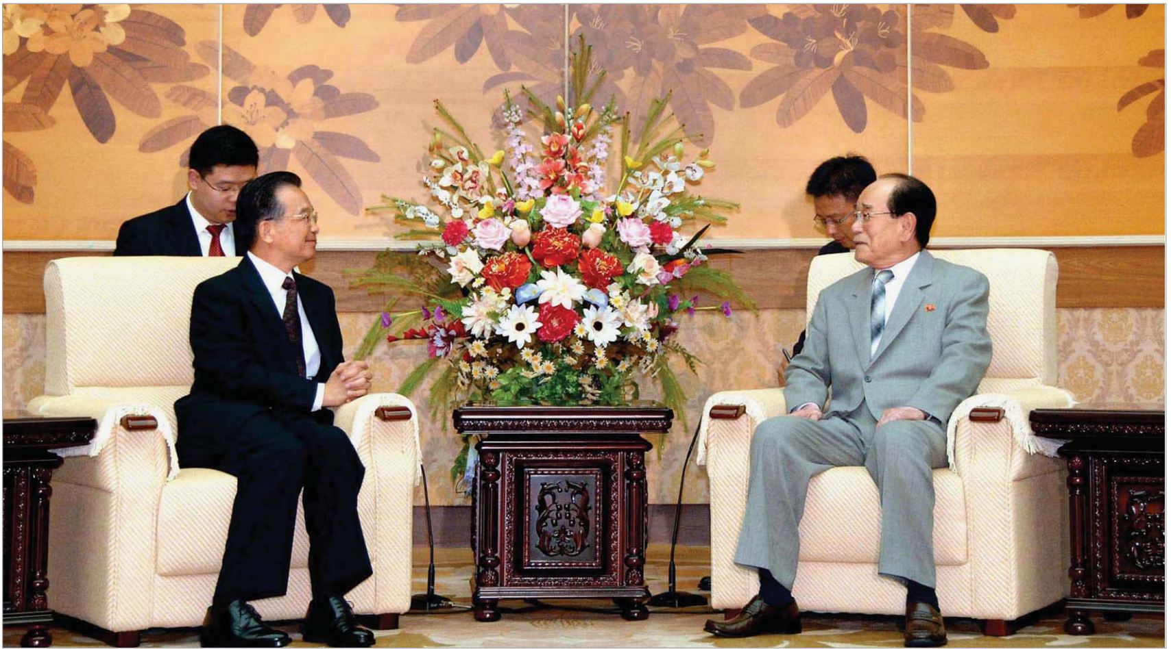
ჩინეთის პრემიერ-მინისტრი ვენ ძიაბაო და ჩრდილოეთ-კორეის ლიდერი კიმ ჩენ ირი

საინფორმაციო სააგენტო მკსნამ აქვეყნებს კიმ ჩენ ირის სიტყვებს, რომლის თანახმადაც, ჩრდილოეთ კორეასა და აშშ-ს შორის არსებული მტრული ურთიერთობა გადაუღებელი ორმხრივი მოლაპარაკების შედეგად მშვიდობიან კავშირად უნდა იქცეს. ჩვენ გამოვხატავთ მზად-