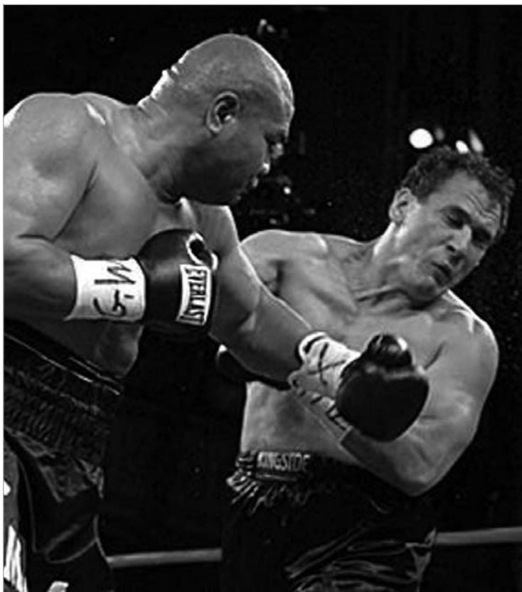
ტუამ ორწლიანი პაუზა კამერონთან ორ რაუნდში შეავსო

ტუას მომავალი მეტოქის ვინაობა იმაზე დამოკიდებულია, რამდენად გაირკვევა მისი მომავალი ორთაბრძოლების ტრანსლაციის უფლება. ახალ-ზელანდიური ტელეკომპანია Maori TV-ის ხელთაა დავიდ ტუას სამი მატჩი, მაგრამ ახალზელანდიელის ჩხუბისთვის იმდენად ცოტა თანხას გა-