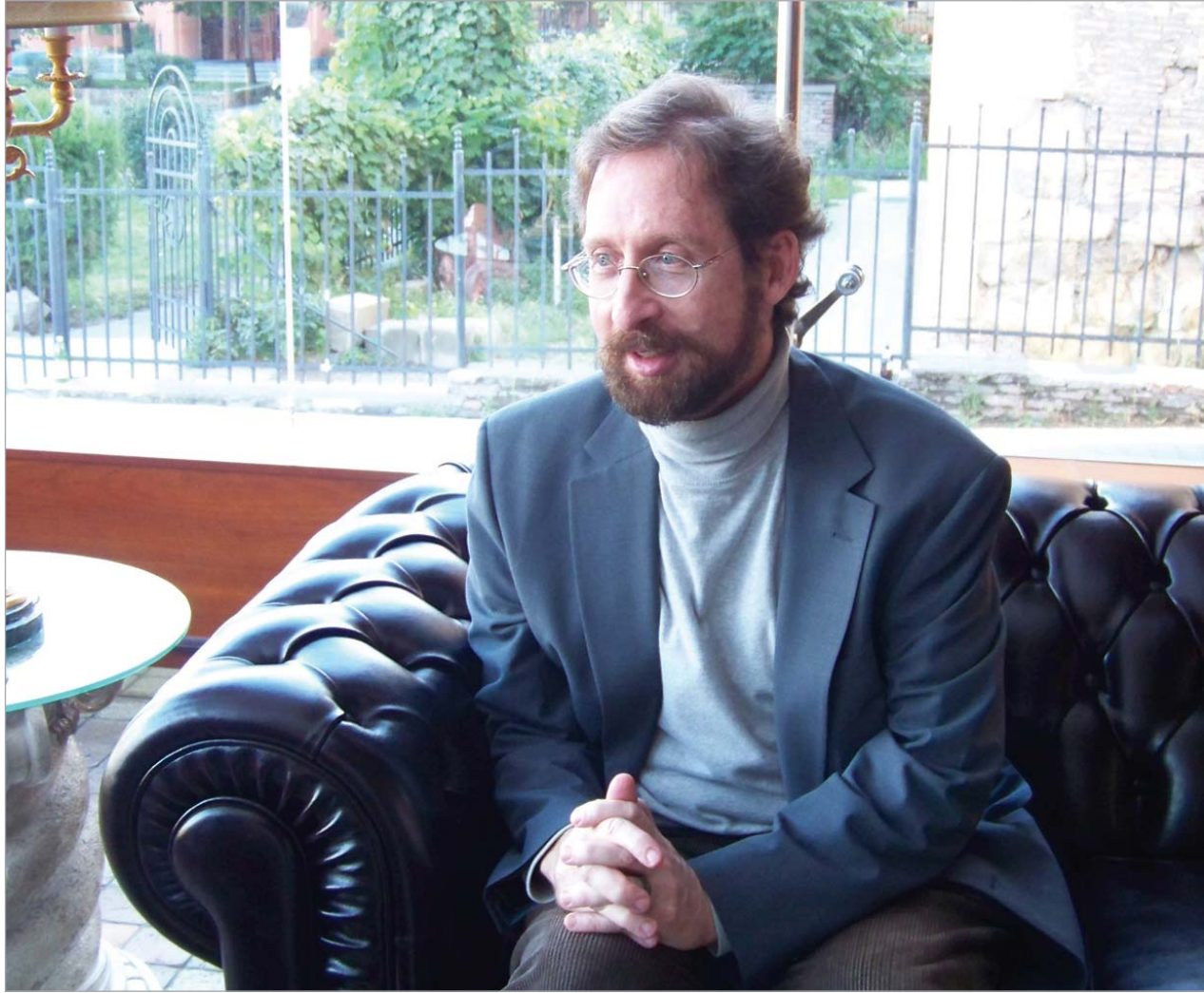
ექსპერტი ენერგეტიკული უსაფრთხოებისა და გეო-ეკონომიკის საკითხებში რობერტ ქათლარი.

- რადგანაც ნაბუკოს ჯერ არ არის აშენებული, ჩვენ არ გვაქვს კონკრეტული შედეგი, ამიტომ დარწმუნებით ვერ ვიტყვი, რომ ეს რეალობაა. მაგრამ, ისევე როგორც სახლის აშენებას, მილსადენის მშენებლობასაც სამი ეტაპი აქვს. პირველ ეტაპზე იდეის მოსინჯვა ხდება, იქმნება ნახაზი, განისაზღვრება, სად უნდა გაკეთდეს, იწყება რესურსების მოძიება. მეორე ეტაპზე ადამიანმა უფრო კონკრეტულად იცის, თუ რა სურს. სახლის შემთხვევაში იგი იმის გარკვევას იწყებს, სად უნდა იყოს ფანჯარა, რა მასალით უნდა გაკეთდეს და ასე შემდეგ. მესამე