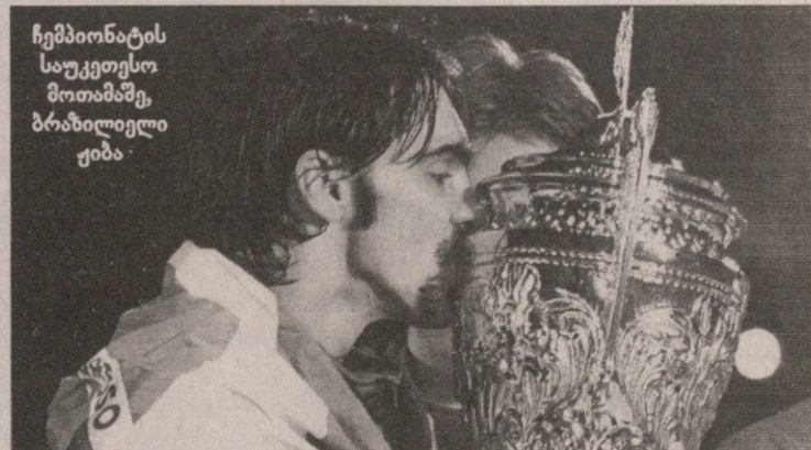
ჩემპიონატის საუკეთესო მოთამაშე, ბრაზილიელი ყიბა