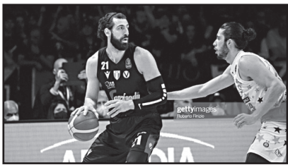
გორც საკუთარ სახლში! მიხაროდა ყოველი დღე, რომლითაც ამ ისტორიული გუნდის ნაწილი ვიყავი!

საქართველოს ნაკრების კაპიტანი და ბოლონის ვირტუსის კალთბურთელი თორნიკე შენგელია იტალიის ლიგის ვიცე-ჩემპიონი გახდა.