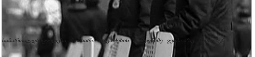
სამართალდამცველები შენობის აფეთქების შემდეგ ვერსიაზე მუშაობენ

ტრში ათასობით ადამიანი იმყოფებოდა. შეკრებილები ქალაქის დღის აღსანიშნავ კონცერტს ესწრებოდნენ. მომხდარიდან რამდენიმე წუთში შეიქმნა სპეციალური საგამოძიებო ჯგუფი, რომლის შემადგენლობაში მოლდოვის შინაგან საქმეთა სამინისტროს, უსაფრთხოების და გენერალური პროკურატურის თანამშრომლები გაერთიანდნენ. სამართალდამცველები მომხდარი აფეთქების რამდენიმე ვერსიაზე მუშაობენ. შესაძლოა, მომხდარს ტერაქტის კვალიფიკაცია მიეცეს, თუმცა ვერსიებს შორის აქტიურად განიხილება ასევე ხულიგნობის ვერსიაც. წინასწარი ინფორმაციით, აფეთქდა საბრძოლო "PG-42". სპეციალისტები ვარაუდობენ, რომ მოწყობილობა დაზიანებული იყო და ის ბოლომდე ვერ აფეთქდა. ამ ვარაუდის საფუძველს ის დაზიანებები იძლევა, რომლებიც აფეთქების შედეგად დაშავებულ მოქალაქეებს აქვთ მიღებული. როგორც ცნობილი გახდა, აფეთქებამდე ცოტა ხნით ადრე, მოლდოვის პრემიერ-მინისტრის პირად ტელეფონზე ანონიმური ზარი განხორციელდა. ზარის ავტორი მინისტრთა კაბინეტის თავმჯდომარის ფიზიკური განადგურებით იმუქრებოდა.