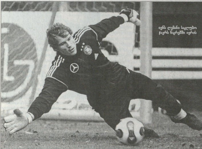
იენს ულმანი სეულში ვაგერს ნაგებობს ირის

D ჯგუფი უელსი — ირლანდია გერმანია — ავსტრია ჩინეთი — სლოვაკეთი ოქტომბერი შინ ჩეხეთის 0:3 დამარცხებული გერმანიის მწვერთვით ირანის ლივი ქომაგებს კარგ ფეხბურთის და გამოკრეგებს