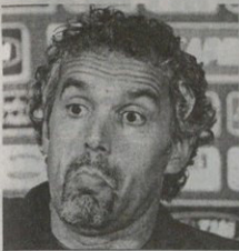
ჯინ ვეს შეცვლის: ღონაღონის ანელოტი, ანელოტის მატრინო