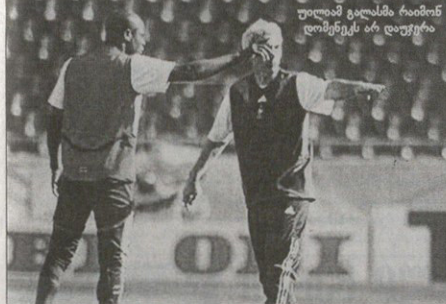
უოლამ გალასმა რაიბინი ღიმენგს არ დაუფრია