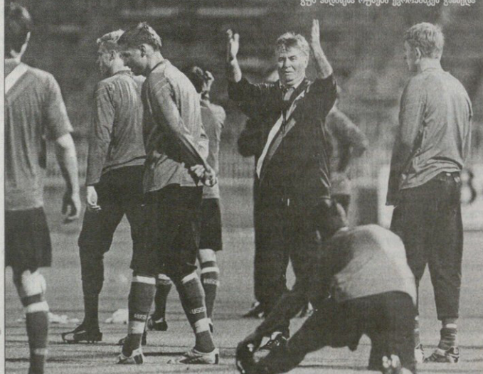
გუს პილინკმა რუსები გერმანიისკენ გააძლია

ისრაელი — ანდორა 4:3; მაკედონია — ინგლისი 0:1; ინგლისი — მაკედონია 0:0; რუსეთი — ისრაელი 1:3; ხორვატია — ანდორა 7:0; ანდორა — მაკედონია 0:3; ხორვატია — ინგლისი 2:0; რუსეთი — ქვინეთი 2:0; მაკედონია — რუსეთი 0:2; ისრაელი — ხორვატია 3:4; ხორვატია — 8-