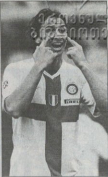
შეხველი ზლატან იბრაჰიმოვის

„ინტერის“ პრეზიდენტი მასში მორავი დარწმუნებულია, რომ მისი გუნდის ვარსკვლავმა, ზლატან იბრაჰიმოვიმ „იუვის“ გემოთხვანაში მიღებულ კაკს უნდა აჯობოს. „ინტერის“ პრეზიდენტი, კაკა აგრანს ფუტბოლის“ წლევენელი გამოკითხვის დაბარებული ფაქტობრივად მორავლა, ფრანგული უწრალი ოფიციალურ შედეგებს 4 დეკემბერს გამოაცხადებს, მაგრამ მისი იცით ჩვეულებრივ როგორც ხდება მარხული რედაქციონად ვილასი ვამარკეუბლის ვინაობა წინასწარ გამოაცხადს ერთი სიტყვით, უკვე მთლად ევროპამ იცის, რომ წლეველს „ბრისი“ კაკას მისცემენ, თუმცა მასში მორავტი არ ცტრება. „ეინ თქვა, რომ ზლატანი საუკეთესო არ არის? — განბრხნდა მღიერია — ის მსოფლიოს საუკეთესო თავდამსხმელია. „იბრა“ ეს ვილად ვაკეუბლები მუტად ვეუთენის, კიდრე ნებისმიერ სხვა ფეხბურთელს ვეცვლად სამართლიანი არჩევანი სწორედ იბრაჰიმოვიჩი იქნება“. თუმცა, რაც უნდა თქვას მორავტი, იმ ვილადე, ვისაც აგრანს ფუტბოლის“ რედაქციონად ხმა გამოაცხადს, თქვა, გამოთხოვლიაგან ვეუ-