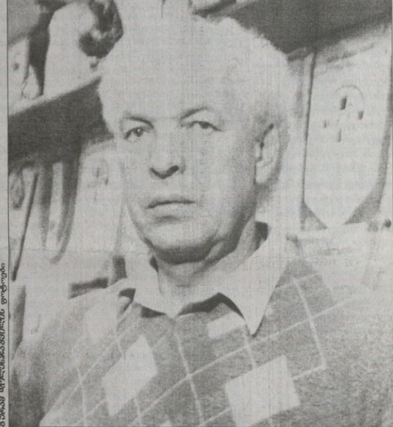
გუნდამ დროინდელაწინააღმდეგო ფოტოგრაფია