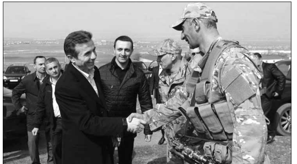
საქართველოს პრემიერ-მინისტრი ბიძინა ივანიშვილი შინაგან საქმეთა მინისტრ ირაკლი ღარიბაშვილთან ერთად იალღუჯას სანვრთნელ ბაზაზე საჩვენებელ ვარჯიშს დაესწრო.