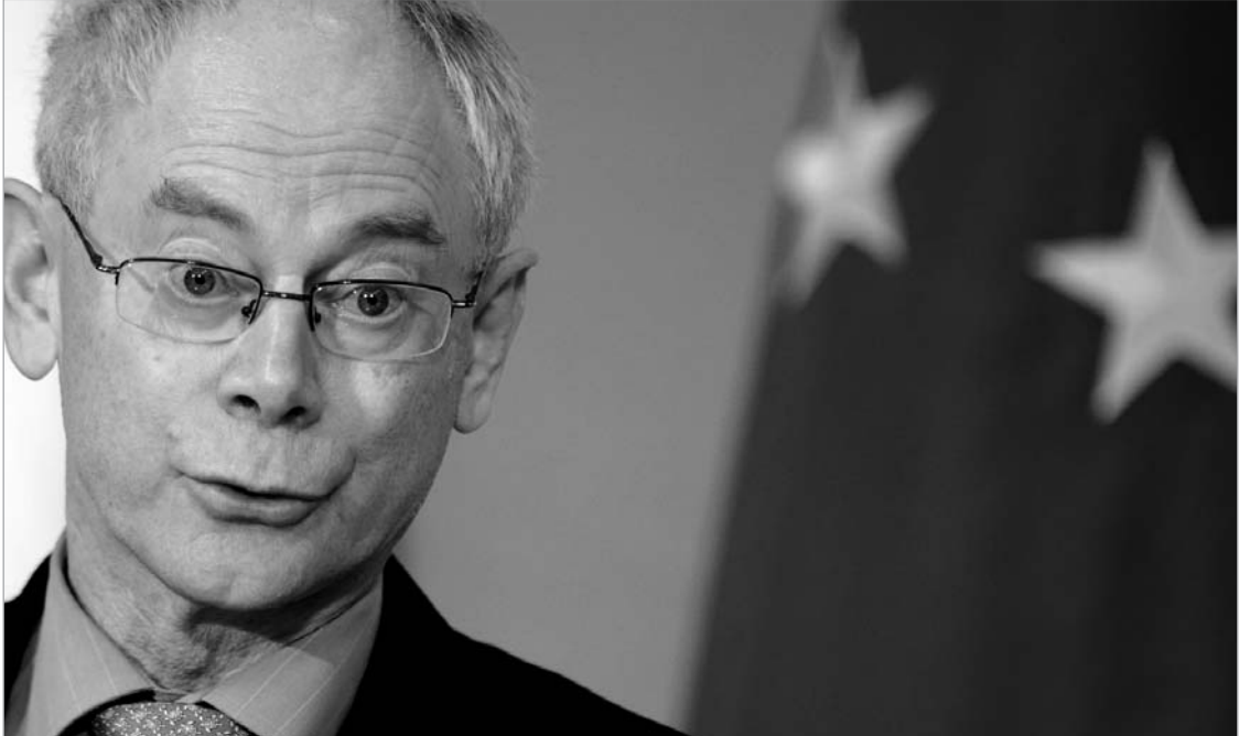
ჰერმან ვან რომპაი

ანალიტიკოსები მიიჩნევენ, რომ შესაძლოა, ლისაბონის ხელშეკრულების ამოქმედება ერთი შეხვედვით დიდ მოვლენად არც მივიჩნიოთ, მაგრამ ევროკავშირის მუშაობაში ის სრულიად რეალურ ცვლილებებს გამოიწვევს. დოკუმენტის მომხრეები ამტკიცებენ, რომ ის ევროპას ბევრად უფრო დემოკრატიულს და ეფექტურს გახდის, მაშინ როდესაც მონიშნულდგეგმები ამტკიცებენ, რომ ევროკავშირის წევრი ქვეყნებს ბრიუსელისთვის ძალიან დიდი უფლებამოსილებების გადაცემა მოუწევთ. ამ ტიპის დოკუმენტზე ლა-