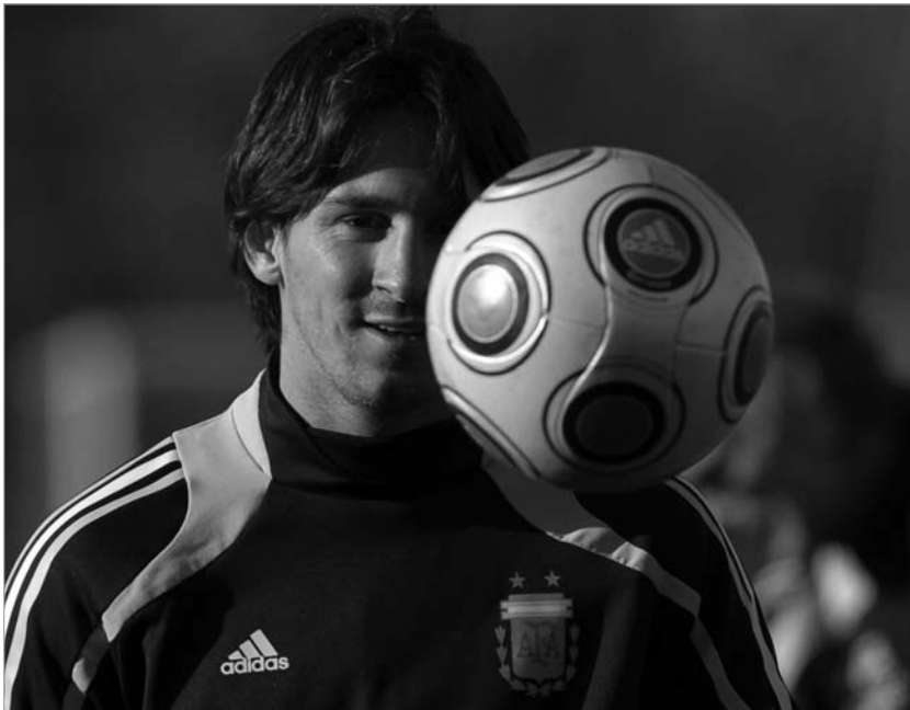
ამერიიდან მესი "ოქროს ბურთითაც" ითამაშებს

საქმე ის არის, რომ შესაძლო 480 ქულიდან არგენტინელმა 473 მიიღო და 233 ქულით გაუსწრო მეორე ადგილზე გასულ კრიშტიანუ რონალდუს. ასეთი დიდი უპირატესობით "ოქროს ბურთი" არავის მოუგია. ამავე დროს მესი ყველაზე ახალგაზრდა ფეხბურთელია, რომელსაც ეს ჯილ-