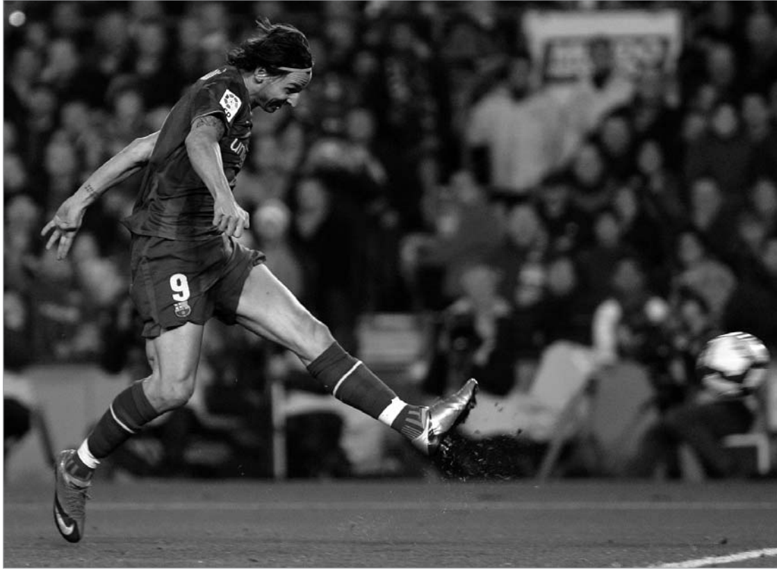
ამ დარტყმით ზლატან იბრაჰიმოვიჩმა "კლასიკო" მოიგო

2004 წლის აგვისტოში ერთ-ერთ ინტერვიუში ჟურნალისტმა ზლატანს ჰკითხა,