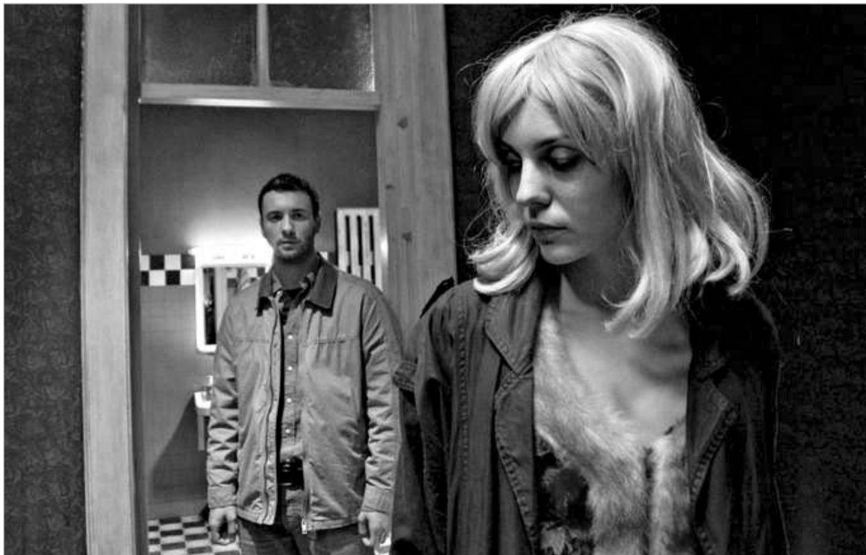
ეს ყველაფერი არ არის

40-45 ან მეტი წლის "ჩამბალი" ნარკომანები არიან, მთელ დღეებს ქუჩაში ატარებენ და მხოლოდ ერთ რამეზე ფიქრობენ - სად იზოვნონ "წამლის" საყიდელი ფული, როგორ წავიდნენ "ბარიგასთან", სად შეიყურონ და ვინ რამდენი ხაზი გაიკეთოს. სად არის მათი თავშესაფარი ადგილი? სკოლის გვერდით - ერთი ჩვეულებრივი სკოლის გვერდით, როგორც თბილისში და მთელ საქართველოში, მთელ მსოფლიოში უამრავია. სწორედ ეს ფაქტორია პირველი მიზეზი, რის გამოც თვალზე და ყურებზე ხელაფარებულმა მასშტაბებელმა იმაზე უნდა დაიწყოს ფიქრი, რატომ უნდება 16 წლის ბიჭს ნარკოტიკის გასინჯვა და რატომ მიაჩნია ეს მამაკაცობაში გადასასვლელი პერიოდის აუცილებელ ეტაპად. თუ კოლუაშვილის ფილმის "უფროს" ნარკომანებს კიდევ შეუძლება მოეძებნოს გამართლება და ითქვას, რომ ისინი 90-იანი წლების დაკარ-