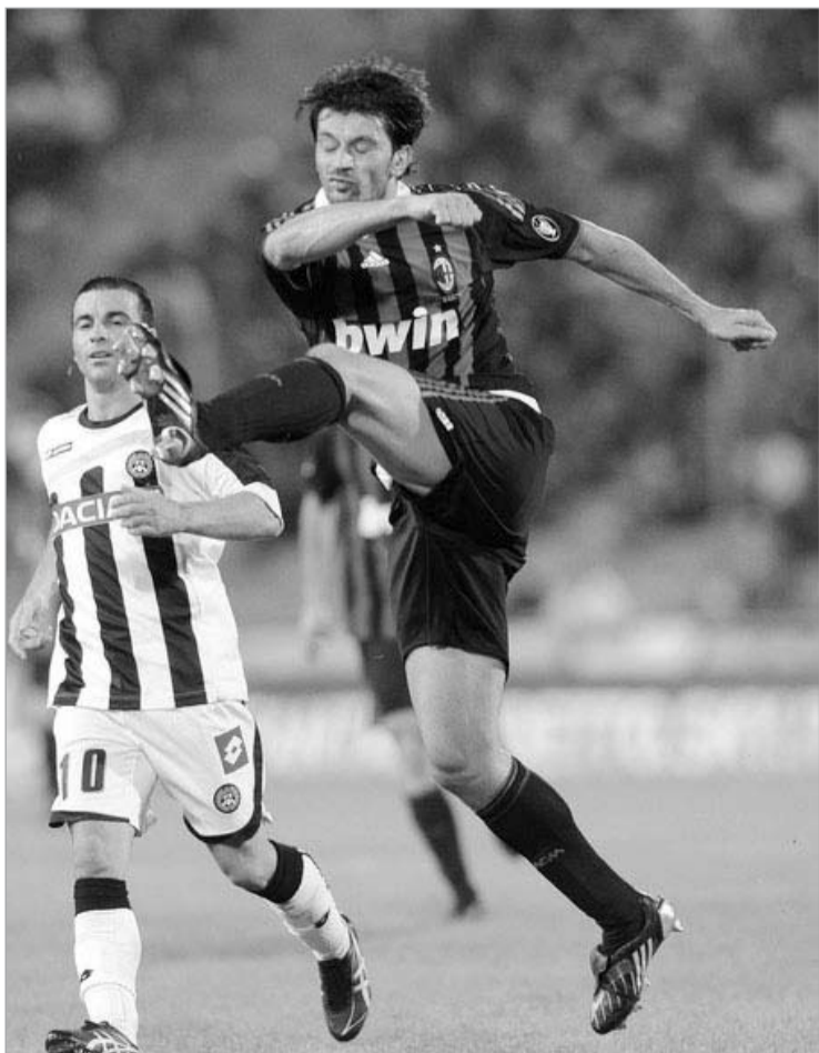
კალაძე "სამპდორიასთან" მძიმე ბრძოლას ელის