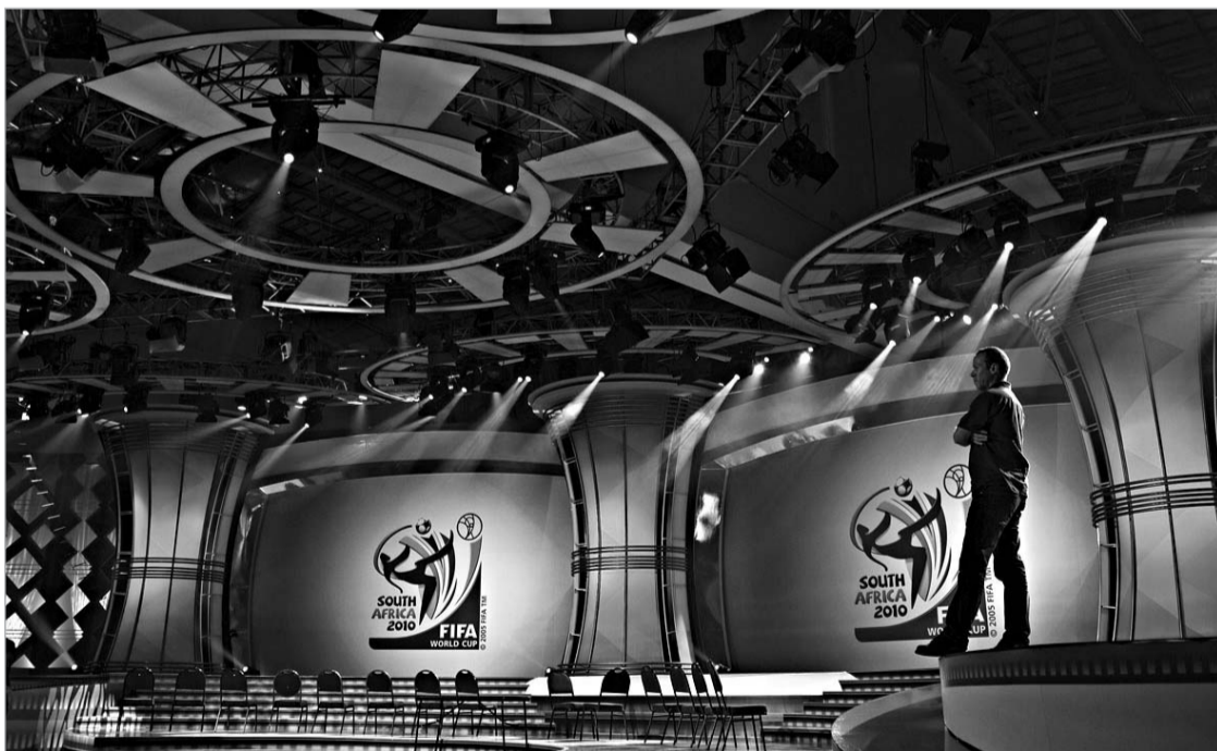
წილისყრა ამ დარბაზში გაიმართება

წილისყრის ცერემონიალს პოლიფუნდის ვარსკვლავი, სამხერთაფრიკელი მსახიობი, ოსკარის მფლობელი შარლიზ თერონი წაუძღვება. კვიტაუნის ესტუმრა სპორტის ცოცხალი ლეგენდა, მსოფლიოსა და ოლიმპიური თამაშების ჩემპიონი, ეთიოპიელი სტაიერი ჰაილე გებრესელასე. ცხადია, ასეთი ღონისძიება ყველაზე პოპულარული ფეხბურთელის გარეშე არ ჩაივლის - კვიტაუნში წილისყრის ცერემონიალის ერთ-ერთი მთავარი გმირი იქნება ინგლისელი ვარსკვლავი დევიდ ბექჰემი, რომელსაც გვერდს დაუმშვენებენ სამხრეთ აფრიკის ფეხბურთელთა ნაკრების ლიდერი მეთიუ უტი, ამავთვე ქვეყნის მორაგბეთა ეროვნული გუნდის კაპიტანი ჯონ სმიტი და კრიკეტისტთა ნაკრების პირველი ფერადკანიანი წევრი მაჰია ნტინი. სავარაუდოდ, ამ ღონისძიებას 350-მილიონიანი ტელეაუდიტორია ეყოლება. მოკლედ, ყველაფერი ეს ხვალისთვის არის დაგეგმილი. მანამდე კი კვიტაუნში ფიფას მალაჩინოსნები მუშაობდნენ და