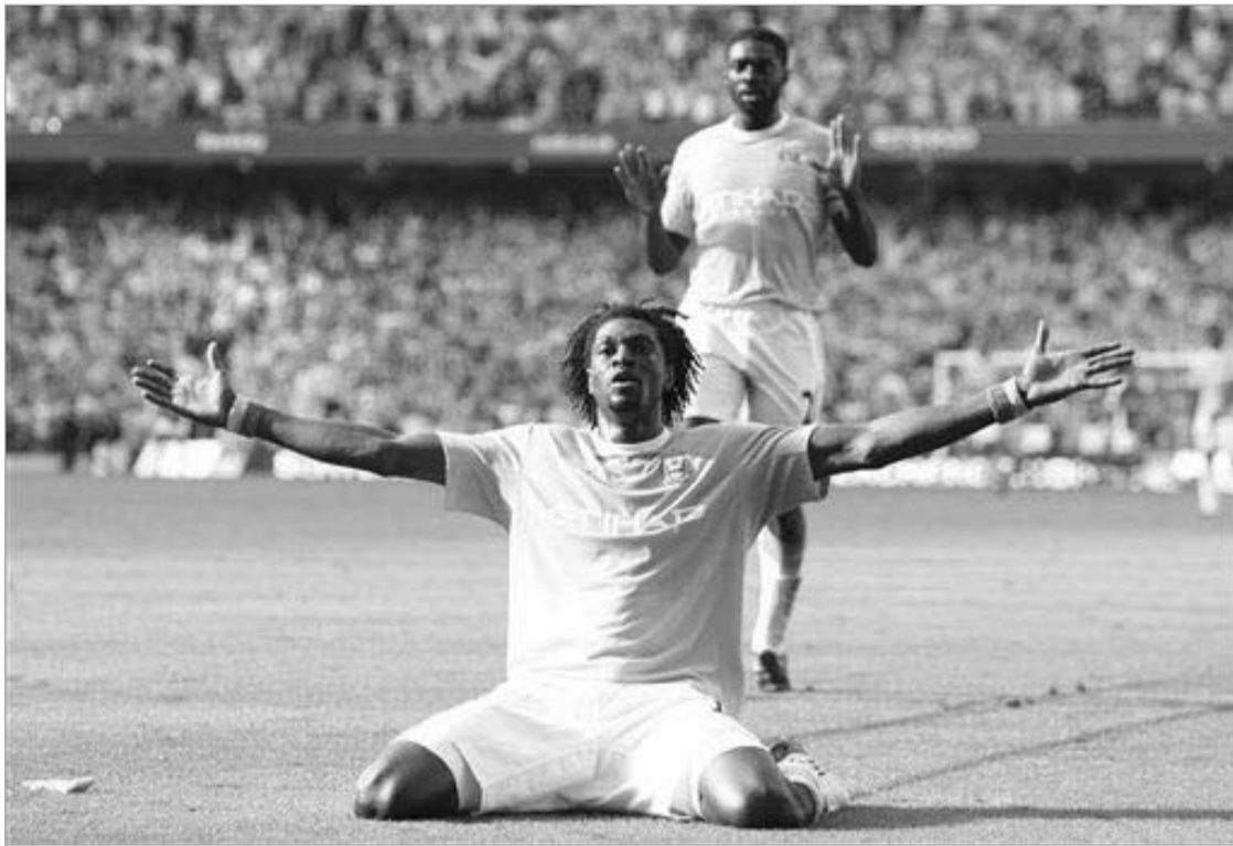
ადებაიორი "არსენალის" კარში გატანილი გოლის შემდეგ

"რა თქმა უნდა, მომხდარს ვნაობ. შეცდომისგან არავინ არ არის დაზღვეული. მთავარია, მეტი მაინც გამოიტანო სწორი დასკვნები და შეცდომა არ გაიმეორო. ბარაკ ობამა შემეცდარა, ცდებოდა კრიტიკულად მსაჯის შეურაცხყოფის გამო. რაც შემეხება მე, მართლაც ძალიან ცუდად მოვიქეცი. იმით, რაც ჩავიდინე, პირველ რიგში, ჩემს მშობლებს ვატყინე გული.