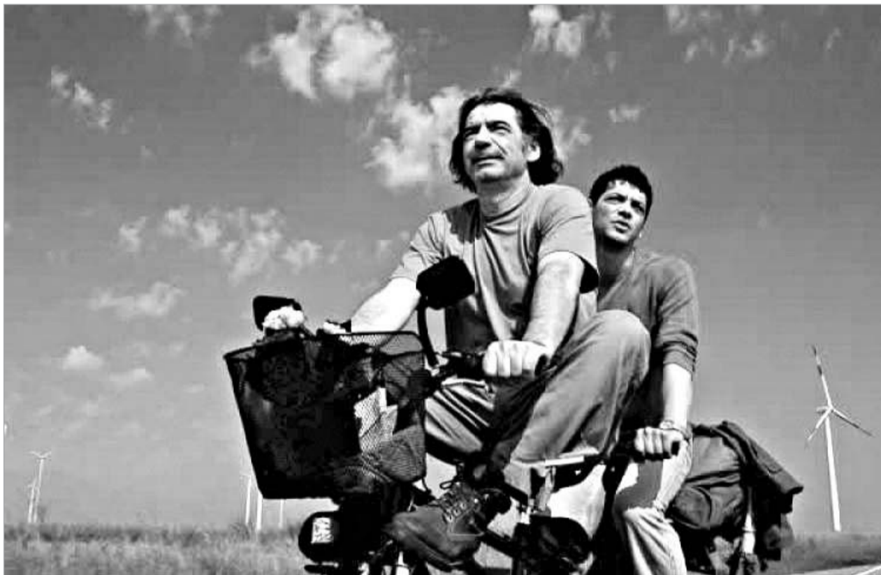
ქვეყანა დიდია და ხსნაც სადღაც აქვია

კინო მხოლოდ ისტორია, მხოლოდ ფურცელზე დაწერილი სცენარია არაა. კინო სწორედ ის გამოქვაბულია საშუალება, რომელიც ადამიანს ყველაზე ღრმად დამალული გრძობების, განწყობის, სამყაროს აღწერისა და გაზიარების შესაძლებლობას აძლევს. როგორც ჩანს, ლევან კოლუაშვილმა ეს კარგად იცის, რადგან ზედმინევენით შეძლო ამ პატარა ისტორიის მასშტაბისთვის ხელის გულივით გადაშლა. ფილმის მთავარი "გმირები"