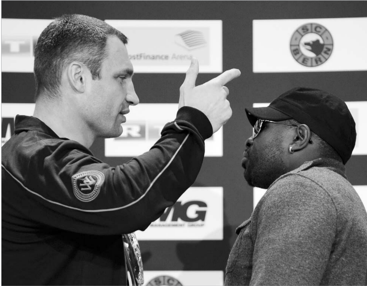
ჭონსონს კლიჩკოს გაბარიტები აღიზიანებს