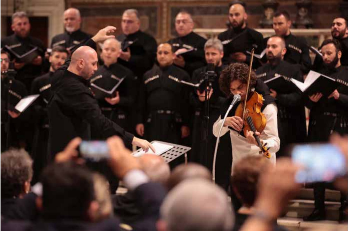
პატრიარქის „ავე მარია“ და სამების გუნდის შთამბეჭდავი კონცერტი ვატიკანში

დღეს, სიქსტეს კაპელაში, მიქელანჯელოს მიერ მოხატულ თაღებქვეშ აჟღერებული ქართული „კირი-ეელეისონი“ ესმოდა ხანძთის დიდებულ ნანგრევებს, მეომარივით მედგრად წამომართული ოშკის გუმბათს, წართმეულ ათასწლოვან ათონის ივერონის კედლებს, შოთა რუსთაველის დაობლებულ ფრესკას იერუსალიმის ჯვრის მონასტერში, ბაკურიანისძის პეტრინონის ქართულ აკლდამებს, ნაფოტებად ქცეულ ლაღის მშვენიერ ეკლესიას... ესმოდათ იმის დასტურად, რომ მიუხედავად არაერთი რბევისა, ნგრევისა თუ აოხრებისა, მაინც არ გადავშენდით, მაინც ამაყად ვდგავართ და მსოფლიოს საკაცობრიო საგანძურის მცველებად შემოვრჩით“.