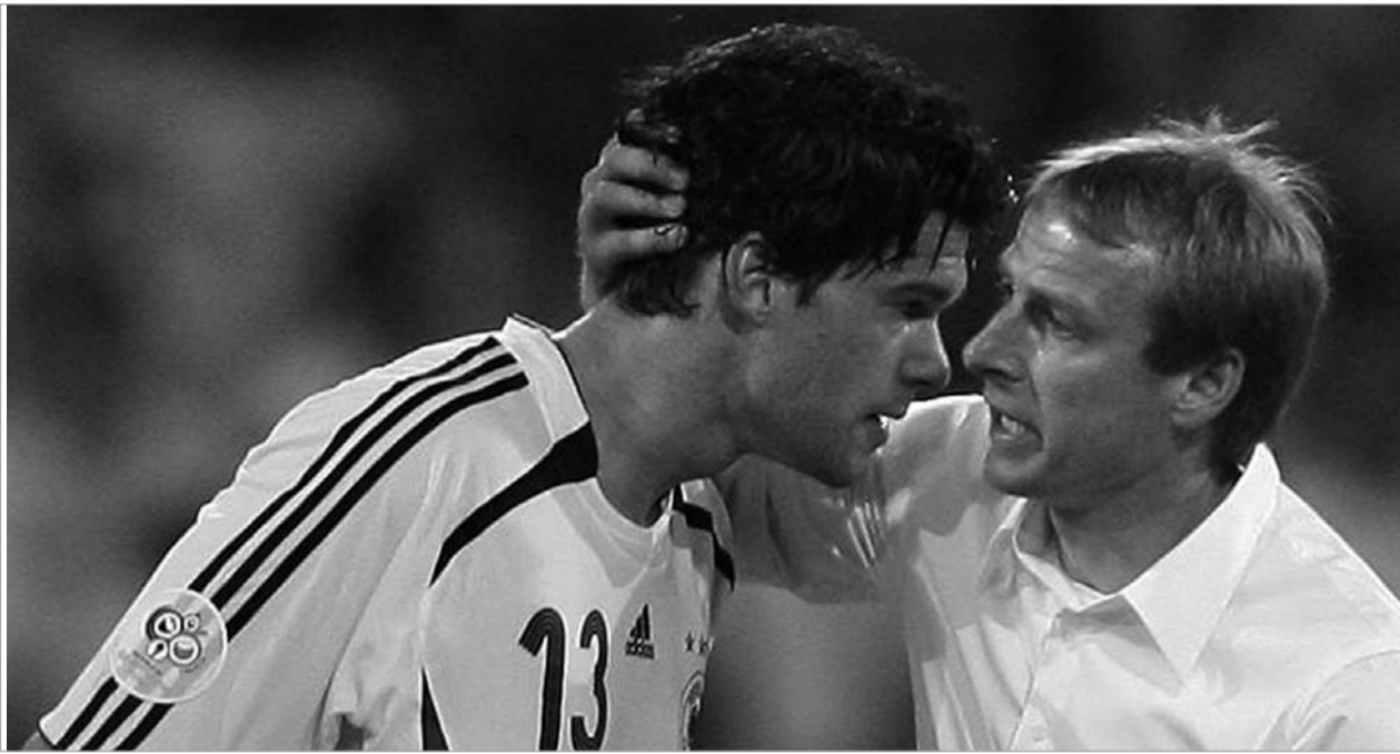
კლინსმანი სიურპრიზებს ელის

იურგენ კლინსმანის სამწვრთნელო კარიერა შედარებით ხანმოკლე გამოდგა. 2006 წლის მუნდიალზე მან გერმანიის ნაკრებს ბრინჯაოს მედლები მოაგებინა, შემდეგ მიუნხენის "ბაიერნი" ჩაიბარა, მაგრამ გუნდი მალე დატოვა და ახლა ოჯახთან ერთად კალიფორნიაში ცხოვრობს. დაახლოებით სამი კვირის წინ კეიპტაუნში გამართულ წილისყრას "კლინსიმ" ტელევიზიით ადევნა თვალყური, რამდენიმე დღის წინ კი ფიფას ოფიციალურ ვებგვერდზე გამოქვეყნდა გაამერიკელებული გერმანიის ინტერვიუ, რომელიც მთლიანად მომავალ მსოფლიო ჩემპიონატს ეხება.