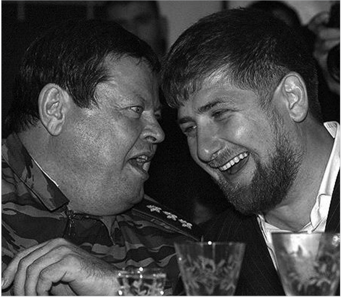
რამზან კადიროვი ჩეჩენი ხალხის დამპყრობ გენერლებთან მეგობრობს