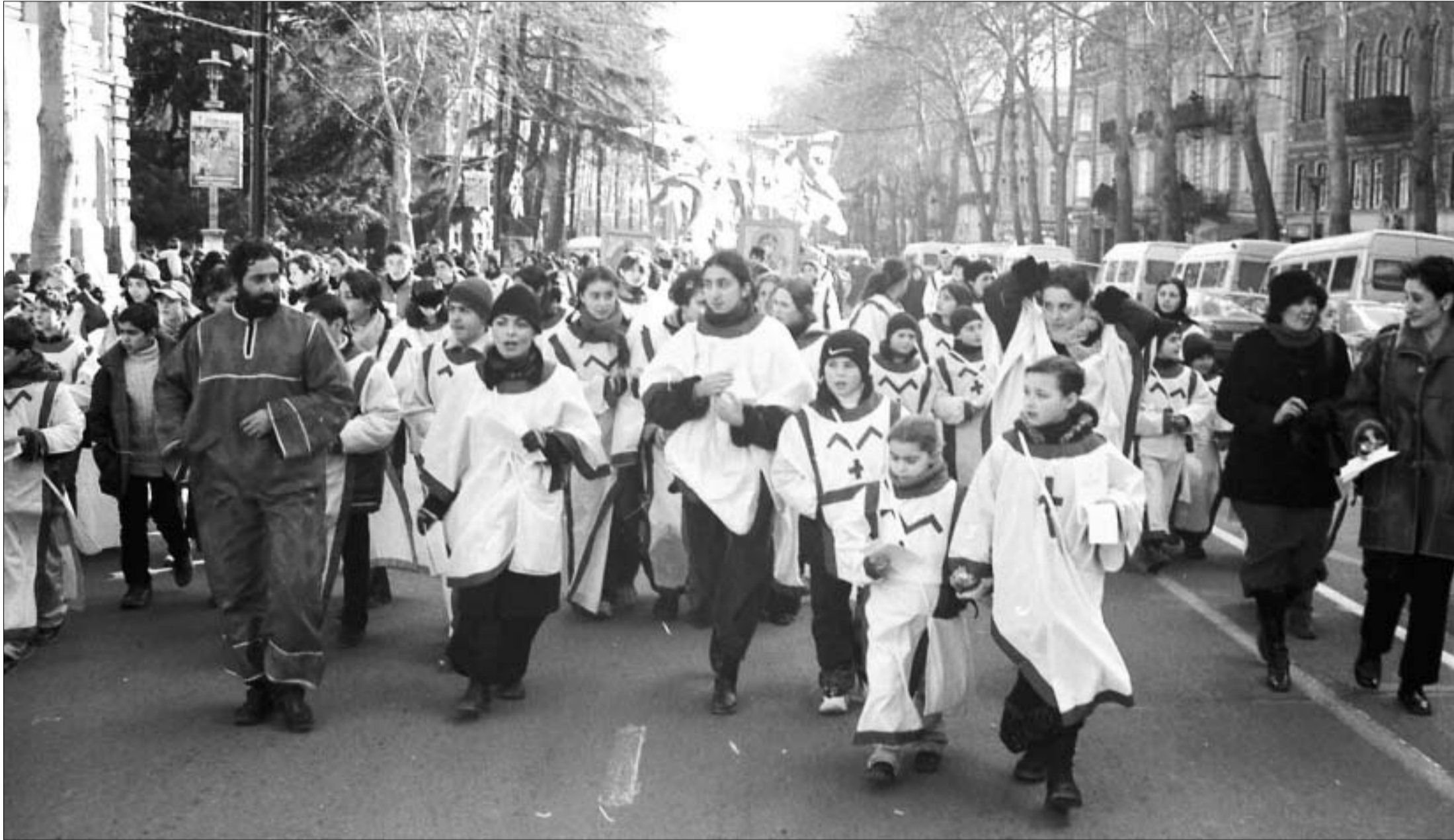
ალილოზა თბილისის ქუჩებში

გუშინ დილიდანვე, თითქმის, ყველა მოქმედი ტარიდან, წინასწარ შეთანხმებული მარშრუტით, თბილისის ქუჩებში სახალხო მსვლელობა - "ალილო" დაიწყო. მრევლის გარდა, ალილოს მსვლელობას მალე ფეხით მოსიარულეებიც შეუერთდნენ. ეს ძველი ტრადიცია საქართველოში ოთხი წლის წინ აღადგინეს.