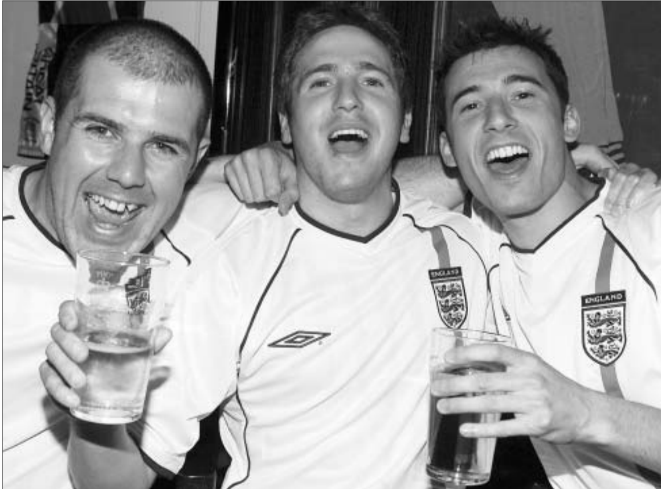
ლუდი - ინგლისელი ფანების განუყრელი სასმელი