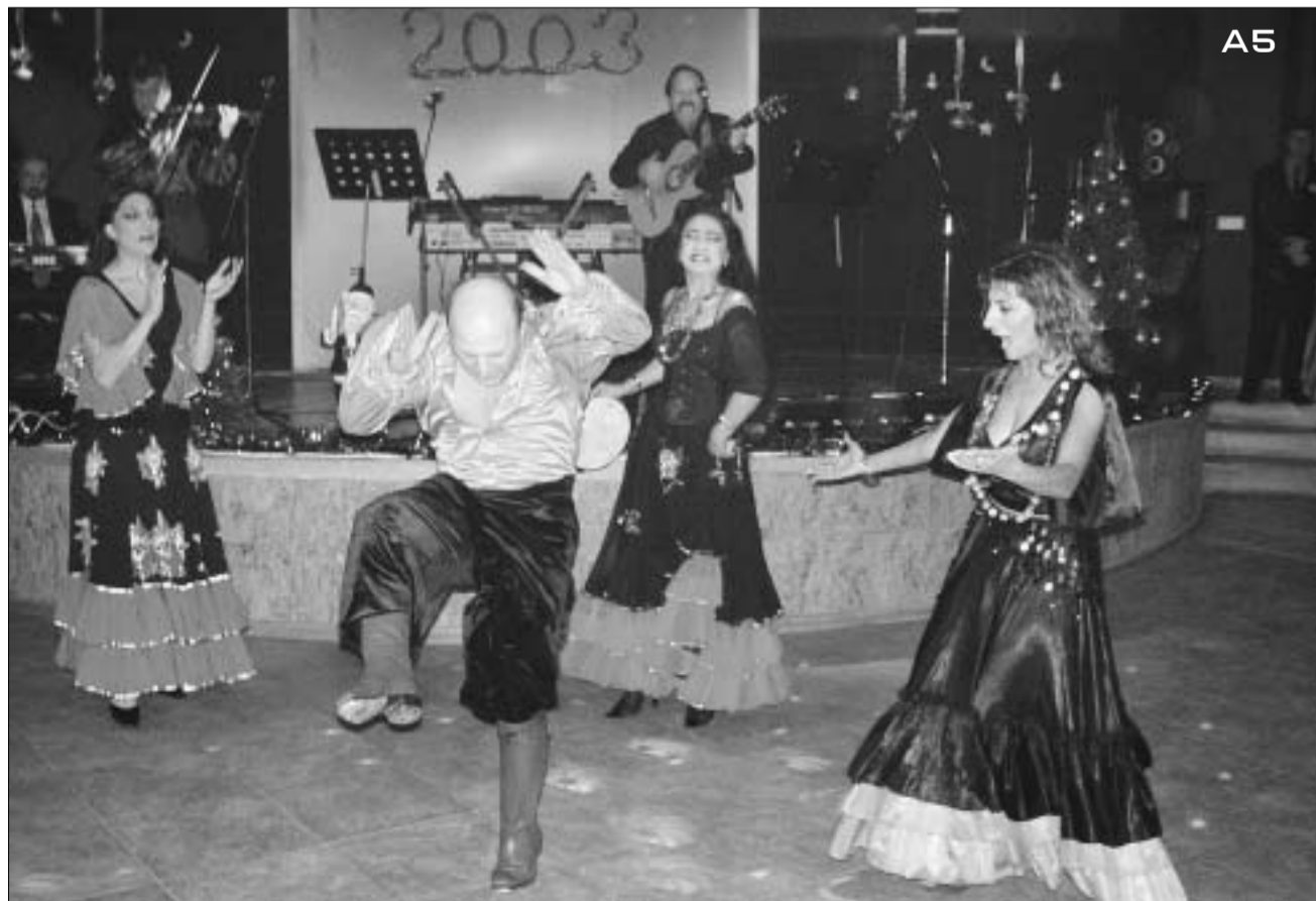
რომინი "სოფლის სახლში"