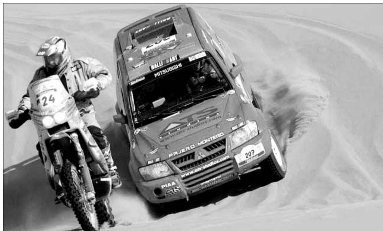
რაილის მონაწილენი უდაბნოში