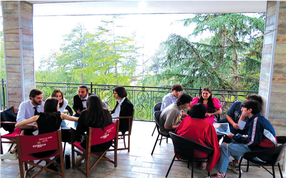
მერიის განათლების, კულტურისა და სპორტის სამსახურის და ხაშურის საგანმანათლებლო რესურსცენტრის წარმომადგენლები, უკომპრომისო

მორიგი სეზონის ფინალური შეხვედრა, სადაც მონაწილეობას იღებდნენ ხაშურის მესამე და მეშვიდე, სურამის მესამე და ოსიაურის საჯარო სკოლები, ეობულეთში ჩატარდა კომპეტენტურმა ჟიურიმ, რომლის შემადგენლობაში შედიოდნენ ხაშურის მუნიციპალიტეტის