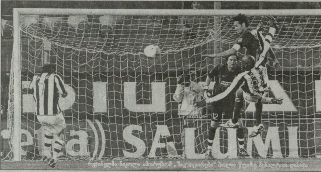
იუვენტუსის ნაყოლი ამორუზომ „შავ თეთრებს“ ბოლო წუთზე პენალტია დასწავს

ნი 79), პორტანოვა, ლორია, როსი, იაროლიმი (გალოპა 63), კოდრა, ვერგასოლა, ლოკატელი, ფრიკი, რიგანო (ფორესტიერი 59) მწვრთნელი: მარიო ბერეტა გაფრთხილება: ბერტოლო, ფრიკი, პორტანოვა, პელეგრინო მსაჯე: ჩელი 13 000 მაყურებელი