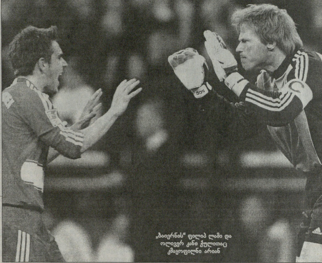
„ბაიერნის“ ფილბ ლამი და ოლივერ კანი ქულითაც კმაყოფილნი არიან

ბუნდესლიგაში შაბათს ერთმანეთს აგინეს და გოლების გატანაში იძუწეს. უხვეგოლიანობით გამორჩეულ ჩემპიონატში გუშინწინ ექვს მატჩში ცხრაზე მეტი არ გავიდა.