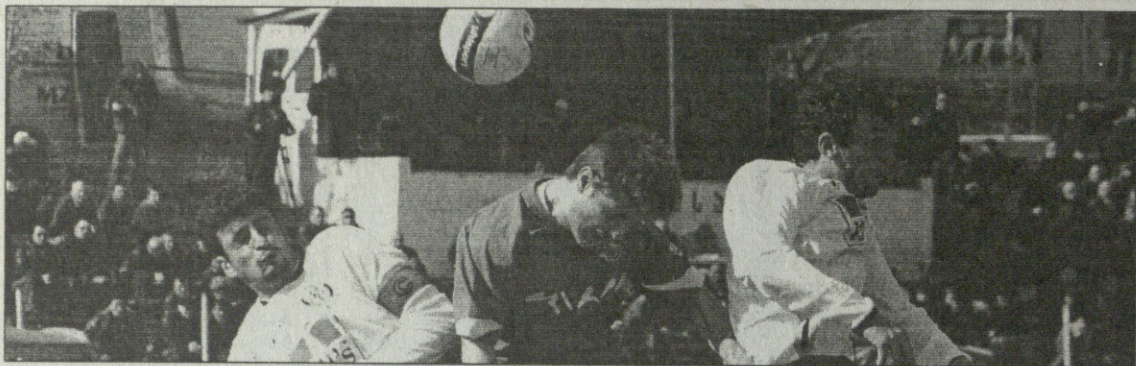
მურმანი ფორვარდის მომზადება