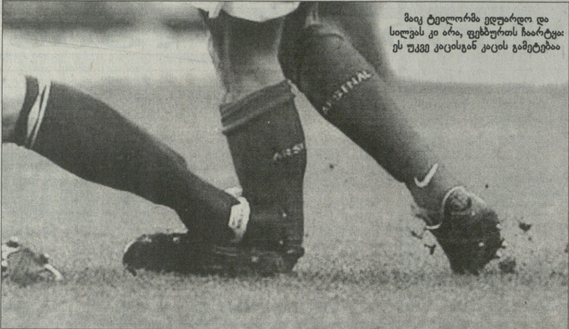
მაიკ ტილორიმა ედუარდო და სილვას კი არა, ფეხბურთს ჩაარტყია: ეს უკვე კაცისგან კაცის გამეტებაა

სვორთი, ევანსი, კოლინი, უიტბიდი, ლიდბიტრი (იორკი 79), ეტუბუ მერფი (პრია 84), რიდი (როზა 70), ჯონსი მწვრთნელი: როი კინი გაფრთხილება: ჯონსონი, კოლინი, იორკი მსაჯე: დიუფი 20 139 მაყურებელი ფულემი 0:1 მისტ კეში 0:1 სოლანო (87) ფულემი: ნიემი, სტალტერი, ჰიუზი, პანგელანდი, კონსეკი, ანდრეასენი, ბალარდი, მერფი, დემპსი (ჯონსონი 76), მაკბრაიდი, კამარა მწვრთნელი: როი ჰოჯსონი მისტ კეში: გრინი, ნილი, ფერდინანდი, აპსონი, მაკკარტი, ლიუნგბერგი (სემ ქტორი 90), მალინი, ფობერი (სოლანო 63), ნობლი, ზოა მორტე, კ. კოული (ემტონი 80) მწვრთნელი: ალან კერბილი გაფრთხილება: მერფი, პანგელანდი, ანდრეასენი, ანდრეასენი გაძვევა: ანდრეასენი (88) მსაჯე: ვეზი 25 280 მაყურებელი