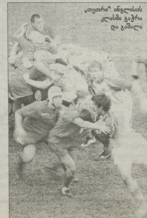
„თეთრი“ ინგლისის კლასმა გაჭრა და გაშალა

ევროპის 18-წლამდელთა ჩემპიონატზე საქართველოს ნაკრები მესამედ თამაშობს. შარშანწინ ჩვენები მე-7 ადგილზე გავიდნენ, შარშან კი შედეგი გააუმჯობესეს და ერთი საფეხურით დაწინაურდნენ. ახლაც, უმცროსი „ლელოების“ მთავარი მიზანი ელიტიდან არგავარდნაა, რისი გზაც რუსეთზე გადის.