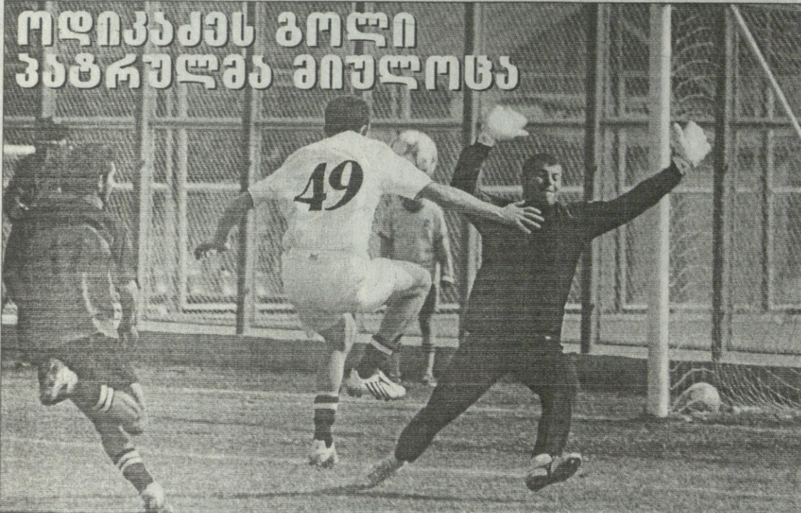
თბილისი. 15 მარტი. 15 საათი. მირანდი. 150 მაყურებელი