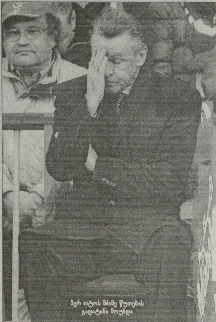
მერ იტონს შიშიე წუთების გადატანა მოუხდა

იელიჩის გოლებს შორის, 28-ე წუთზე, ლუკა ტონის წაქცევისთვის დანიშნული პენალტის შესრულება რიბერიმ იკისრა და გერმარდ ტრემელმა ფრანგს აულა. „ბაიერნმა“ მთელი მატჩის განმავლობაში საგოლე მომენტი ვერ შექმნა და მხოლოდ კუთხურებით თუ საჯარიმოებით აწუხებდა მეტოქეს; მასპინძელ შაო უიას კი 76-ეზე შეეძლო მესამის გატანა, როცა ახლოდან ძლიერად დაარტყა, მაგრამ კანმა იყოჩაღა.