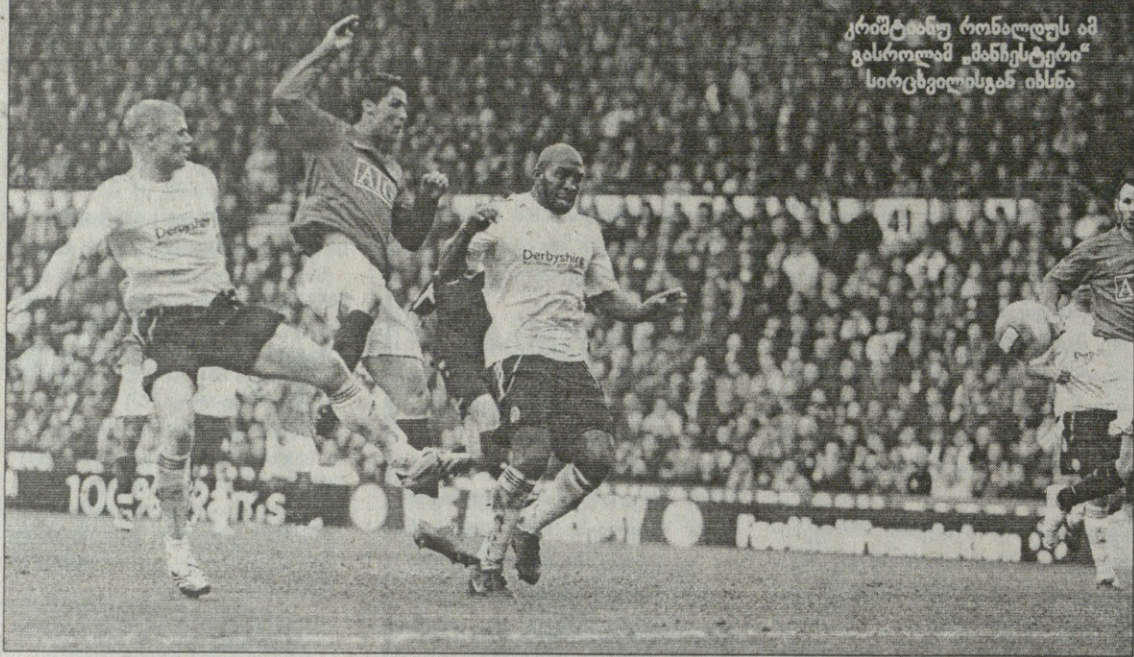
კომპლექსურონალდუს ამ გასროლამ „მანჩესტერი“ სირცვილსგან იხსნა

ჯონსონი (პიბერტი 14), აიგბენი მწვრთნელი: დევიდ მოიესი გაფრთხილება: მერფი მსაჯი: ბენეტი 25 262 მაყურებელი სიტი 2:1 ტოტენჰემი 0:1 კინი (32), 1:1 აირლენდი (59), 2:1 ონუოპა (72) სიტი: პარტი, ონუოპა, დანი, გარიდო, ჩორლუკა, აირლენდი, ელანო (კასედი 75), მ. ჯონსონი, ფლასონი, მგარუარი (უბი 88), კასტილი (ვასელი 71) მწვრთნელი: სვენ-გორან ერიკსონი ტოტენჰემი: რობინსონი, ჩიშონდა, დო- უსონი, ვუდეტი, პატონი, ჯენსი, მა- ლბრანტი (ოპრა 67), ზოკორა, ლენო- ნი (მადლსტონი 46), კინი (დ. ბენტი 67), ბერბატოვი მწვრთნელი: ხუანდ რამოსი მსაჯი: კლატენბურგი 40 180 მაყურებელი