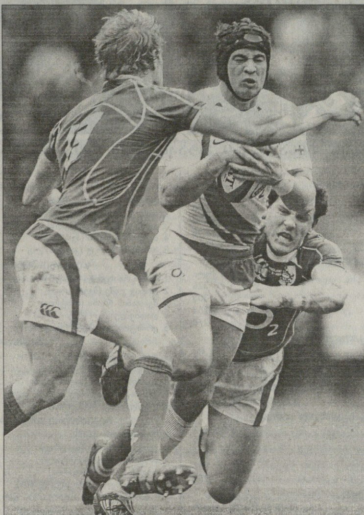
ინგლისელმა სიპრიანმა ირლანდიელები არ მოასვენა

რი დისციპლინა საფრანგეთთან მატჩში თავს საუკეთესო ფორმით იჩენს და უკან დასახვე გზას არ დაგიტოვებთ.