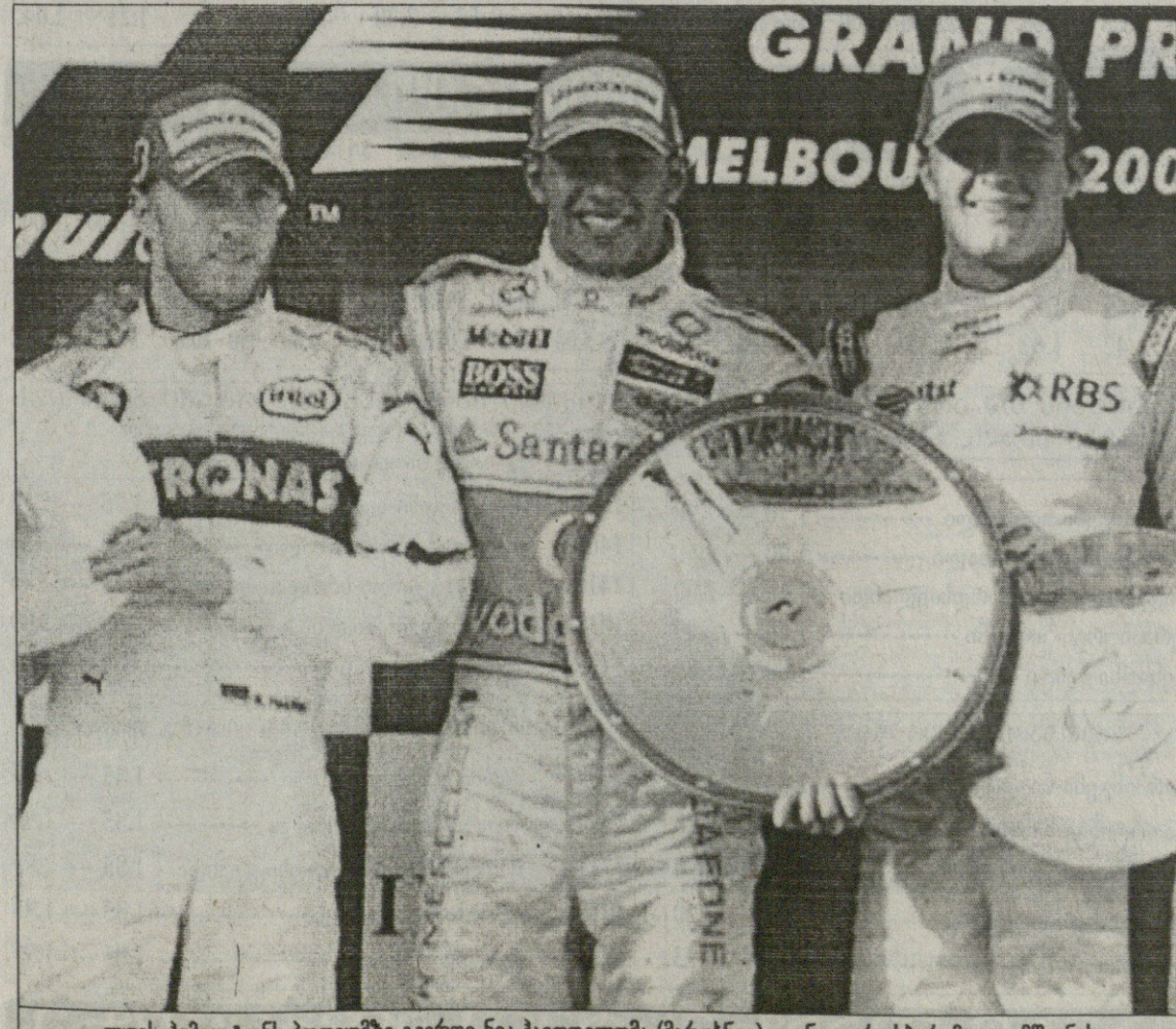
ლუის ჰემილტონს პოლიუმზე გვერდი ნიკ ჰაიდფელდმა (მარცხნივ) და ნიკო როსბერგმა დაუმშვენეს

ლოსკენ კოვალაინენს ლამაზადაც გაასწრო და მანქანიდან მაქსიმუმი გამოწურა. აი, ასეთი, ცოტა არ იყოს, უცნაური გამოდგა წლებანდელი ჩემპიონატის პირველი „დიდი პრიზი“, რომელმაც დაგვანახა, რომ ერთი შეხედვით უძლეველ „ფერარისაც“ შეიძლება ჰქონდეს პრობლემები და თანაც, კაცმა რომ სიძარულე თქვას, „სკუდერიაში“ ვერც სისწრაფით აჯობა „მაკლარენს“. ამ ორი გუნდის სახლოვეს „BMW-ზაუბერია“ და იქვეა „უილიამსიც“. „რენო“ კი, ალბათ, მოუმატებს. კახა ლომაძე