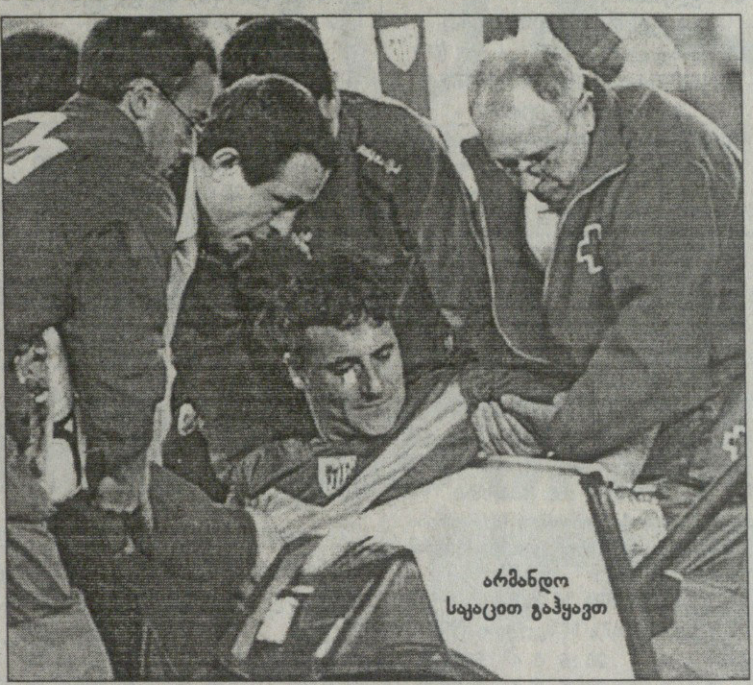
არმანდო საკაცით გაიყავით

ბალორკა: მოია, რამისი, ფ. ნავარო, ვარელა, ნუნესი, ექტორი, ბასინასი, იბაგასა, არანგო, ხონასი (ტურე 77), გიზა (ვალერო 56) მწვრთნელი: გრეგორიო მანსანო გაფრთხილება: ნავარო, ექტორი, ვალერო, იბაგასა, ლოლა, ბალესტეროსი, ბასინასი გაძეგება: ბალესტეროსი (89) მსაჯე: პარადას რომერო 30 000 მაყურებელი