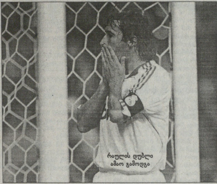
რაულის დუბლი ამაო გამოდგა

სარაგოსა 1:1 ალმერია 1:0 ოლივირა (68), 1:1 ნეგრედო (87) სარაგოსა: სესარი, დიოგო, პარედესი, აიალა, ხუანფრანი, ოსკარი, ლუქსენი, გაბი, სერხიო გარსია (მატუზა-ლევი 62; საპატერი 75), რ. ოლივირა, დ. მილიტო (სელადესი 85) მწვრთნელი: ხავიერ ირურეტა ალმერია: დიეგო ალვარი, ბრუნო, რ. პულოდი, გარსია კარლოსი, ხუანიტო (სორიანო 68), ფელიპე მელი, კორონა, ხ. ორტისი (კალუ უჩე 80), მანუ ნეგრედო, დომინგო კოსმა (კრუსატი 68) მწვრთნელი: უნაი ემერი გაფრთხილება: გაბი, ხუანიტო, დომინგო კოსმა, გაბი, აიალა, კორონა გაძეგება: გაბი (60) მსაჯე: იტურალდე გონსალესი 40 000 მაყურებელი