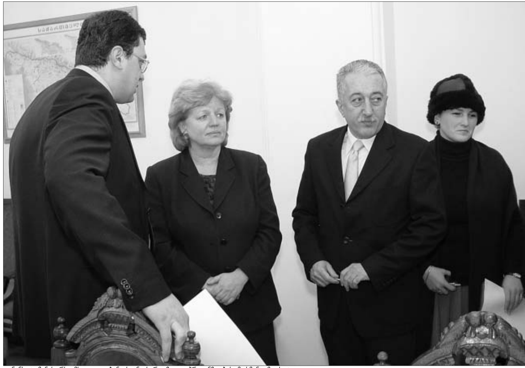
ფინანსთა მინისტრს მსოფლიო ბანკისგან, სერიოზული პრეტენზიების მოსმენა მოუხდა.