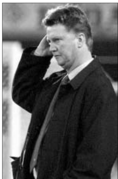
ლუის ვან გაალი

კვირას “ბარსელონას” მწვრთნელს, ლუი ვან გაალს, გამოცდა ჰქონდა, უკვე მერამდენე... ვერ კიდევ “სევილიასთან” მატჩის შემდეგ, როდესაც “ბარსა” შინ 0:3 დამარცხდა, გუნდის ხელმძღვანელობამ პოლანდიელს ულტიმატუმი წაუყენა - მომდევნო მატჩში მას აუცილებლად უნდა გაემარჯვა. მაშინ ვან გაალი გაძევებას გადაურჩა, ერთი კვირის წინ, “ვალენსიასთან” განცდილი მარცხის შემდეგ, მწვრთნელი კვლავ დადგა გამოცდის წინაშე - კვირას, ვიგოს “სელტასთან” მატჩი, მას აუცილებლად უნდა მოეგო, წინააღმდეგ შემთხვევაში, 24 საათში პოსტიდან გაათავისუფლებდნენ. როგორც გაირკვა, ვიგოში გამართული მატჩი უკანასკნელი იქნება ვან გაალის კატალიზური კარიერაში: “ბარსელონა” ისევ დამარცხდა - 0:2.