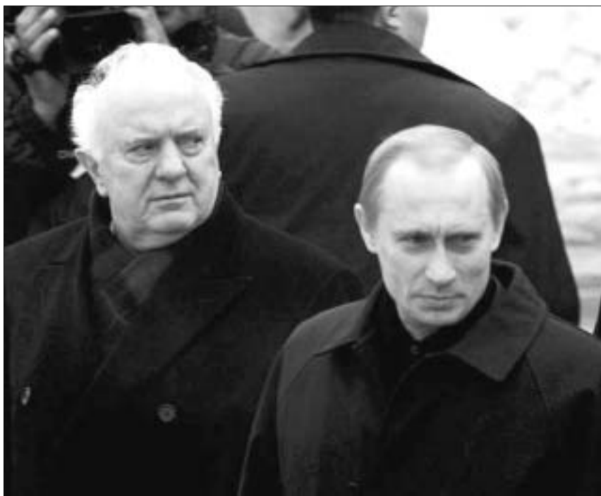
ყინვის მიუხედავად, პრეზიდენტები ურთიერთობის დათბობას შეეცდებიან.

მოსკოვის პოლიტიკური წრეები ყურადღებას აქცევენ მეორე არანაკლებ საინტერესო დეტალსაც - აფხაზეთის მიმართულებით სარკინიგზო მიმოსვლის აღდგენით უკვე დაიწყო სომხეთ-რუსეთის მთავარი სარკინიგზო მაგისტრალის აღდგენის უზილავე პროცესიც. "ამ მხრივ, შევარდნაძე-პუტინის ერთი-ერთზე შეხვედრა მხოლოდ მოსკოვის პოზიციის გაძლიერებას მოემსახურება,