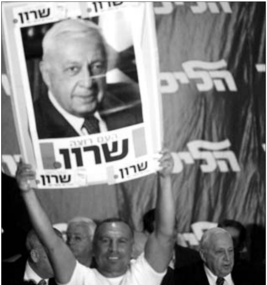
არიელ შარონი და მისი მხარდამჭერები.

წინასწარი სოციოლოგიური გამოკითხვების თანახმად, საარჩევნო კამპანიაში პრემიერ-მინისტრი არიელ შარონი და მისი პარტია - ლიკუდი ლიდერობენ. არიელ შარონის პარტია 120-ადგილიან პარლამენტში 32-33 ადგილის მოპოვებას წინასწარმეტყველებენ. წინასწარი ვარაუდით, შრომის პარტია 18-19 ადგილს აიღებს, ხოლო ცენტრისტული შინუსი (ცვლილება) პარტია, სავარაუდოდ, 15-16 საპარლამენტო მანდატს მოიპოვებს.