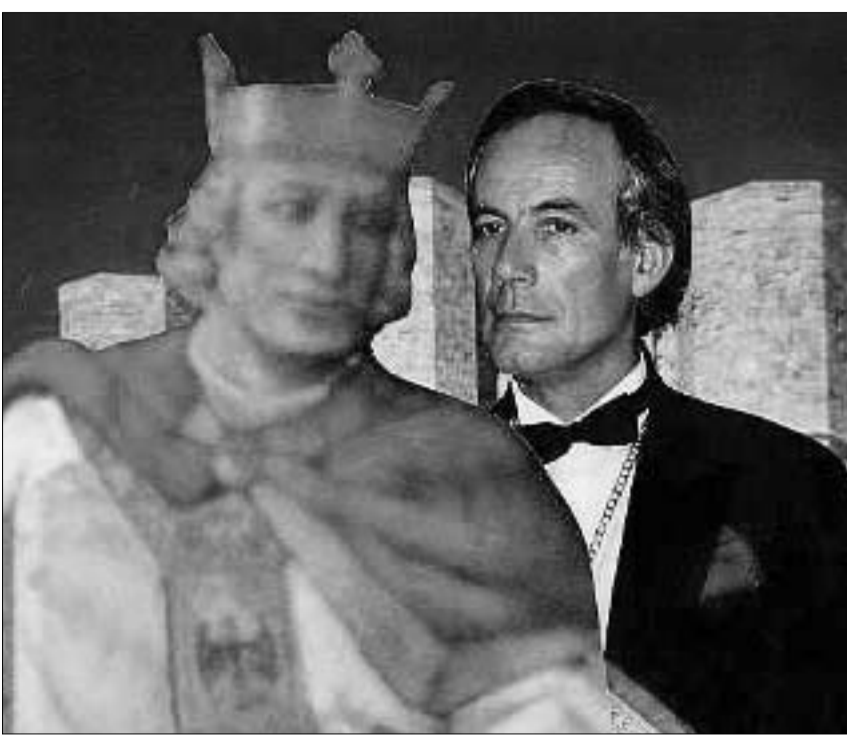
ჰორტუალური ფრიდრიხ II და მისი შთამომავალი, ყველაზე ტიტულოვანი ევროპელი

V ჯვაროსნული ლაშქრობის დროს 1228 წელს ფრიდრიხ II ჰოპენბრუნსის-შვაბიელმა იქორწინა ანტიოქიელი დინასტიის პრინცესაზე, საფრანგეთის მეფის ფილიპ I-ის ასულ კონსტანციასა და ანტიოქიელი პრინცის, ბოემუნდის ასულ მარია მატილდაზე. სწორედ ამ კავშირის შედეგად, 1229 წელს დაიბადა ფრიდრიხი, რომელმაც შემდგომში დადის სამკვიდროს მიხედვით სახელად ფრიდრიხ ანტიოქიელი მიიღო. იტალიაში მამასთან ერთად დაბრუნებულმა პრინცმა მარგარიტა პოლიელზე იქორწინა. ეს ქალბატონი