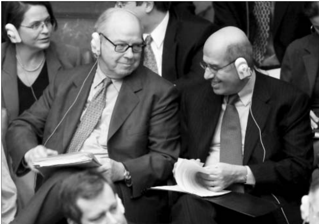
პანს ბლოკის და მოპამედ ელ-ბარადეი.

გუშინ გაერო-ს ინსპექტორებმა უშიშროების საბჭოს თავიანთი საქმიანობის ანგარიში წარუდგინეს. ორთვიანი მუშაობისა და 350 ობიექტის ინსპექტირების შემდეგ, ინსპექტორებს არ შეუძლიათ, დაერწმუნებინათ თქვან, აქვს თუ არა ერაყს აკრძალული იარაღი.