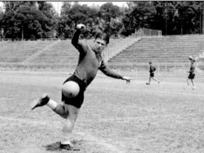
1963 წლის 15 ივნისი, ბაქოში. ბაქოში “რადნიკი” ანგარიში თანამდებობით ფარავს პრემიალი პარტიზანს.

ლონდონის “ლენდმარკ პოტელში” გამართული დაჯილდოების ცერემონიალი ფრანგების ტრიუმფად იქცა - ყველა პრესტიჟული ჯილდო ამ ქვეყნის წარმომადგენლებს ერგო.