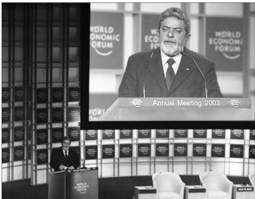
ბრაზილიის პრეზიდენტი ლუს იგნასიო ლულა და სილვა დავოსის ფორუმზე გამოსვლისას.

პოლიტიკა ეკონომიკის გარეშე რომ არ არსებობს და პირიქით, ყველაფერს კარგად ცნობილი შექმნილია და ამის დავოსში მიმდინარე მსოფლიო ეკონომიკური ფორუმი მთელი სიცხადით ადასტურებს. ფორუმის ყველა მონაწილისათვის ამ კრება: მსოფლიო ეკონომიკაში არსებული არასახარბილო ვითარების გამოსწორება ვერაფრით მოხერხდება, თუკი პოლიტიკის არ მოველევა. ყველაზე დიდ ყურადღებას კი, ცხადია, ერაყს უთმობენ. ფორუმზე მთავარი მოპასუხის როლი აშშ გამოდის, რომლის პოზიციაც ბაღდადთან დაკავშირებით მისი ბევრი ისტორიული მოკავშირისათვისაც კი მიუღებელია.