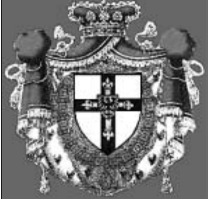
ტიტულარული ორდენის გერბი