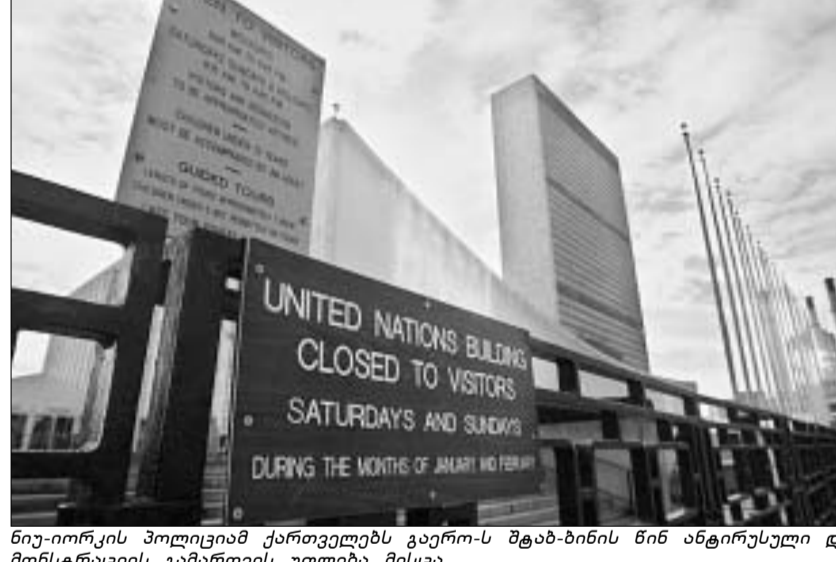
ნიუ-იორკის პოლიციამ ქართველებს გაერო-ს შტაბ-ბინის წინ ანტირუსული დემონსტრაციის გამართვის უფლება მისცა.