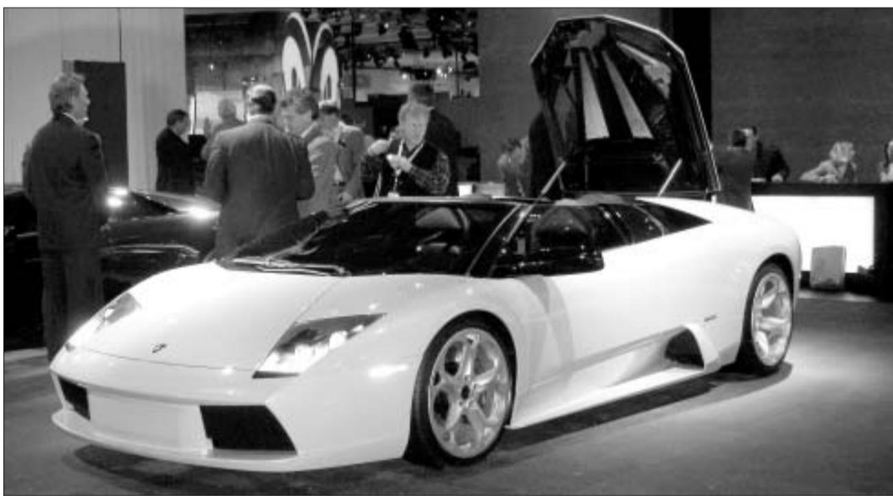
ავტომობილს დასრულებამდე ამ "ლამბორგინის" "ბარკეტა" უნოდეს

ლების მიხედვით ეცვლება. იტალიური კომპანია "პირელის" წარმოების საბურავები (პირელი სკორპიონ ძერო) კი უნივერსალურობით გამოირჩევა და გზის საფართან საუკეთესო ჩაჭიდებას სრულიად განსხვავებულ პირობებში უზრუნველყოფს.