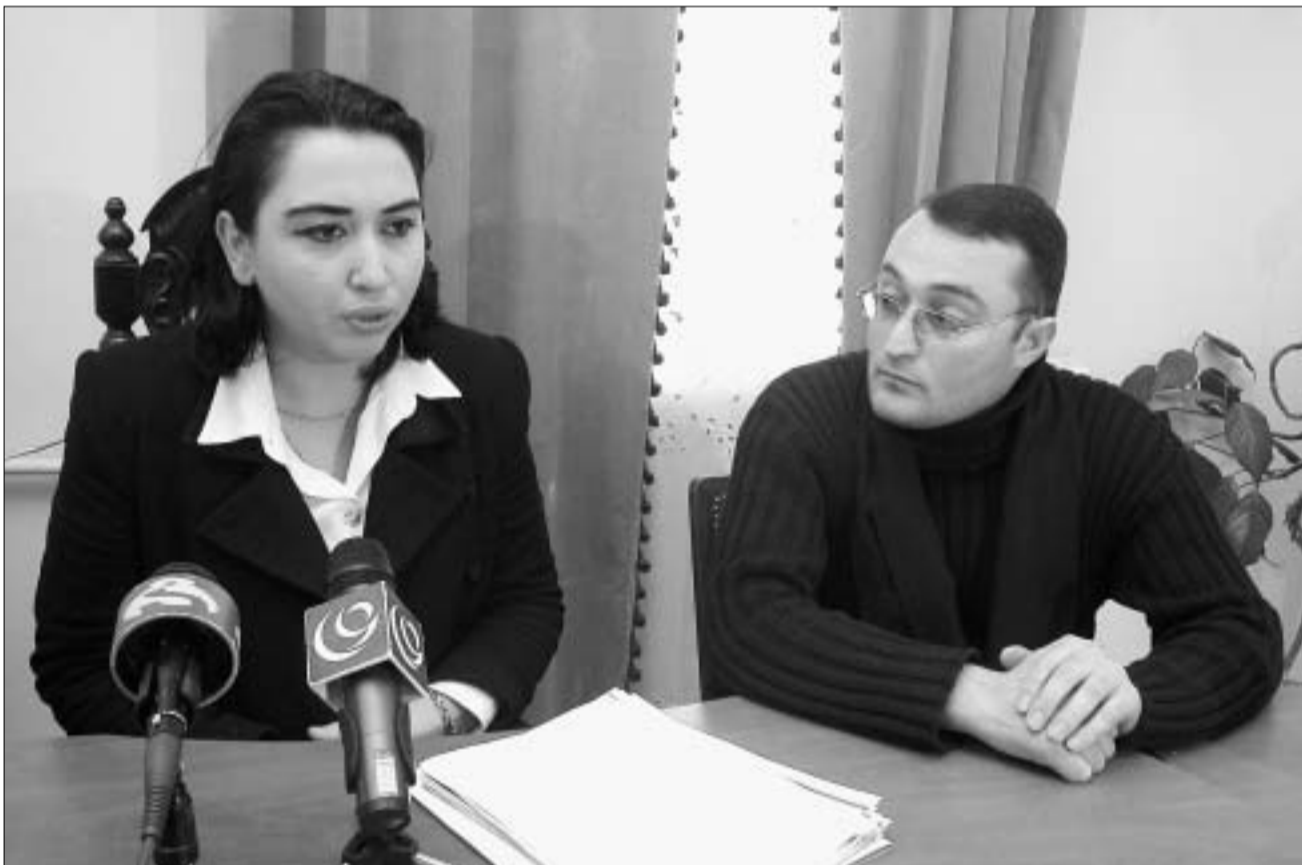
ადვოკატებს მიაჩნიათ, რომ პოლიციამ მეტი მტკიცებულება უნდა შეაგროვოს.