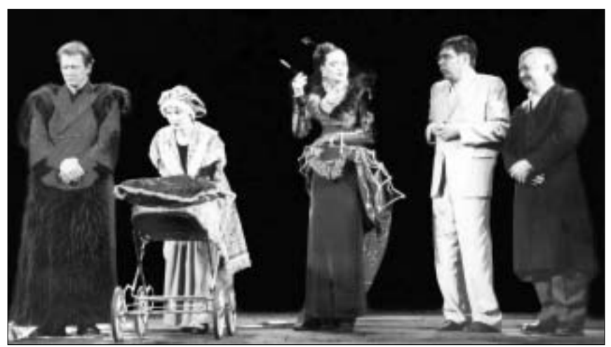
„აკაკისური ცარკის წრე“ ომსკში

როგორ მოხვდა ქართული პიესა ციმბირის თეატრში