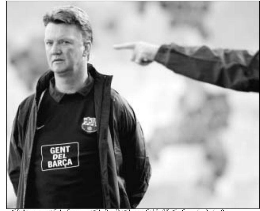
ორშაბათი: უკანასკნელი ვარჯიში “ბარსელონას” მწვრთნელის პოსტზე