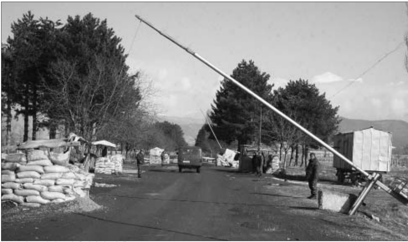
ბლოკ ბლოკ-პოსტი პანკისის ხეობაში.

პანკისის ხეობაში ჩატარებული ანტიკრიმინალური ოპერაციის ხელმძღვანელმა პანკისის სოფლებში – დუისში, ჯოჯოხეთში და ბირკინაში გახსნილი შინაგანი ჯარის და პოლიციის ქვედანაყოფების ბლოკ-საგუშაგოები მოინახულა და შემოვლია ხეობის ბოლოს გამაგრებული ხადორის საგუშაგოს ინსპექტირებით დასრულდა. კობა ნარჩენმაშვილმა დათვალა ხეობაში მშენებარე სტრატეგიული ობიექტი “ხადორის”, რომელსაც ჩიხნეთი კორპორაცია “სიჩუანი” ამუშავებს და რომლის უსაფრთხოებასაც შინაგანი ჯარის ქისტურ-ქართული ჯგუფი იცავს. ხადორის საგუშაგო პანკისის ხეობის ბოლო პუნქტია, აქ მთავრდება ხეობა და სულ რაღაც 50 მეტრზე უკვე ჩიხნეთის საზღვარია. “ადრე სავსე იყო აქაურობა, რამდენიმე თვეა, შეიარაღებული