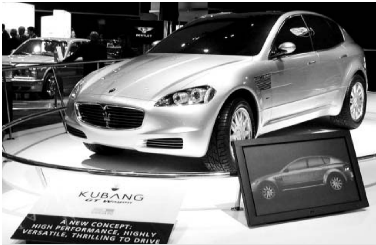
"მაზერატი" ფეხი გამოყოფს და "კუბანგი" გამოაცხობს