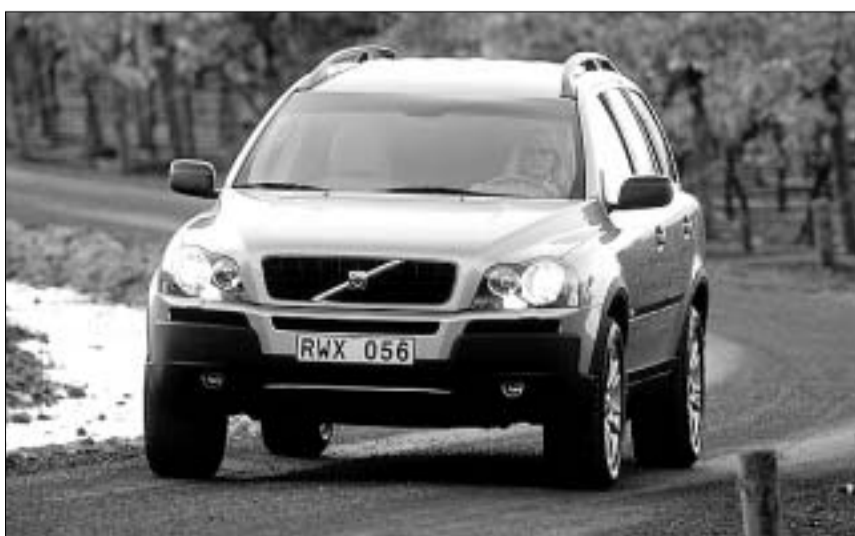
ლაურეატთა ლაურეატი "ვოლვო XC90"