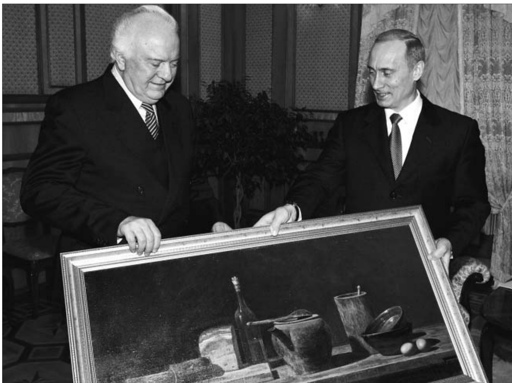
პრეზიდენტის შეხვედრა შევარდნაძისთვის იუბილეს მილოცვით დაინყო.