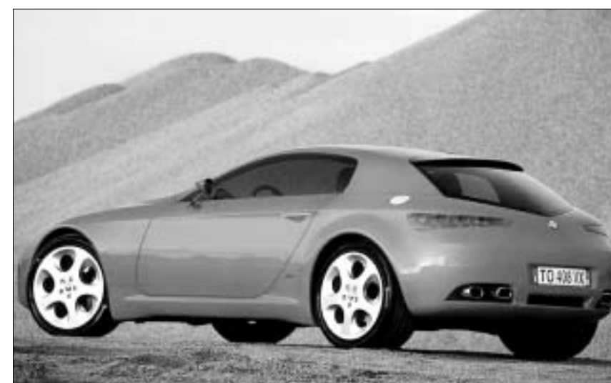
ალფა რომეო ბრერა