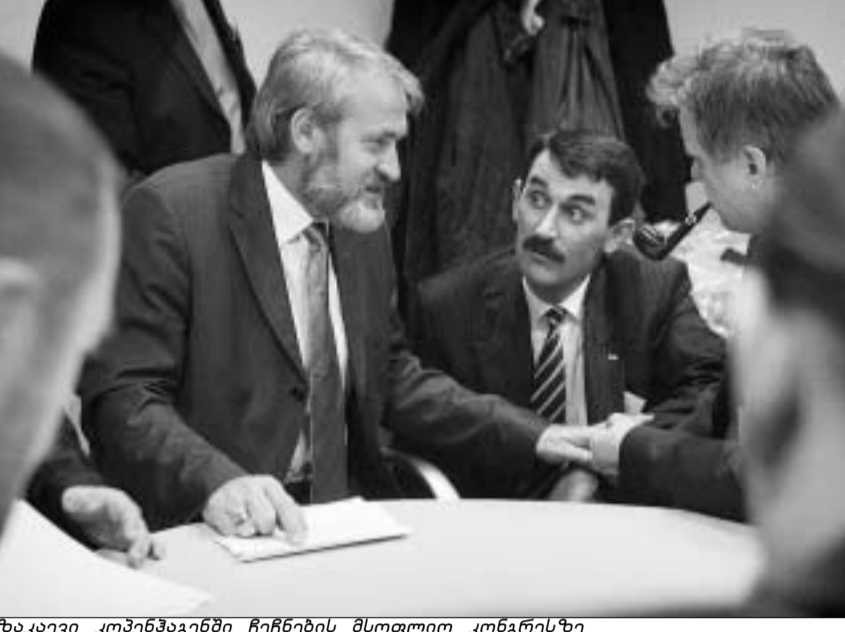
ზაკაევი კონვენანტში ჩვენების მსოფლიო კონგრესზე

პირველი გვირგვინი - ამერიკის სახელმწიფო დეპარტამენტმა კიდევ ერთხელ განახალა საერთაშორისო ტერორისტული ორგანიზაციების ზეი სია და, მისკოვის ზენოლის მიუხედავად, მასში ჩვენური ჯგუფები არ აღმონდნენ. რამდენად მოუღონდელი იყო თქვენთვის გამწვანონის ეს გადაწყვეტილება? - ეს იმდენად ჩვენების გამარჯვება არ არის, რამდენადც რუსეთის კიდევ ერთი მარცხი. მოსკოვი დიდი ხანია ყველა მეთოდით ცდილობს, ზენოლის მოახდინოს საერთაშორისო თანამეგობრობაზე და თვითგამორკვევისთვის ჩვენი ბრძოლა ტერორისტულ მოძრაობად გამოაცხადოს. 2001 წლის 11 სექტემბრის ცნობილი მოვლენების შემდეგ, რუსეთი სწორედ ამ მიზნით მიუერთდა საერთაშორისო ანტიტერორისტულ კოალიციას. მაშინ პუტინმა პირდაპირ განაცხადა, რომ რუსეთი მიიღებს მონაწილეობას ანტიტერორისტულ კოალიციას. მაშინ პუტინმა პირდაპირ განაცხადა, რომ რუსეთი მიიღებს მონაწილეობას ანტიტერორისტულ კოალიციას. მაშინ პუტინმა პირდაპირ განაცხადა, რომ რუსეთი მიიღებს მონაწილეობას ანტიტერორისტულ კოალიციას. მაშინ პუტინმა პირდაპირ განაცხადა, რომ რუსეთი მიიღებს მონაწილეობას ანტიტერორისტულ კოალიციას. მაშინ პუტინმა პირდაპირ განაცხადა, რომ რუსეთი მიიღებს მონაწილეობას ანტიტერორისტულ კოალიციას.