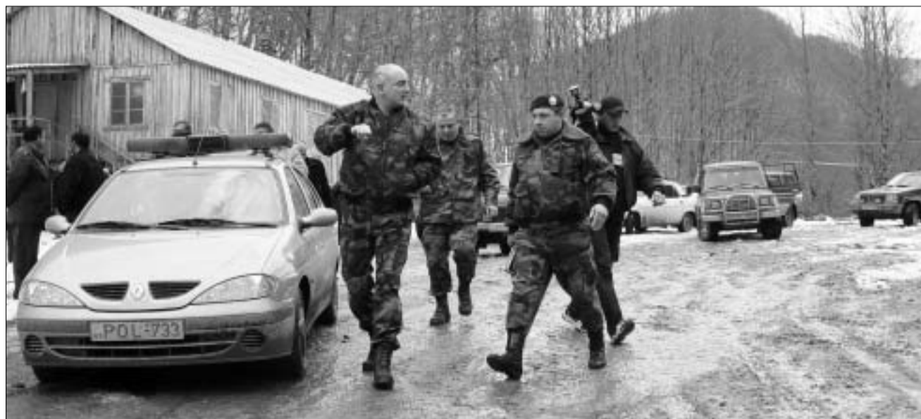
გენერალი შერვაშიძე შინაგანი ჭარის ოპერატიულ მითითებებს აძლევს.