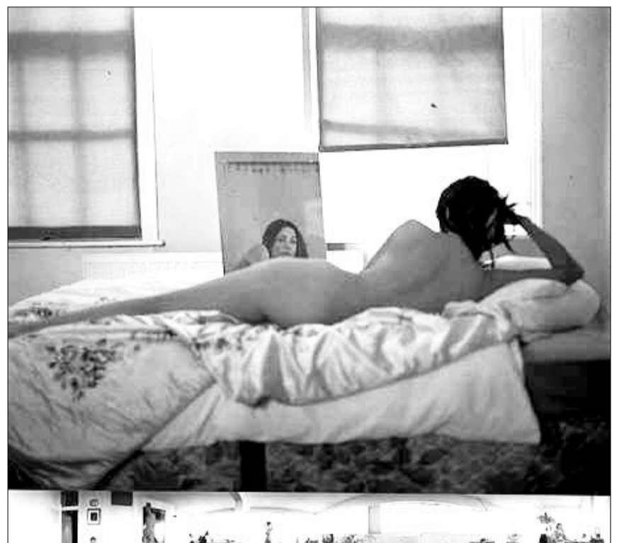
მონოლოგი III სემ ტვილორ-ვედი

პოპ-მუსიკის ისეთი ვარსკვლავები, როგორებიც მაქსიმ, დევიდ ბოვი, ელტონ ჯონი, ბრაიან ინო, ჯარვის კოკერი და ბრაიან ფერი არიან, თანამედროვე ხელოვნების მფარველებად გვევლინებიან. როგორც კრისტინ აუქციონის თანამედროვე განყოფილების ხელმძღვანელი ფერნანდო მინიონი ამბობს, მომღერლების ამ ჯგუფმა ნამდვილად დიდი წვლილი შეიტანა თანამედროვე ხელოვნების განვითარებაში. ისინი ბიძკაც კი აძლევენ გარკვეული მიმდინარეობების განვითარებას.