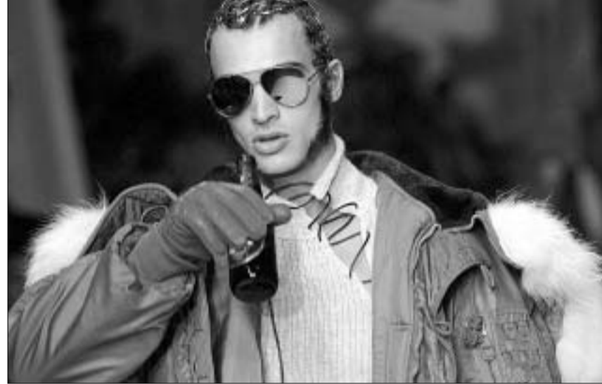
ჯონ პოლ გოტის მოდელი

ბიკროფტთან ერთად ერთ ორიგინალურ იდეას შეასხა ხორცი - ტრისიმ ინსტალაციისთვის, რომელშიც მხოლოდ მიმგული მოდელები მონაწილეობდნენ, შავი ტყავის ნიღბები შეკერა.