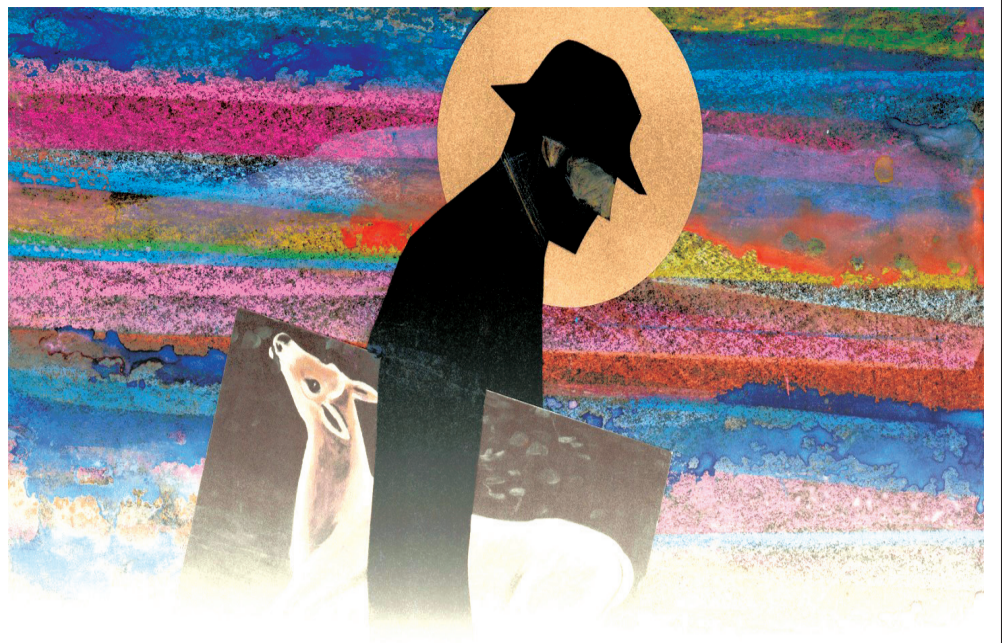
ინფორმაცია მხატვრის შესახებ: 1978 წელს ტაკეჰიდე ჰარადა ჩართული იყო გიორგი შენგელაიას ფილმის „ფიროსმანის“ იაპონურ პრემიერაში. 24 წლის ასაკში იგი ისე მოიხიბლა ამ ფილმით და იმდენად დაინტერესდა მხატვრის ცხოვრებით და შემოქმედებით, რომ მას შემდეგ ფიროსმანი არასოდეს გამქრალა მისი ხსოვნიდან, მისი გულიდან და მისი შემოქმედებიდან.

პირველი გამოფენა 25 იანვარს თბილისში ნიკო ფიროსმანის სახელმწიფო მუზეუმში გაიხსნა, სადაც წარმოდგენილი იყო ფიროსმანის იაპონელი მკვლევარის ჰარადა ტაკეჰიდეს ნამუშევრების ასლები. წარმატებული ბენეფისის შემდეგ გადაწყდა გამოფენის „მოგზაურობა“ რეგიონებში მთელი წლის განმავლობაში, რათა უფრო მეტმა ხალხმა შეიგრძნოს იაპონელი მხატვრის მიერ დანახული ფიროსმანი.