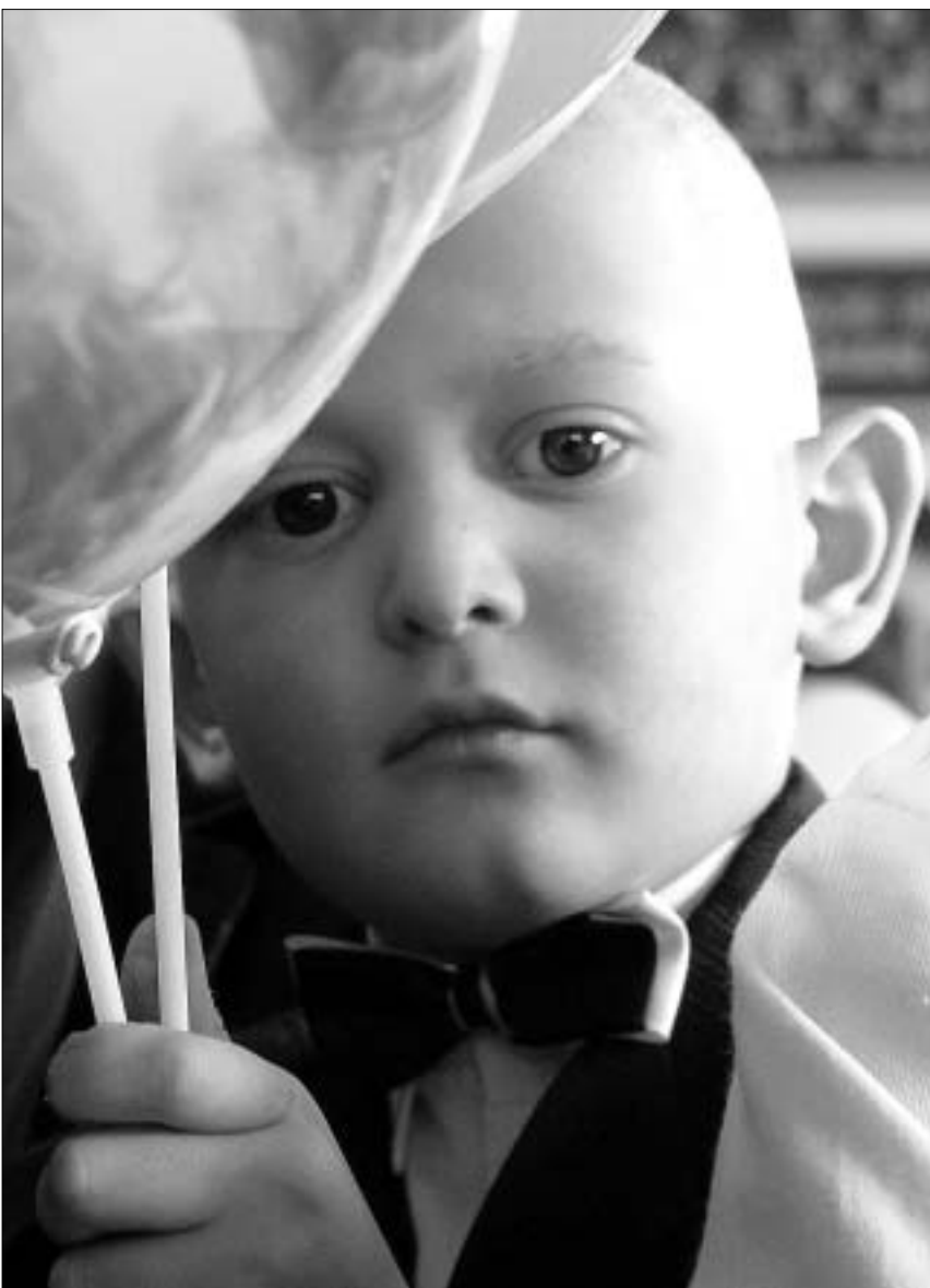
ჩვენს კანშირთლები ვიქნებით.

თამბაქოს საწინააღმდეგო ცენტრის იდეა მერიაშიც მოერწინათ. მხარდაჭერაც აღუთქვამთ. ამიტომ ცენტრი იმედოვნებს, რომ ჯანმრთელობის ხელშეწყობის კაბინეტების გასასხენლად ადგილის გამოძენა არ გაუჭირდება.