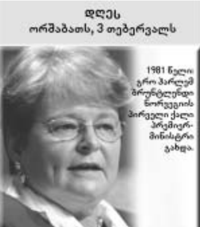
დღეს ორშაბათს, 3 თებერვალს

"როქსეტი", სამეფო ბალის მეხალე და მოსამართლე - ეს ადამიანები დანარჩენ 28 ნომინანტთან ერთად შედეგისთვის მეფემ კარლ XVI სამეფო პრიზით დააჯილდოვა. მიუხედავად უცნაურად დაკომპლექტებული სისხა, ბუნებრივია სამეფო ჯილდოს მოპოვება შედეგური დუეტის წევრებისთვის დიდი პატივია. მათ სიგელი "შედეგთა და საზღვარგარეთ მიღწეული წარმატებებისთვის" გადასცეს. "როქსეტთან" ერთად მეფე კარლმა ჯილდო გადასცა საკუთარ დასაც, პრინცესა კრისტინას, როგორც შედეგური "ნი-თელი ჯგრის" გამორჩეულად კარგ თავმჯდომარეს.