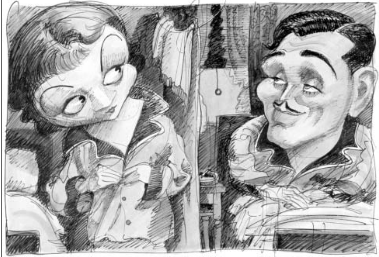
კლოდეტ კოლბერი და კლარკ გიბილი