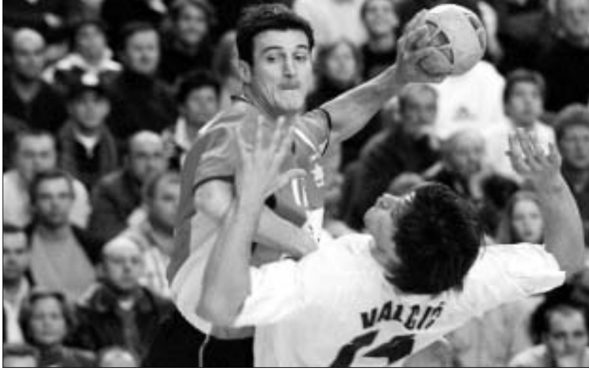
ესპანელი მირიანო ორტეგასა და ხორვატი ტონი ვილჩის პაექრობა

ნახევარფინალამდე არც ესპანელებს ჰქონდათ მარცხის სიმწარე განცდილი და უფრო თავდაჯერებულად იცვლიდნენ. ბევრს რისკავდნენ და თავიდან უპირატესობასაც ფლობდნენ, მაგრამ უაღრესად გამოცდილი ხორვატიის ნაკრები სიტუაციას მშვიდად აკონტროლებდა და თამაშის გამოსწორება შეძლო. გამარჯვებულის გამოსავლენად დამატებითი დრო გახდა საჭირო. აქ კი