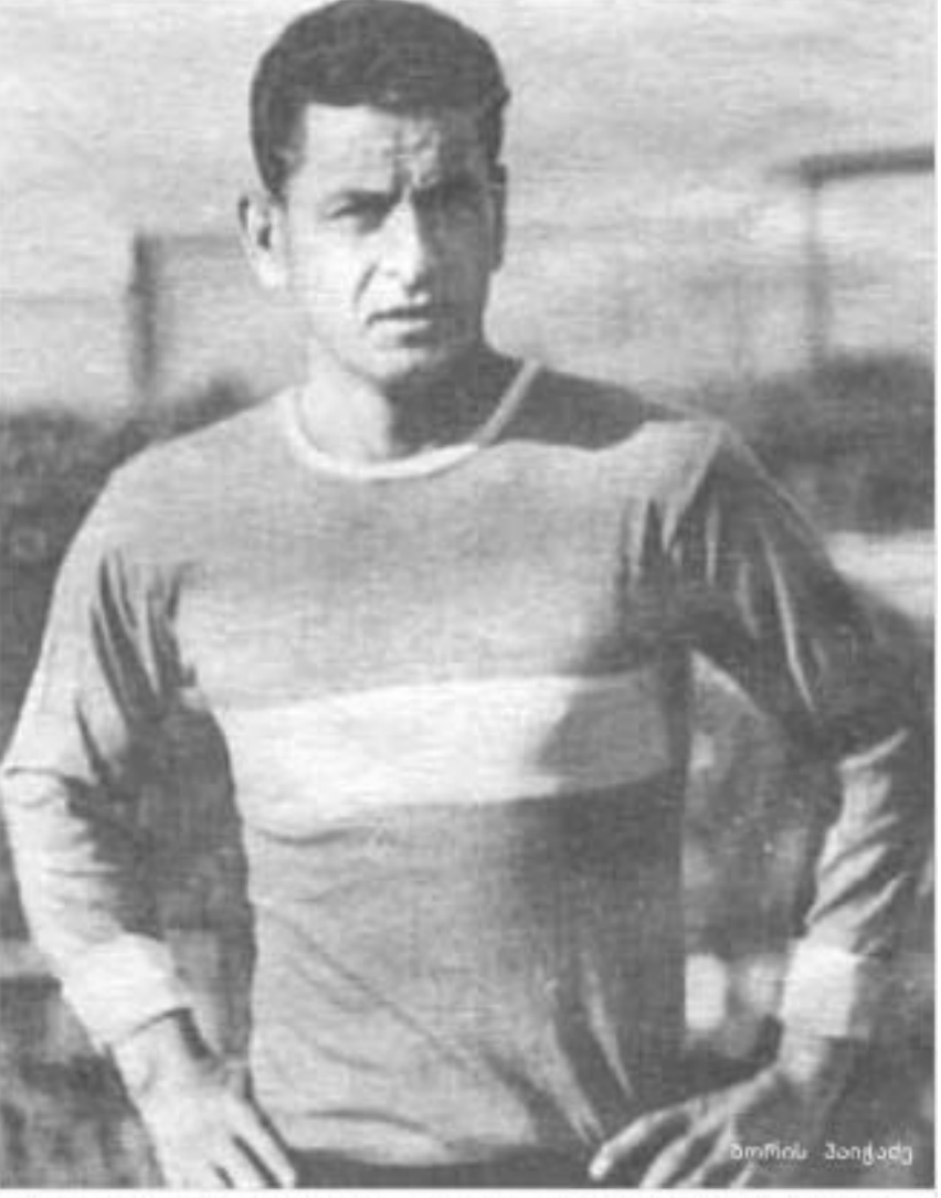
1915 - დაიბადა ბორის პოქოპი. ლეგენდარული ქართველი ფეხბურთელი. "ფეხბურთის კარგად" ნოვებელი. მე-20 საუკუნის საქართველოს საუკეთესო ფეხბურთელი. საქართველოს რაგბის კავშირის პირველი პრეზიდენტი.