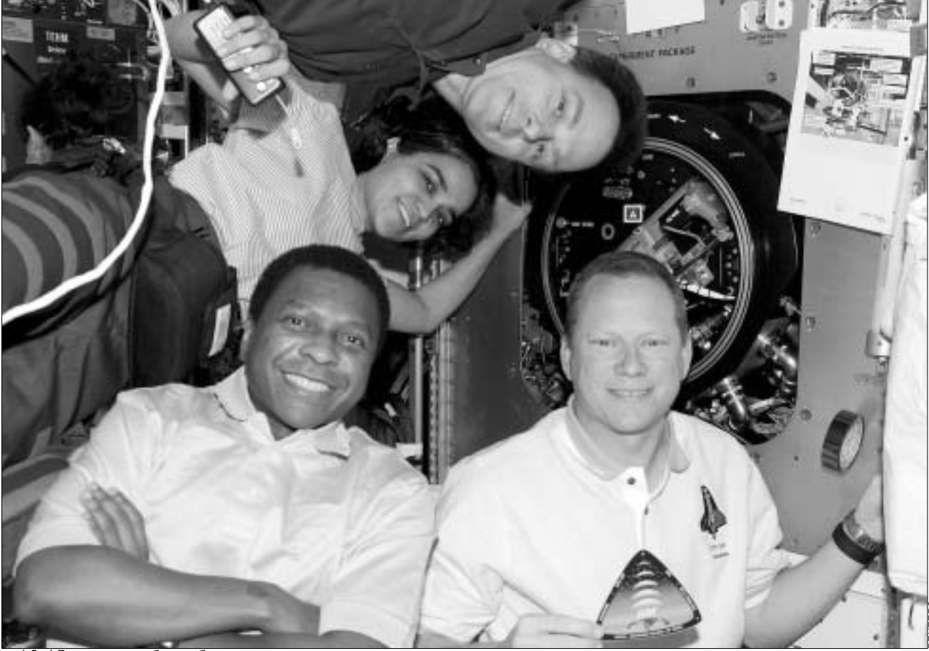
კოსმოსში ყველაფერი კარგად იყო...

აღსანიშნავია, რომ გაფრენამდე რამდენიმე დღით ადრე მაკონტროლებელმა წყლის გამანაწილებელ სისტემაში ელექტროგაყვანილობის დაზიანება შეინიშნა. მოგვიანებით მათ სისტემის მთლიანი დაკეტვა მოუხდათ, რადგან წყალმა გაჟონა. მაგ-