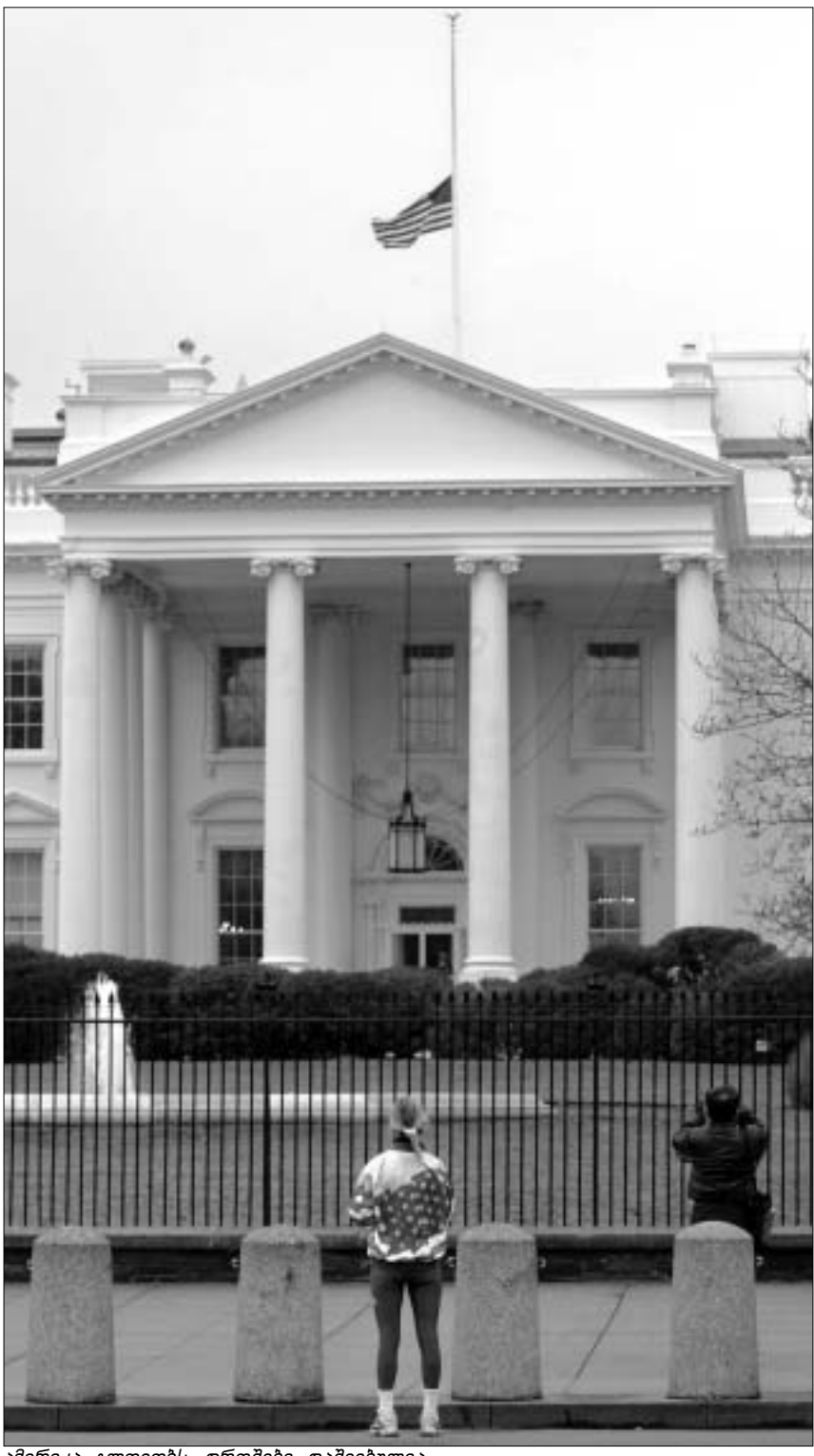
ამერიკა გლომოს დროშები დაშვებულა.

შაბათს ამერიკული კოსმოსური ხომალდი "კოლუმბია" მინაზე დაშვებისას ტეხასის თავზე აფეთქდა და 7 ასტრონავტის სიცოცხლე შეინარა. პრეზიდენტმა ბუშმა მომხდარს "მთელი ერის ტრაგედია" უწოდა.