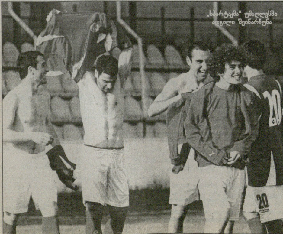
„სპარტაკი“ უმაღლესში იდგილი შეინარჩუნა

„ზესტაფონი“ იყო, საქართველოს თასი მიჯრით სამჯერ რომ წააგო და მეოთხე ცდაზედა იზეიმა გამარჯვება.