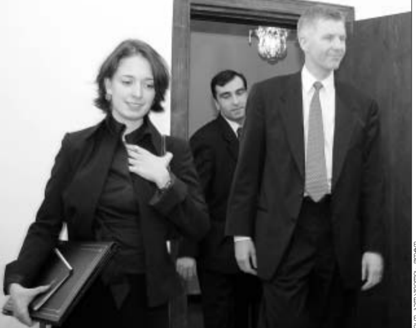
სტეფან რედმეიკერი მოლაპარაკებებით კმაყოფილია.

რეობა მართლაც საინტერესოა აშშ-სთვის და სწორედ ამიტომ, რომ ვაშინგტონი საქართველოს პრობლემებით, მისი ტერიტორიული მთლიანობისა და სხვა საკითხებით განსაკუთრებულ დაინტერესებას გამოხატავს. ამ ინტერესის დადასტურება გახლავთ გუშინ სტეფან რედმეიკერის მიერ გავრცელებული ინფორმაცია იმის თაობაზე, რომ „აშშ სრულ მხარდაჭერას გაუწევს საქართველოს რუსეთთან მოლაპარაკებებისა და ქვეყნიდან რუსული სამხედრო ბაზების გაყვანის თაობაზე, რასაც 1999 წლის სტამბოლის უთო-ს სამიტის გადაწყვეტილებები ითვალისწინებს.“