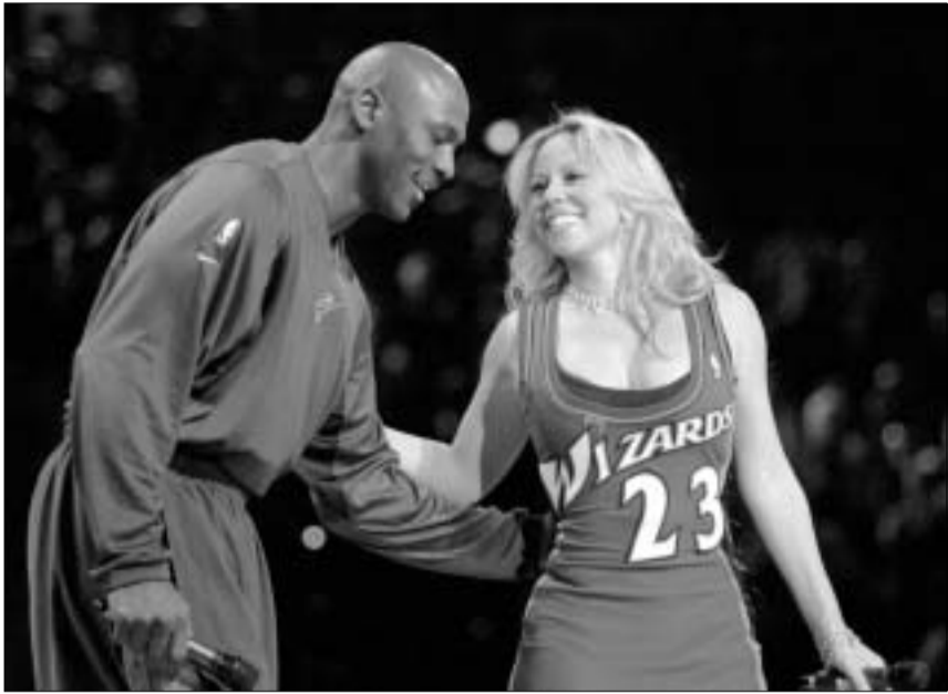
მაიკლ ჯორდანი და მერაია ჯერი