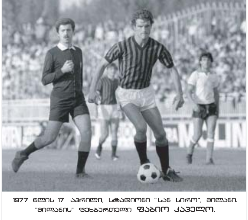
1977 წლის 17 აპრილი. სტადიონი "სან სირო". მილანი. "მილანის" ფეხბურთელი ფაბიო კაპელი.