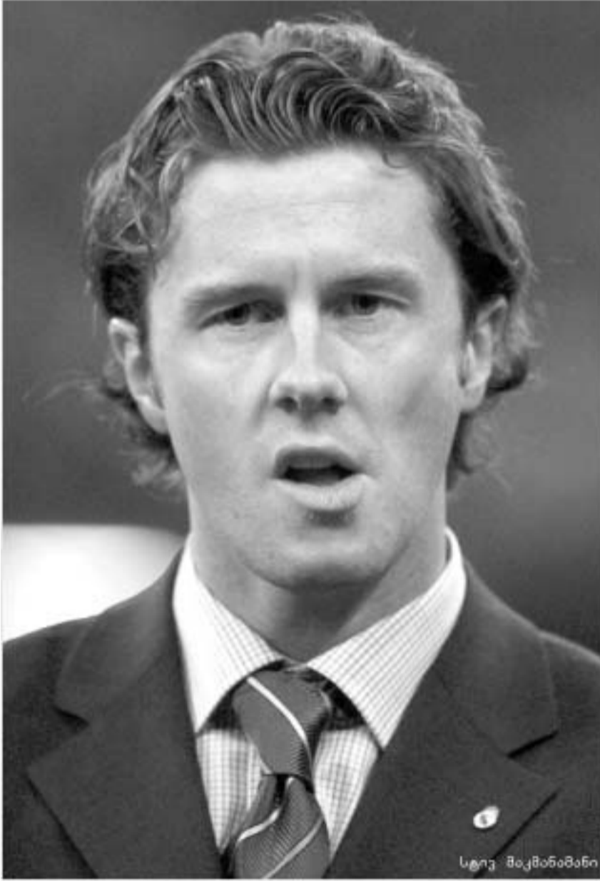
1929 - დაიბადა ალბერტ აზარინი. ტანმოვარუზე სამების ოლიმპიური ჩემპიონი. 1938 - დაიბადა პირს მაიორი...