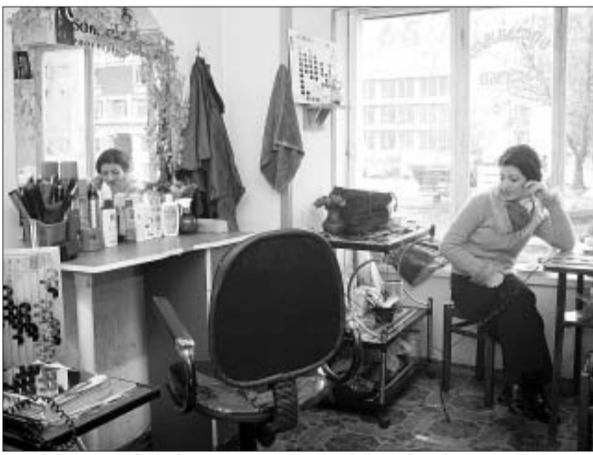
სიღამაზის სალონებს მაღალი გადასახადები მუშაობაში უშლით ხელს.