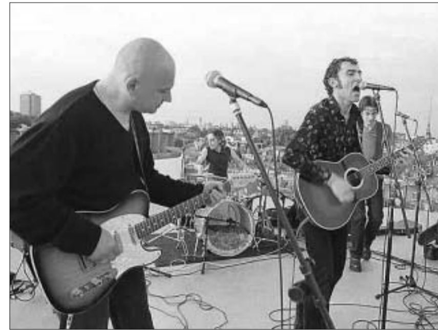
კონცერტი ლონდონში. სახურავზე

ფლორენციის ხელოვნების ლაბორატორია ითხოვს, რომ ლეონარდოს მემკვიდრეობის ექსპერტიზის ჩასატარებლად ნამუშევრები იქ ჩაიტანონ. პროფესორი მარტინ კემპი კი ამბობს, რომ, ქმნილებების ზედმეტი