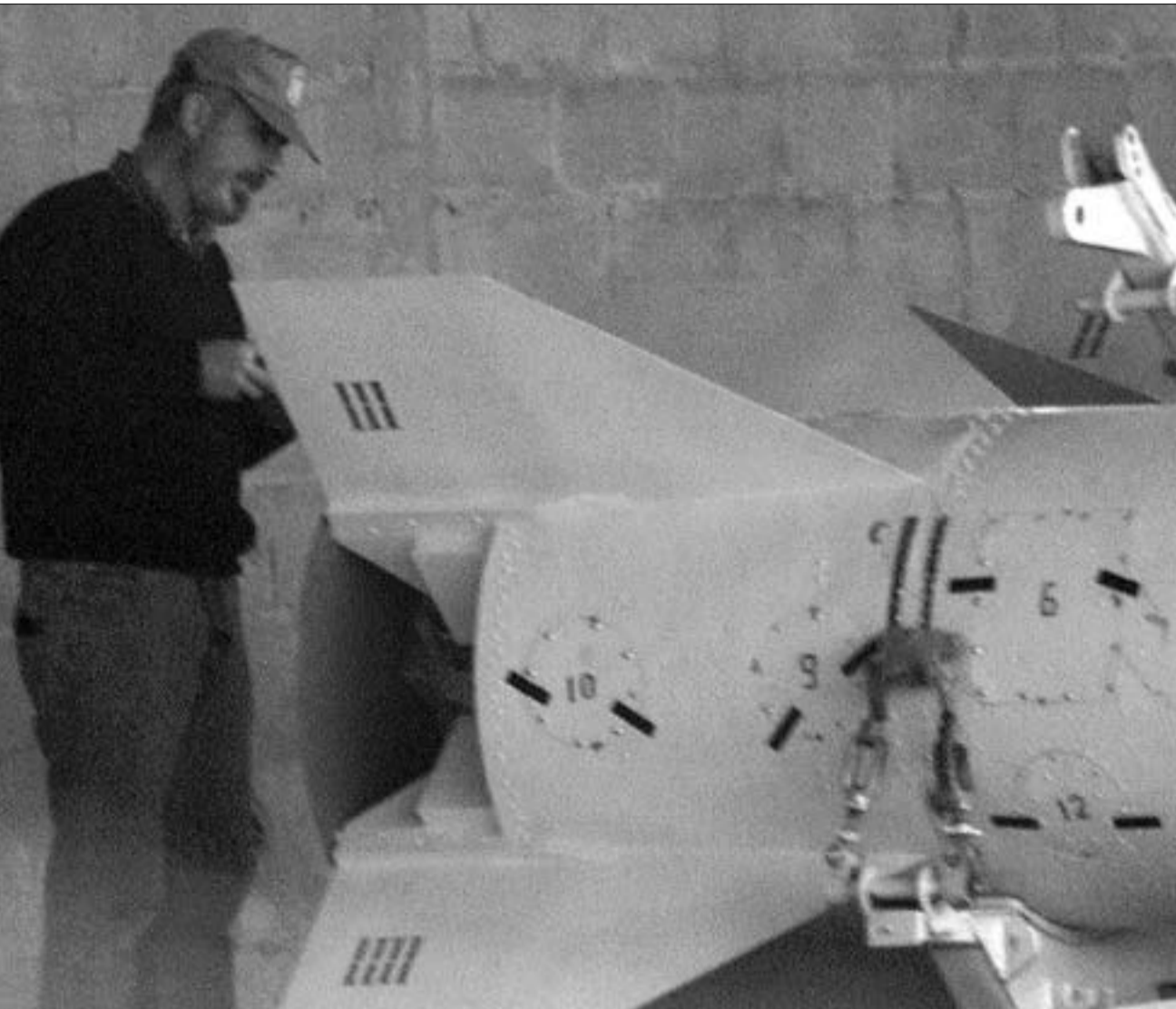
გაეროს ინსპექტორები ირანში

22 თებერვალს ატომური ენერჯის საერთაშორისო სააგენტოს თავმჯდომარე მოჰამად ელ ბარადეი და გაერო-ს ინსპექტორთა ჯგუფი სპეციალურად ჩავიდნენ ირანში, რათა თეირანის ბირთვული პროგრამები შეამოწმონ, - იუწყება ირანის სახელმწიფო საინფორმაციო სააგენტო "ირნა". გაერო-ს ინსპექტორების ჩასვლა ამერიკის შეშფოთებაში გამოიწვია, რომელიც ირანის განცხადებას მოჰყვა. განცხადების თანახმად, თეირანი საკუთარი ბირთვული საქმიანობის გაფართოებას აპირებს. ელ ბარადეიმ და გაერო-ს ინსპექტორებმა ორი მშენებარე სადგური მოინახულეს ნათანაცისა და არაკის მახლობლად, ადგილები, რომლებიც, ვაშინგტონის მტკიცებით, ბირთვული იარაღისათვის საჭირო ურანის საწარმოებლად შეიძლება იქნას გამოყენებული.