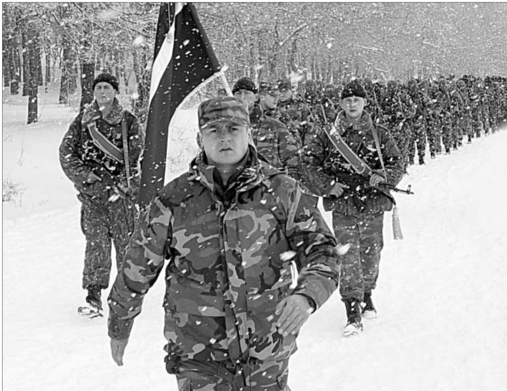
სწრაფი რეაგირების ძალების სპეცდანიშნულების ბრიგადის საბრძოლო დროში გადაეცა