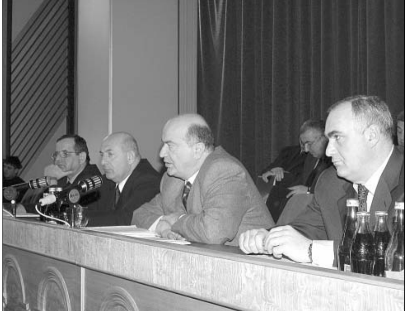
გენერალური პროკურატურის კოლეგიის სხდომაზე.

პროკურატურას, საკუთარი მონაცემებით, უკეთესი მდგომარეობა აქვს ალურიცხავ დანაშაულთა თვალსაზრისითაც - მათზე მხოლოდ სამი ასეთი დანაშაული მოიძიეს, როცა შს სამინისტროს სტრუქტურების შემოწმებისას მხოლოდ თბილისში პროკურატურამ 150 ალურიცხავი დანაშაული გამოავლინა. მოკლედ, გუშინდელ კოლეგიის სხდომაზე გენერალურმა პროკურატურამ შინაგან საქმეთა სამინისტროსთან შედარებით აშკარა უპროტესტობის დამტკიცება სცადა. თუმცა, გენერალური პროკურორი საქართველოში მიმდინარე დანაშაულთა რიცხვის ზრდაში თავის წილ პასუხისმგებლობასაც არ უარყოფს და ერთი კვირის მანძილზე სიტუაციის რადიკალურად გამოუსწორებლობის შემთხვევაში მკაცრი საკადრო ცვლილებებით იმეჯრება.