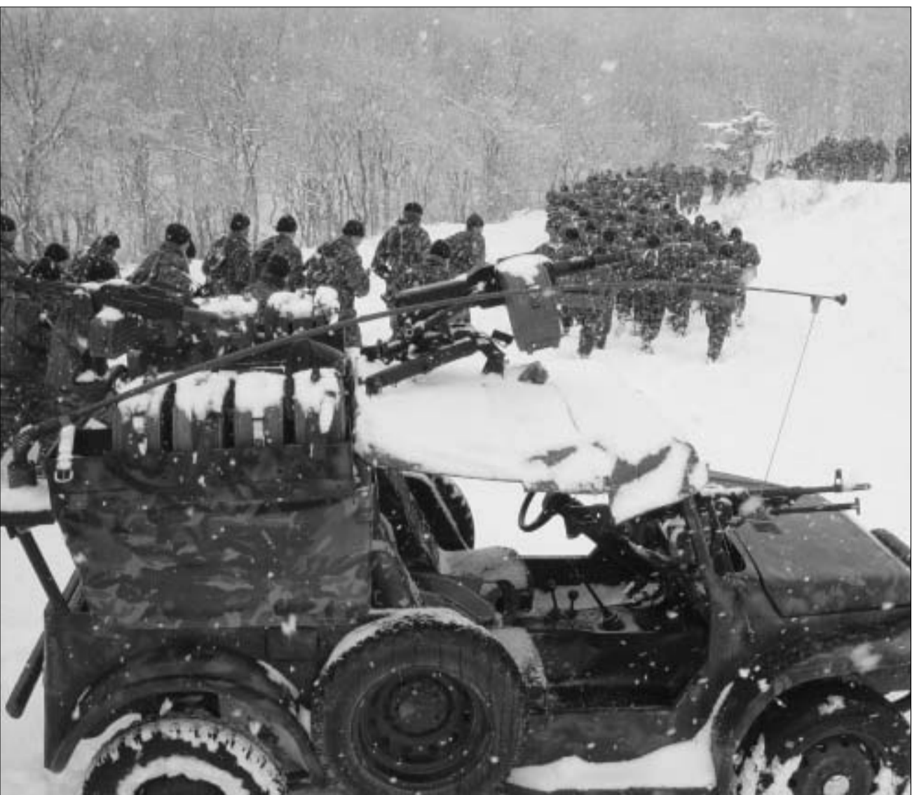
სწრაფი რეაგირების ძალების სპეცდანიშნულების ბრიგადა.

ცერემონიალით კმაყოფილმა მინისტრმა მოკლე კომენტარზე უარი არ თქვა და განაცხადა: "ამ ბრიგადის მთავარი ფუნქცია სხვადასხვა სახის სპეციალური დავალებების შესრულება, თანაც - რაც შეიძლება უხმაუროდ. დღევანდელ დღეს აქვს მნიშვნელოვანი ფსიქოლოგიური დატვირთვა. ამ ბრიგადიდან გარკვეული კონტინგენტი გადაიგზავნება იქ, სადაც პატრონი პრეზიდენტი იტყვის".