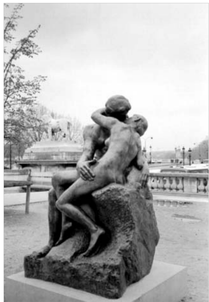
ოგიუსტ როდენი 'გაზაფხული'

უნივერსიტეტის მესვეურები ხაზგასმით აღნიშნავენ, რომ მიზნობრივი ჯგუფის – სოციოლოგიის, ფსიქოლოგიისა და მედიცინის შემსწავლელთა გარდა, ისინი სემინარში მონაწილეობისათვის ყველას ინვევენ, ვისაც ადამიანთა გრძობებში გარკვევა სურს.