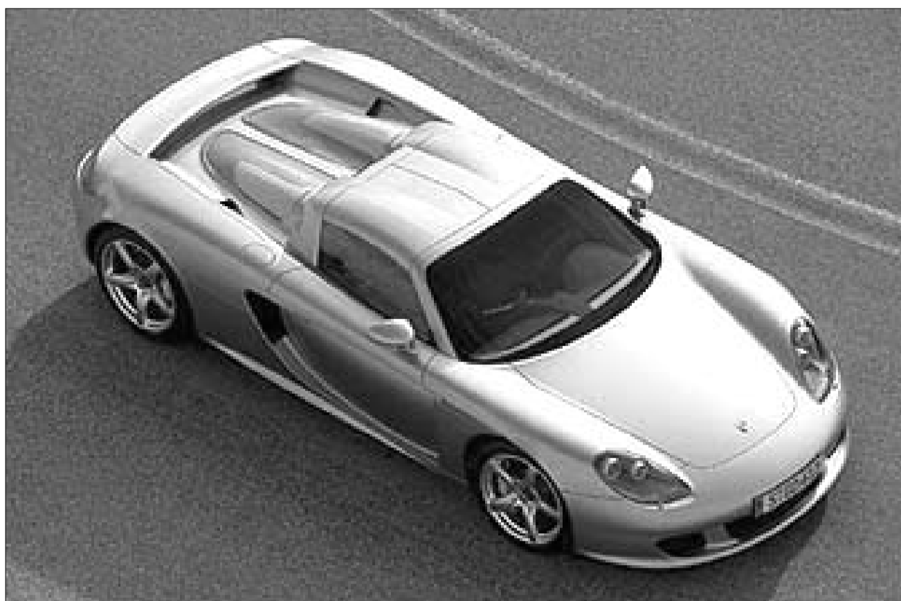
ასეთი ფერარი ენცოს კონკურენტი მტუტგარტიდან - პორშე კარერა GT

ესოდენ დიდი სიმძლავრისა და შესაბამისი (700-მდე ნ/მ) მაზრუნე მომენტის რეალიზაციისთვის „პორშეს“ კონსტრუქტორებმა გადაამუშავეს სპორტული კომპო-