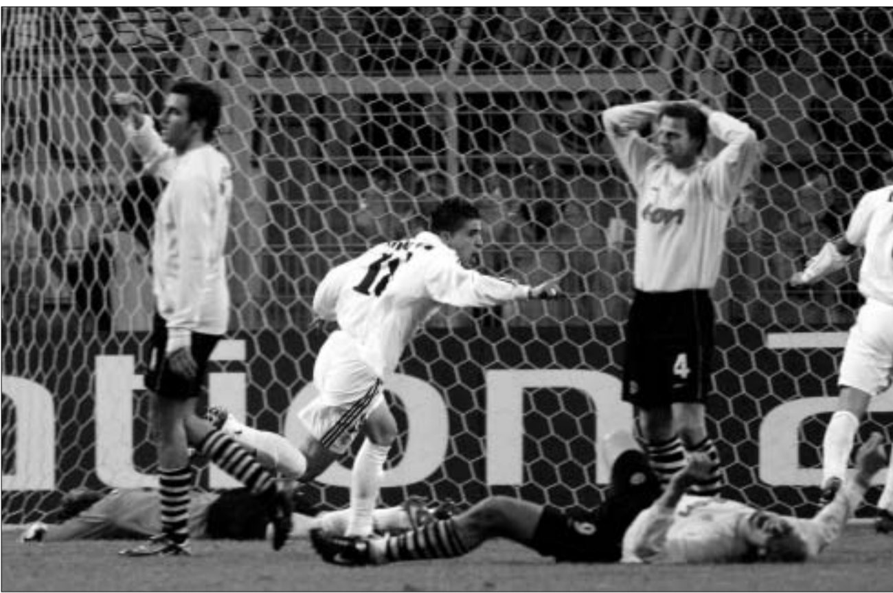
შორტილიოს ამ გოლმა "რეალი" გადაარჩინა