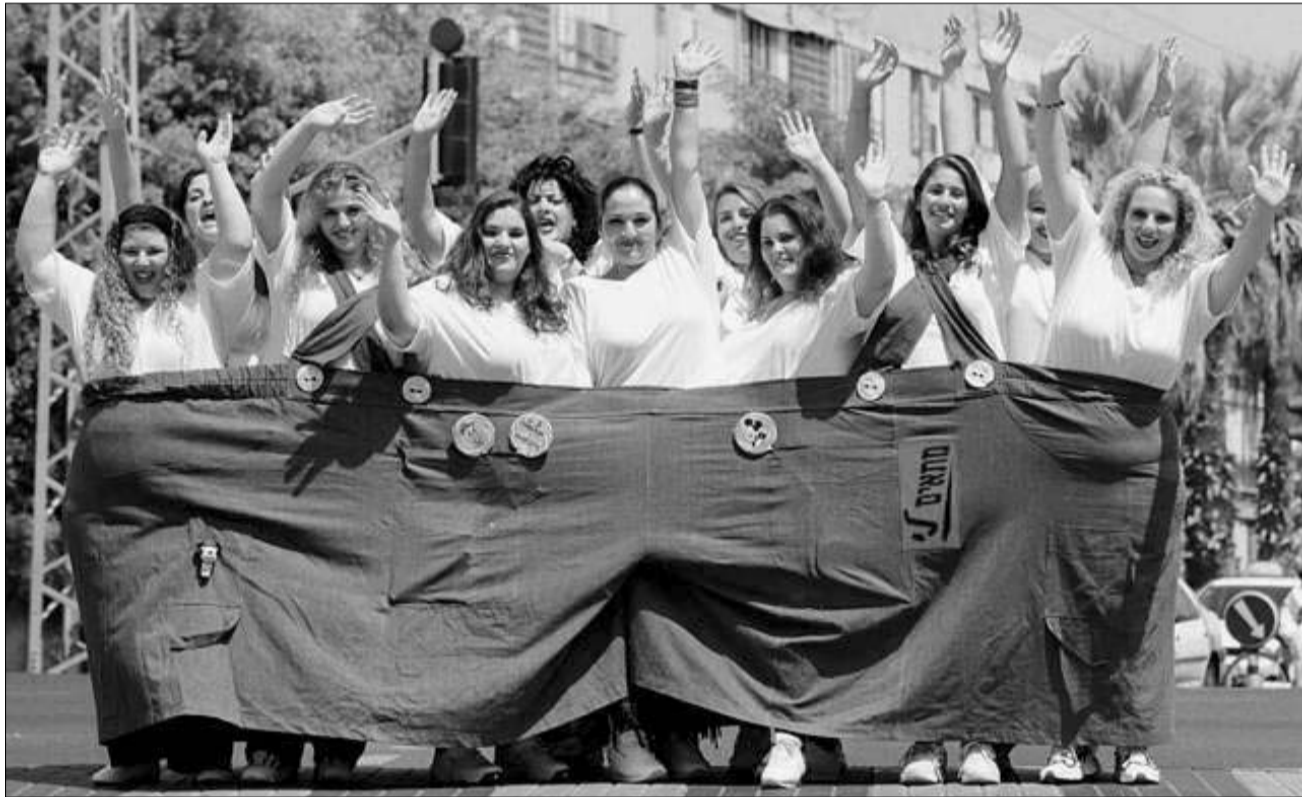
ჭინის რეკორდი: ყველაზე დიდი ჭინსი