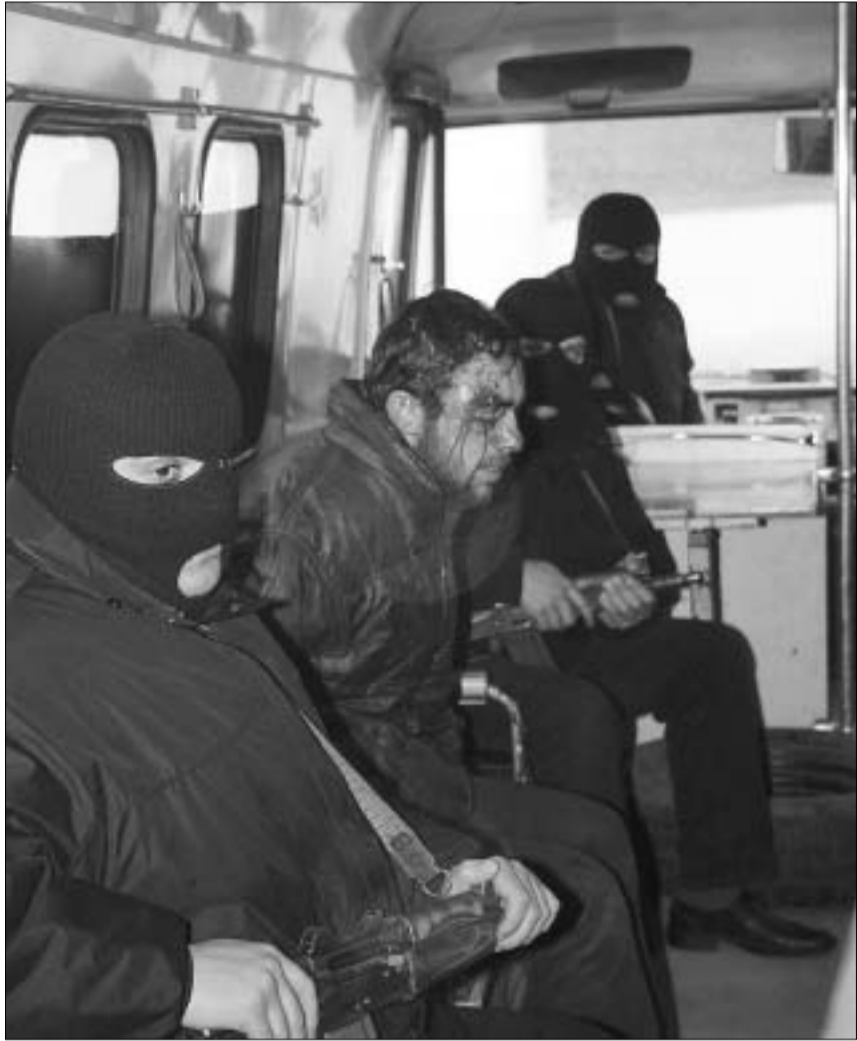
აბრამოვიჩის ბინაში დაკავებული ექვმიტანლები.