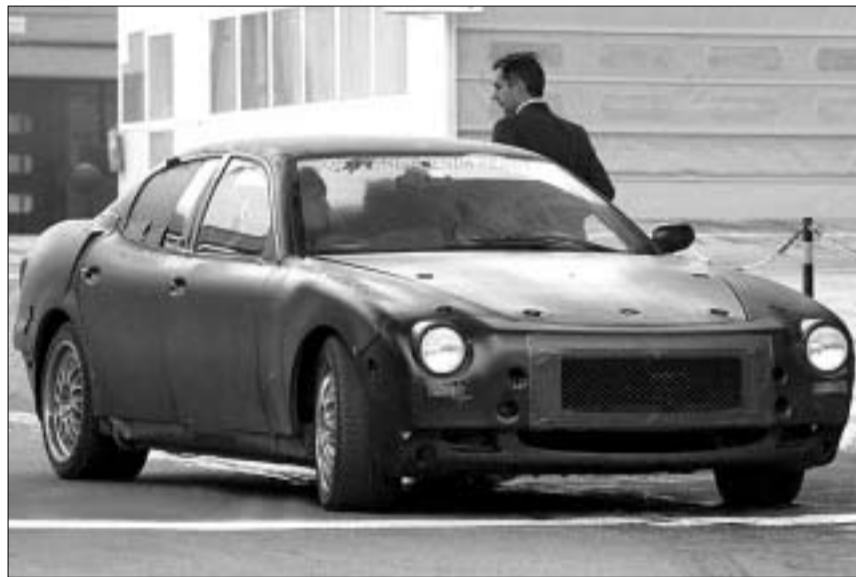
შენიღებული კვატრო პორტე სრული ტუმბით გადის საგზაო გამოცდებს

„მაზერატი 6000GT“-ს გასაღების მთავარი ბაზარი ისევ და ისევ ჩრდილოეთ ამერიკა იქნება. კომპანია კი ამ მოდელს წლიურად მხოლოდ 400-500 ცალის ოდენობით ამომუშავებს და თითოეულის ღირებულება 150 ათასი დოლარზე მეტი იქნება.