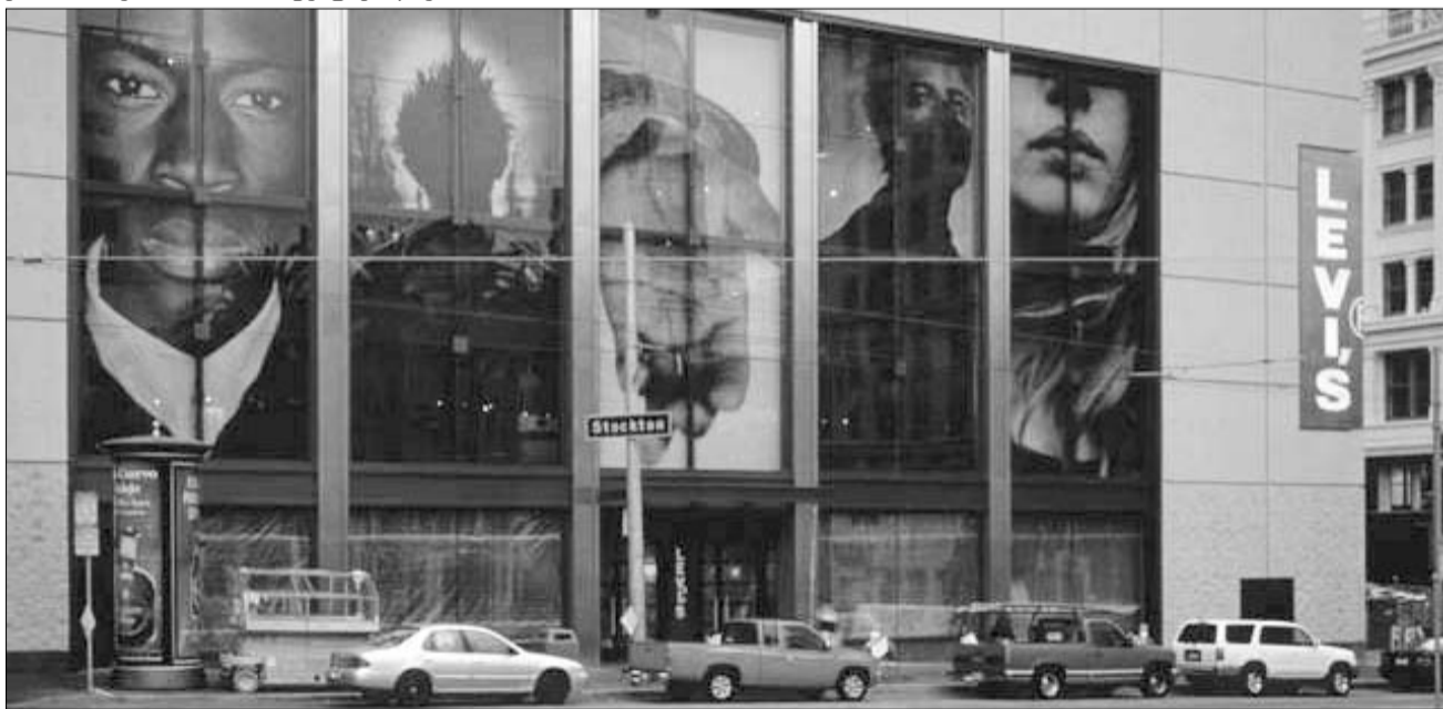
'ლევისის' უნივერსალური მალაზია სან ფრანცისკოში