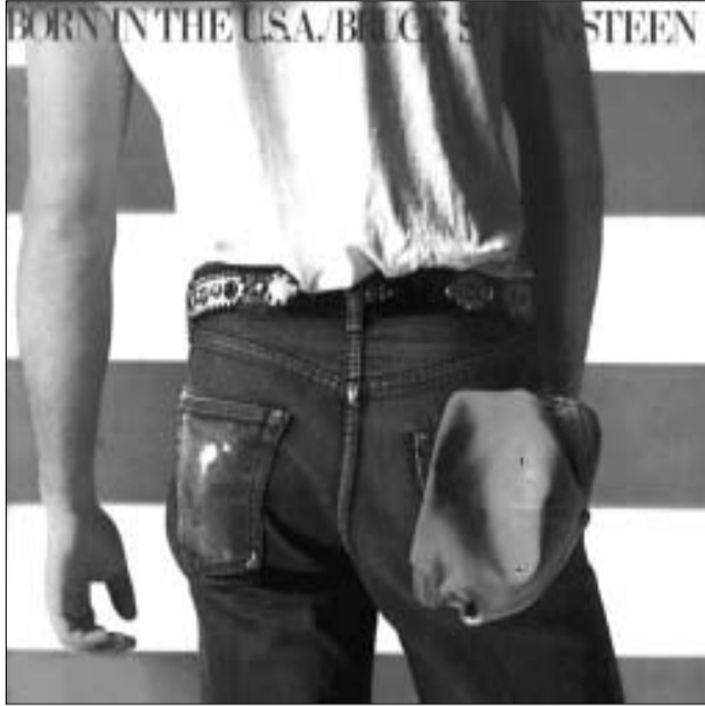
ჭინის და როკი: სპრინგსტინის Born In The U.S.A. და 'როლინგ სტონზის' Sticky Fingers

ახალ წელს კომპანია ასეთი ანგარიშით ხვდება: "ლევისი" გახლავთ ჯინსის ერთადერთი მწარმოებელი, რომელსაც მსოფლიო ბაზარი ყველაზე მასშტაბურად აქვს ათვისებული, ხოლო მისი სავაჭრო ნიშანი 160-მდე ქვეყანაშია რეგისტრირებული. 2003 წელი კი კომპანიისთვის მართლაც ოქროს იუბილეს პერიოდი: ლევი სტრასის დღეობა, ლურჯი ჯინსის გამოგონების 130 წლისთავი და კომპანიის დაარსების 150 წლის იუბილე.