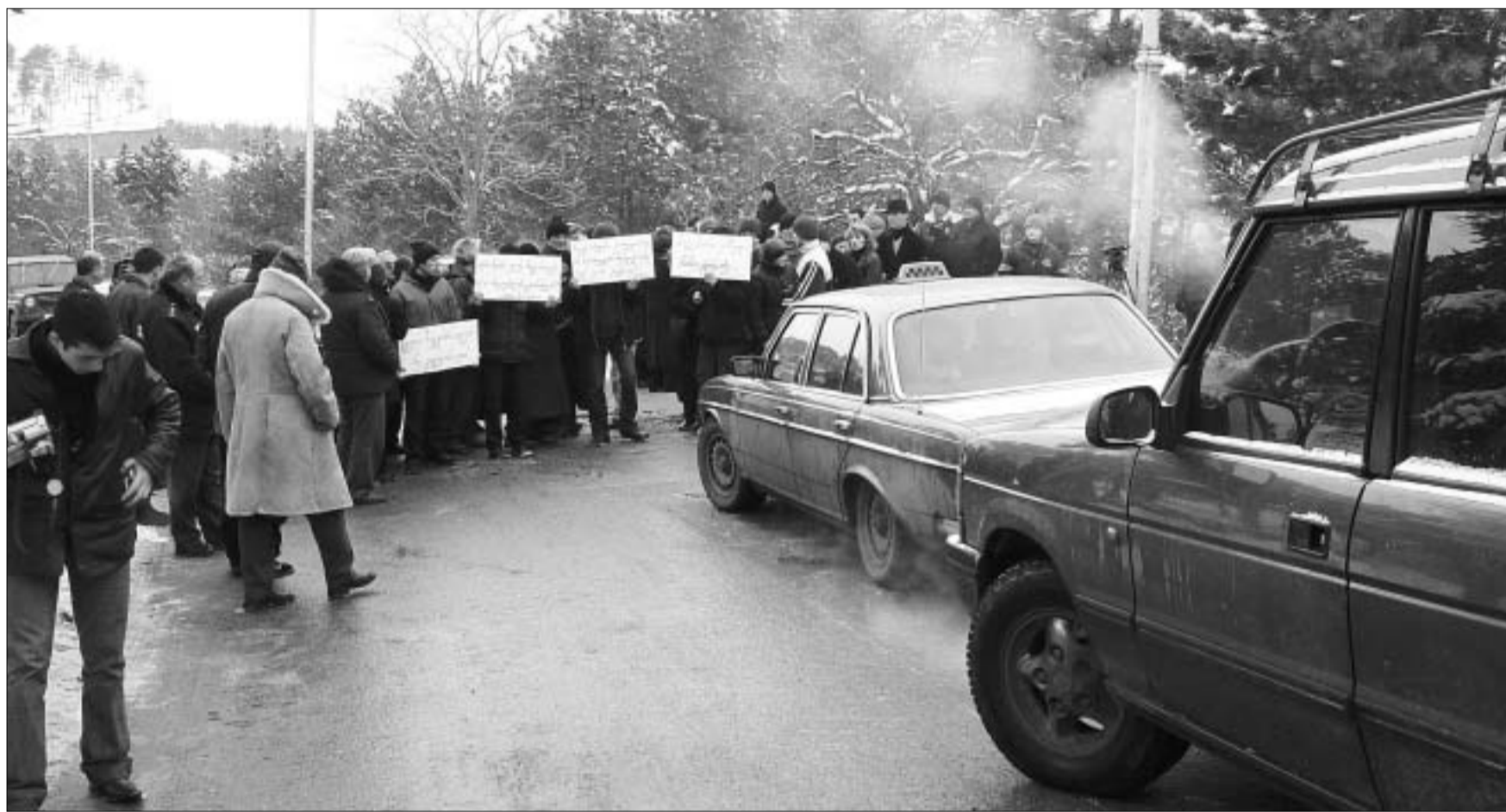
ასე ებრძვიან დევნილები ენერგოკრიზისს.