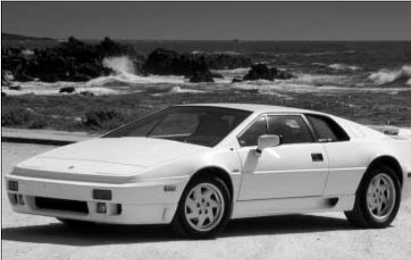
ლოტუს ესპრიტი ნარჩობაზე შეხება

თუმცა, ბონდი რა შუაშია, როცა ავტომობილი, რომელსაც გასული 26