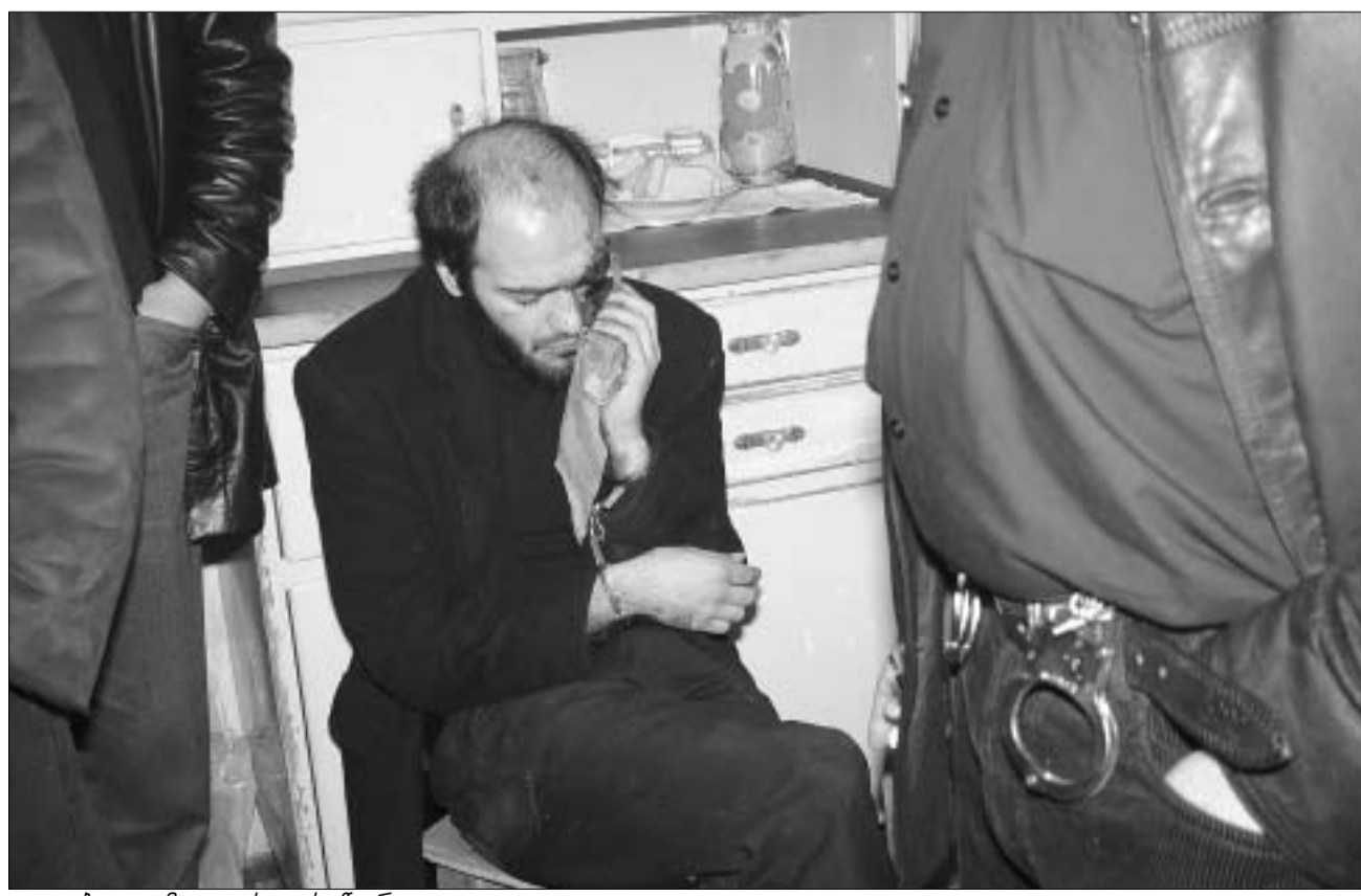
დაკავებულ ყაჩაღთა ჯგუფის წევრი.