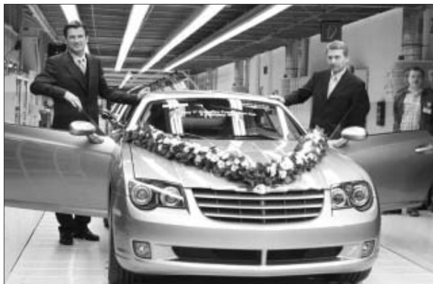
ეს-ესაა კრაისლერ ქროსფაიერი პირველი ნაბიჯი გადადგა

ტები, რომლებიც კარგა ხანია, წარმოებაში გამოიყენება.