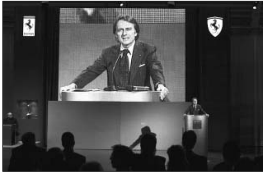
ლუკა დი მონტემელო რეგულაციით იმუქრება

2002 წლის სეზონის დასრულების შემდეგ, "სამეფო რბოლის" მამამთავრებმა, დრო უქმად რომ არ დაეკარგათ, ნოვატორულ იდეებს ფართო გასაქანი მისცეს. ერთი ახალი იდეებს ესალმებოდნენ, მეორენი უკმაყოფილებას გამოთქვამდნენ. ასეა თუ ისე, ფაქტია: აქამდე არსებული შედარებითი სიმშვიდე დაირღვა. ბევრ სიკეთესთან ერთად, ფორმულა 1-ს ალმართში ანტიტამბაქოს პროპაგანდაც წამოეწია. ახლა და, "სამეფო რბოლების" 72 წლის მხცოვან იმპრესარიოს, ბერნი ეკლსტონს, ფორმულა 1-დან კომერციული უფლებების გამოსყიდვაც სურს.