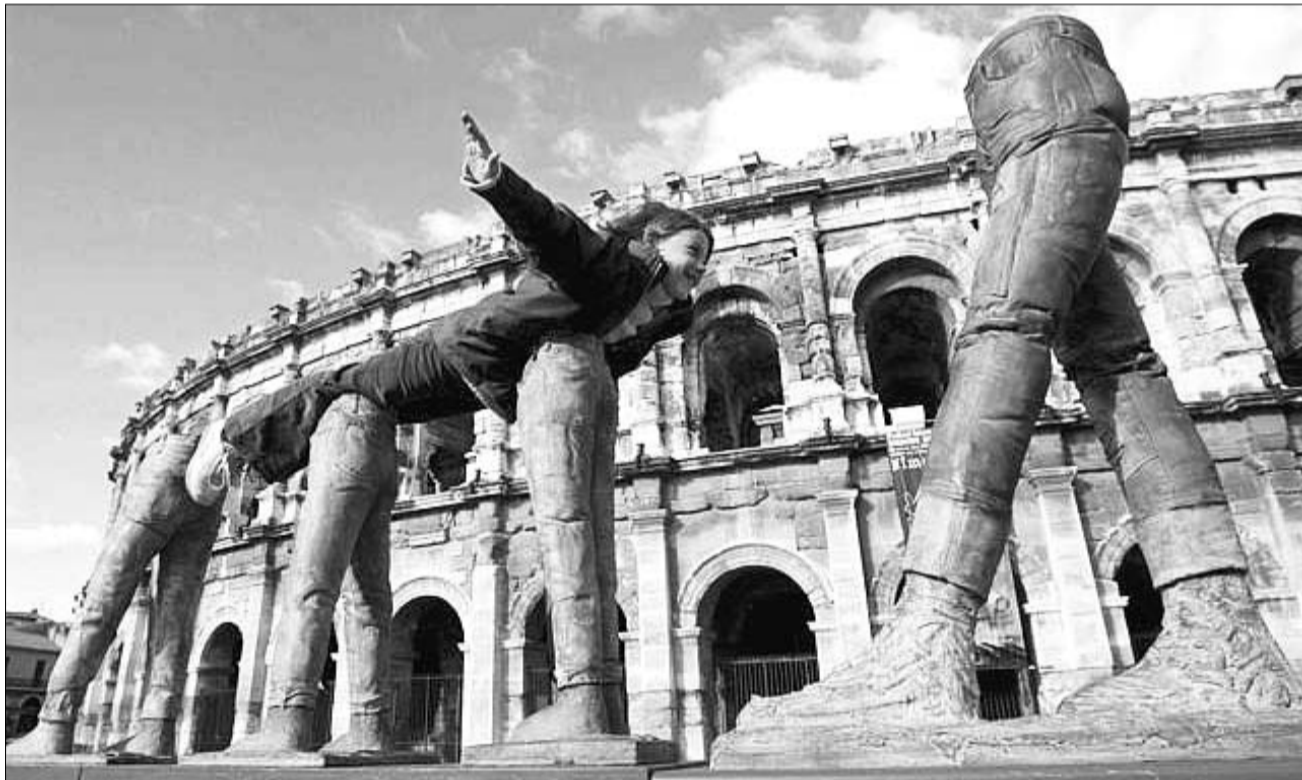
ჭინის საერთაშორისო ფესტივალზე ნიმუში