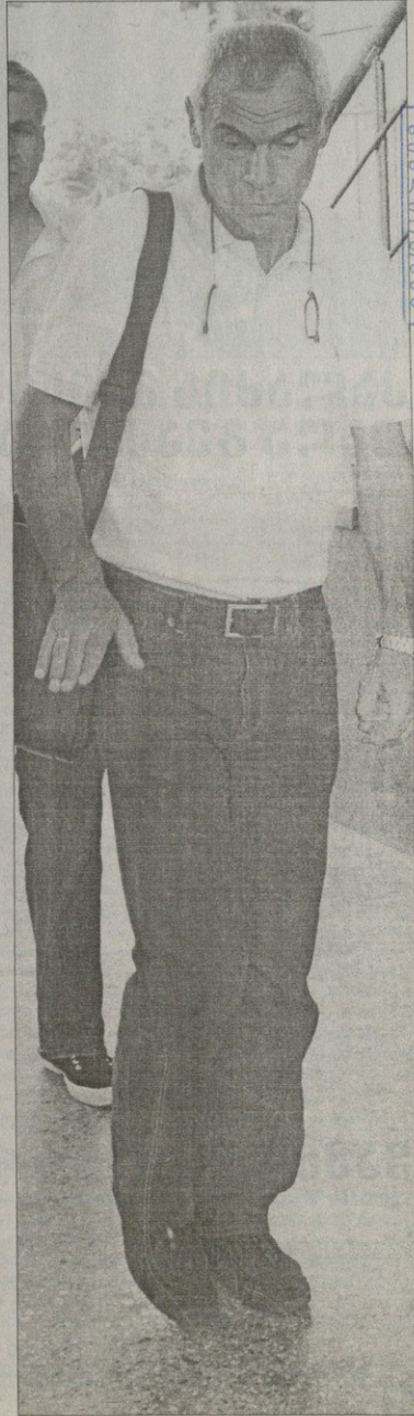
საქართველოს ეროვნული ნაკრების მწვრთნელი ექტორ რაულ კუპერი

ერთს დავძინთ, საქართველოს ნაკრების ფეხბურთელებს ეროვნული გუნდის სხვა მწვრთნელებისთვისაც მიუმართავთ იმ თხოვნით, რითაც ასათიანმა კუპერს მიმართა.