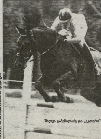
შელო გაიბედიდა და "ეკლერი"