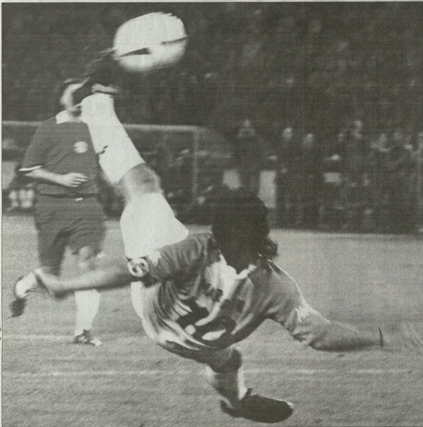
მუხამედოვი მარადონასთან ერთად

„სტადიონზე ათეულ ათასობით მოსული ადამიანი და მილიონობით ტელემაყურებელი საქართველოსა და საზღვარგარეთის ქვეყნებში მონძე და მონაწილე გახდება დაუნიყარი საფეხბურთო სპექტაკლისა, რომელიც ხელს შეუწყობს ჩვენი ქვეყნის პოპულარიზაციას მსოფლიოს ქვეყნებში...“