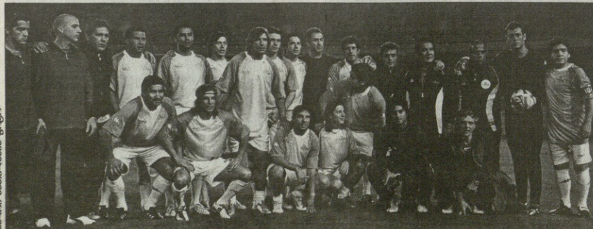
პატარალიშვილი მარადონასთან ერთად