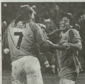
პატარალიშვილი მარადონასთან ერთად

დიდი დიეგო კი თამაშზე უარს ამბობდა, კონტრაქტის პირობები ირღვევო. რა წერილი იმ კონტრაქტში, ზუსტად ვერ გეტყვით, თუმცა, როცა საქმის გარჩევა დანაყო, ითქვა, კონტრაქტის ერთ-ერთი პირობა სავესტ სტადიონიც არისო. ტრიბუნებზე კი... მატჩის დაწყება 45 წუთით გა-