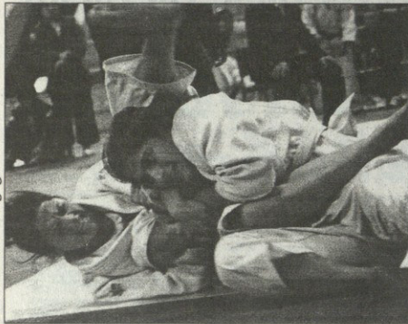
მადრიდში, სპაინი პეიჯის დახმარებით