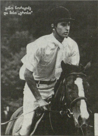
ვინა წინაკივე და მისი "იროსი"