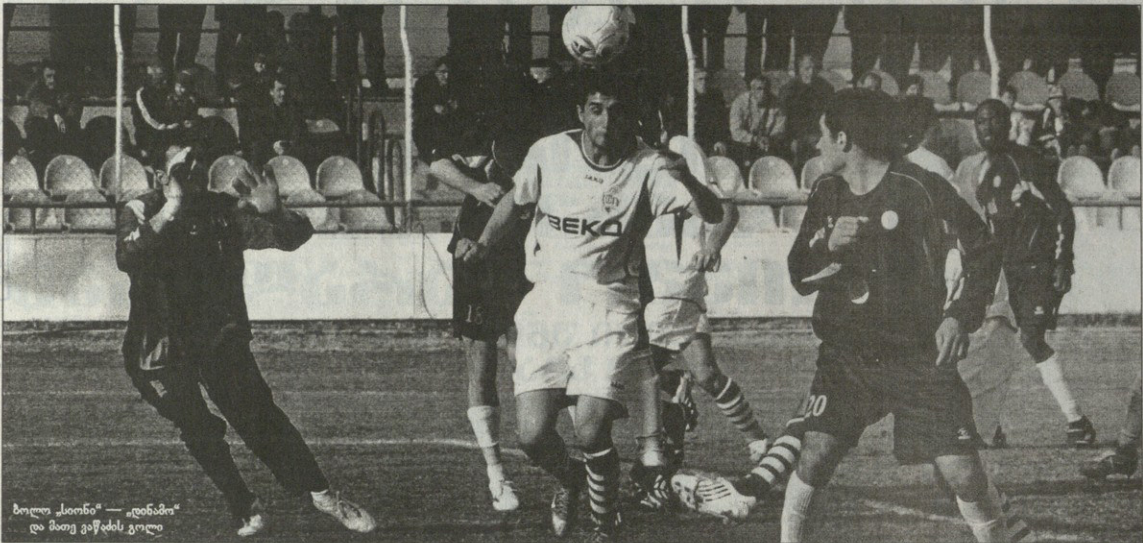
ბოლო „სიონი“ — „დინამო“ და მთავარი გოლის კოლაჟი