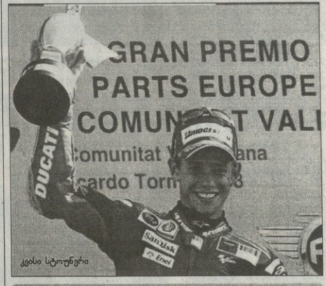
მსოფლიოს მთავარი სავან-ტამპლი-წირული მოტორბოლი მებრე, 21-მ კლასი, პავლიოსი, რობი პედროსი, პავლიოსი, პავლიოსი, 26 წამოგაბი