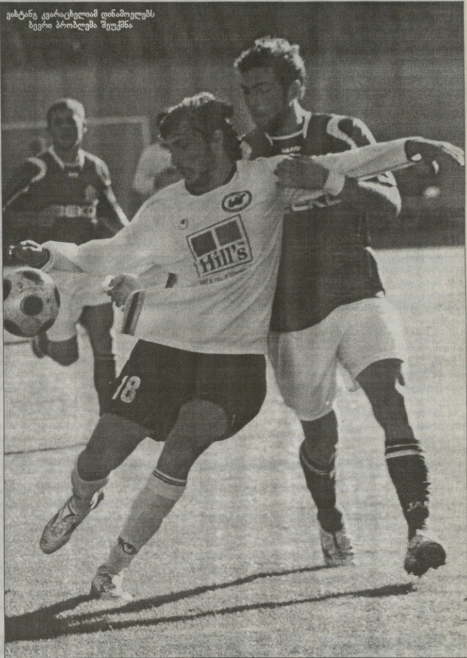
გატანე ვარჯიხელიამ დინამოელებს ბეგირ პრობლემა შეექმნა