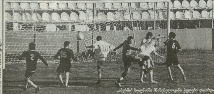
ამერიკა ბოლინსში წმინდელიანი ქოლბენ დაქაბა