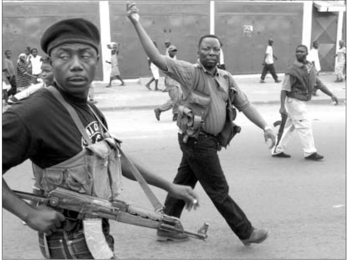
ლიბერიის თავდაცვის მინისტრი თავის მომხრეებს ბრძოლისაკენ მოუწოდებს

ბუმის ადმინისტრაცია, რომელსაც, ლიბერიაში ჯარების