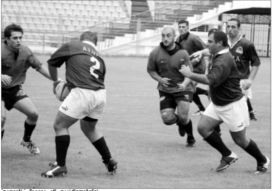
დათეებს შეტევა არ დაასრულებინეს.

- აღწვითებას ვერ მალავდა მატჩის შემდეგ ბათუმელთა მწვრთნელი რამაზ სანგლიძე. მწვრთნელის ასეთი რეაქცია მსაჯის ნაშედეგადრამა გამოიწვია - ზაზა ლუცუაძემ შეხვედრა ორი წუთით ადრე დაასრულა. ამის გამო ბათუმელებმა რაგბის კავშირის სახელზე პროტესტი დაწერეს და საქმის განსახილველად 100 ლარიც დატოვეს.