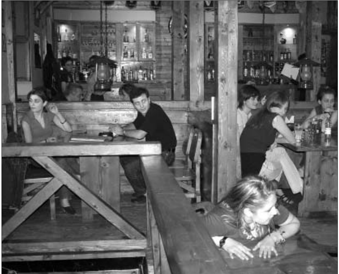
დუბლინში მისლა ნამდვილად ღირს

ნენიანს გავწვდომოდით, ხოლო პი-პროცესი გავლავით, ცივი ლუდის დაივაცა - მით უმეტეს, თან გულს ისიც ახარებდა, რომ ვიღაცა გემსა-ხურებდა.