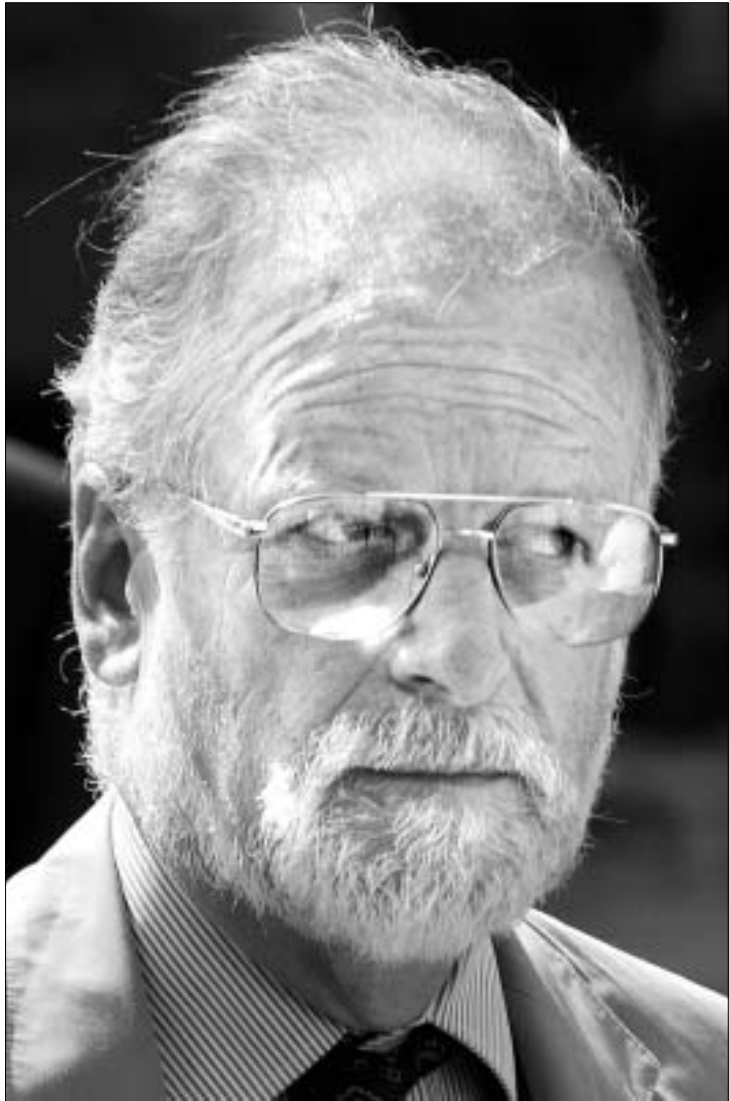
მოკლული ექსპერტი დევიდ კლი

გუმინ ბი-ბი-სი-მ განაცხადა, რომ დოქტორი დევიდ კლი ტელეკომპანიის ანონიმი წყარო იყო, რომლის ინფორმაციის მიხედვითაც, ბი-ბი-სი-მ განაცხადა, რომ ბრიტანეთის ხელისუფლებამ ერაყის ბირთვული იარაღის საქმე "შეთიხნა".