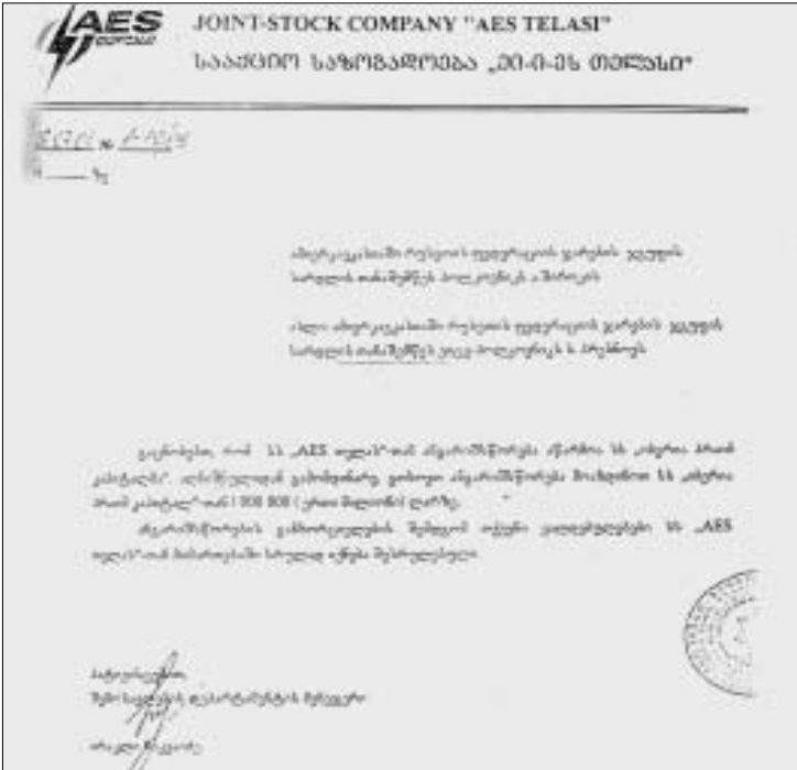
საქმი წერილი, რომლითაც "ინტერპრაიმ კაპიტალმა" მილიონი ლარი მიიღო.

ყველაზე რთი დანიყო, რომ სხვადასხვა ორგანიზაციებს ერთმანეთის ვალი დაეკრებინათ: რუსეთის ჯარების შტაბს - "AES თელასის", "AES თელასს" - საქართველოს ელექტროენერჯის საბითუმო ბაზრის, ბაზარს - თბილსრესის. მათათლია, ვალების ოდენობა სხვადასხვა გახლდათ, მაგრამ შეთანხმება - მხოლოდ და მხოლოდ ზეპირი - მინც აღვივლად დადიოდა, პოპულარულ ენაზე რომ ვთქვათ, მოხდა ვალების ჩვე-