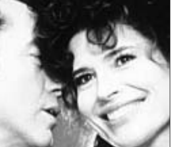
კიდრი ფილმდინ "დცივნა"