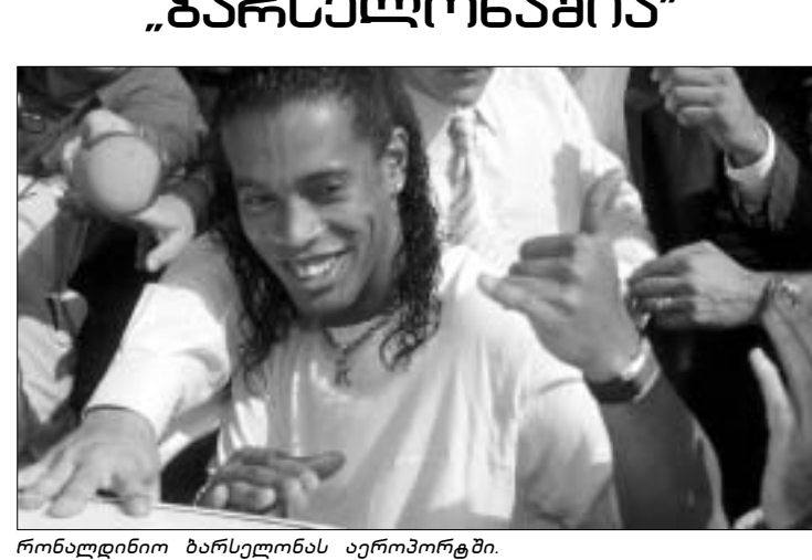
რონალდინიო ბარსელონის აერიპორტში.

რულ მოლაპარაკებებს აწარმოებდნენ რონალდინიოს. ყველაფერ ამას დაემატა ისიც, რომ უკანასკნელ მონეტში ინგლისელმა ფული დევენანათ და პრეზენტმა 20 მილიონის გადახდა შეურჩა. ინგლისებმა "სენ ფერმეს" მხოლოდ 22 მილიონი ევრო შესთავაზეს, ამ დროს გამორჩა "ბარსელონაც". კატალონიელებმა "სენ ფერმეს" 25 მილიონი (დამატებით 5 მილიონი, თუ "ბარსელონა" რაიმე მნიშვნელოვან ტიტულს მოიპოვებს) შესთავაზა და საქმეც მოვედრა - რონალდინიო "ბარსელონაში".