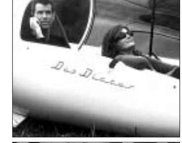
ტომას კრანის თაღლითობა