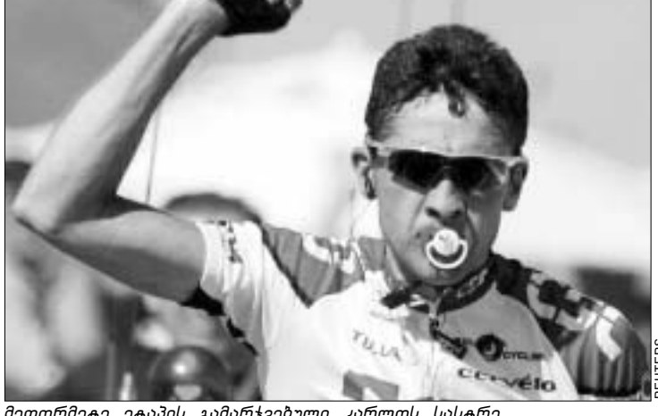
მეთორმეტე ეტაპის გამარჯვებული კარლოს სასტრე.