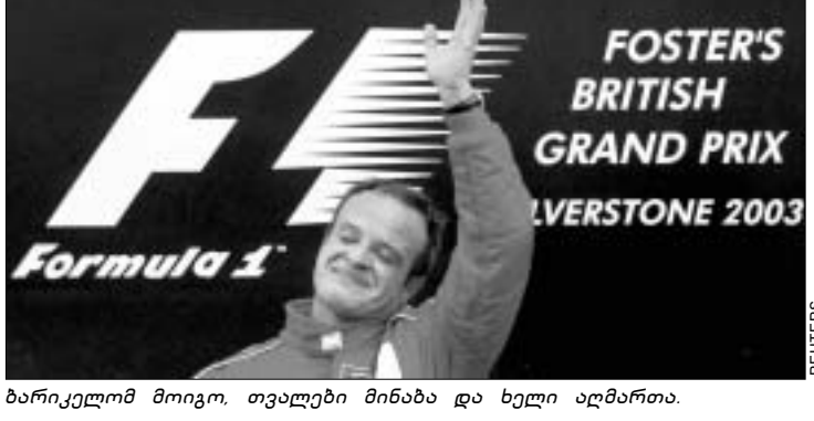
ბარიკელომ მოიგო, თვალები მინახა და ხელი აღმართა.

აღბათ, გაინტერესებთ, საიდან დანყო თანამედროვე ფორმულა 1. ფრანგები თვლიან, რომ სწორედ ისინი არიან პიონერები, მაგრამ ბრიტანელებსაც რომ იგივე პრეტენზია აქეთ! როგორც უნდა იყოს, უდავოა, სილვერსტონის ტრასა ბრიტანეთის ავტოსპორტის სამშობლოა. ისიც ფაქტია, რომ მსოფლიოს არც ერთ ჩემპიონატს არ ჩაუვლია დიდი ბრიტანეთის გრან-პრის გარეშე, ისევე როგორც იტალიის გრან-პრის გარეშე. გუშინ სილვერსტონმა სამეფო რბოლების მე-11 ეტაპს უმასპინძლა.