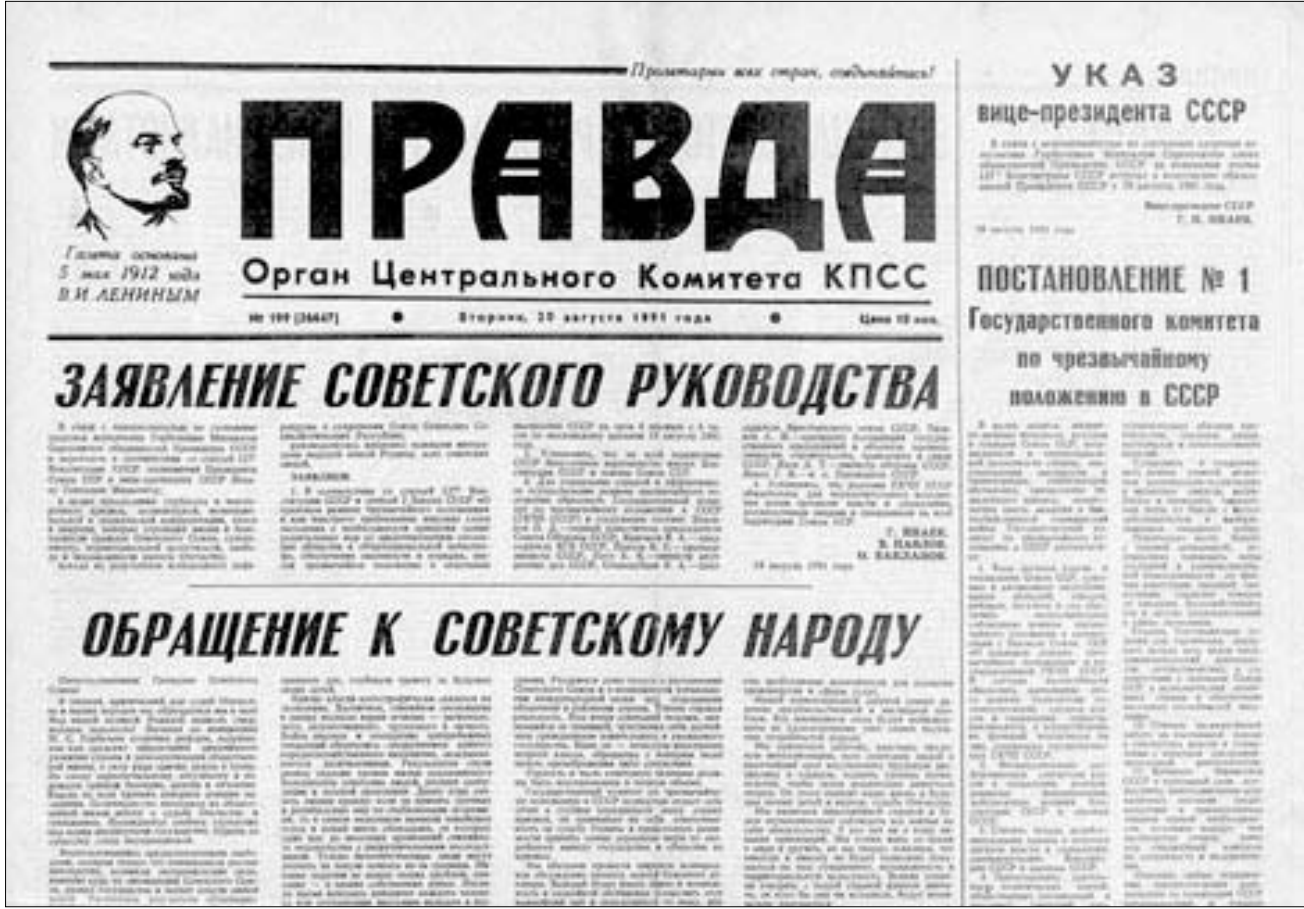
პრავდა-ს კლასიკური პირველი გვერდი