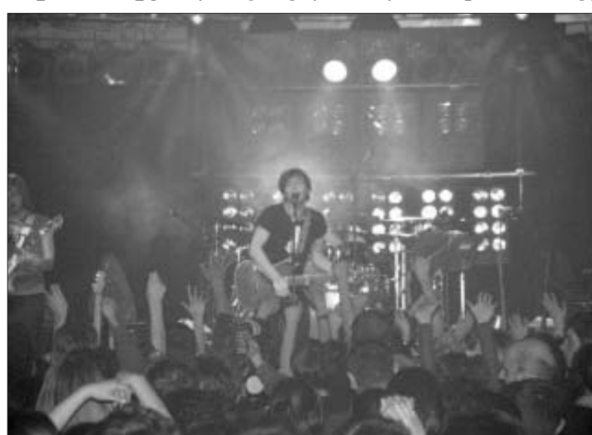
მუმი ტროლს "აჭარა მიუზიკ ჰოლში"

ვინც სამშაბათს "აჭარა მიუზიკ ჰოლში" ერთ-ერთი ყველაზე პოპულარული რუსული ჯგუფის კონცერტს დაესწრო, მუმი ტროლსადმი განსაკუთრებული სიმპათიების მიუხედავად, მისთვის ნანახმა და მოსმენილმა მოლოდინს ნამდვილად გადააჭარბა. თბილისური კონცერტი განსაკუთრებული იყო თავად ვლადივოსტოკელი მუსიკოსებისთვისაც. თბილისელი პრომოუტერების შეთავაზებაზე, მუსიკოსებმა თურმე ბევრი იყოყმანეს საქართველოში ჩამოსვლაზე. პირველ რიგში, ისინი დარწმუნებულნი არ იყვნენ, რომ ჩვენთან მათ ჯგუფს იცნობდნენ და თანაც, ბოლო დროს რუსეთ-საქართველოს შორის დაძაბული პოლიტიკური ფონის გათვალისწინებით, ფიქრობდნენ, რომ თბილისში მათ გარკვეული უნდობლობით დახვდებოდნენ. მაგრამ, მუმი ტროლს-ის წევრები საკუთარი მოსაზრებების უსაფუძვლობაში ძალიან მალე, ჩამოსვლისთანავე დარწმუნდნენ. კონცერტის ბოლოს კი გაოგნებული მსჯელობდნენ "აჭარა მიუზიკ ჰოლის" აუდიტორიასა და ჯგუფის პოპულარობაზე საქართველოში.