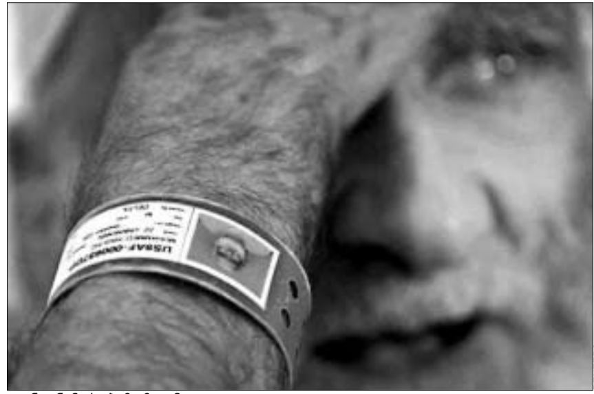
გუანტანამოს ბაზაზე მყოფი ტყვე

ამერიკის შეერთებული შტატებ- ის სააპელაციო სასამართლომ დაა- დგინა, რომ პატიმრებს, რომლებსაც კუბაზე ამერიკის გუანტანამოს სამ- ხედრო ბაზაზე ამყოფებენ, უფლება არ აქვთ, მოითხოვონ მათი საქმე- ბის ამერიკულ სასამართლოში განხი- ლვა. სასამართლოს ეს ვერდიქტი ჯორჯ ჯუშის ადმინისტრაციის სე- რიოზულ გამარჯვებად ჩაითვალა. მოსამართლის არგუმენტაცია კი ასე- ით გახლდათ: გუანტანამოს ბაზაზე მყოფი პატიმრები, რომლებიც თა- ლობებთან და “ალ ქაიდასთან” კავში- რში არიან ეჭვმიტანილი, შეერთე- ბული შტატების ტერიტორიის გარე- ეთ მყოფი უცხო ქვეყნების მოქალა- ქეები არიან და, ამერიკის კონსტი- ტუციით, უფლება არ აქვთ, რომ და- ცვაზე პრეტენზია ექონებოდნენ.