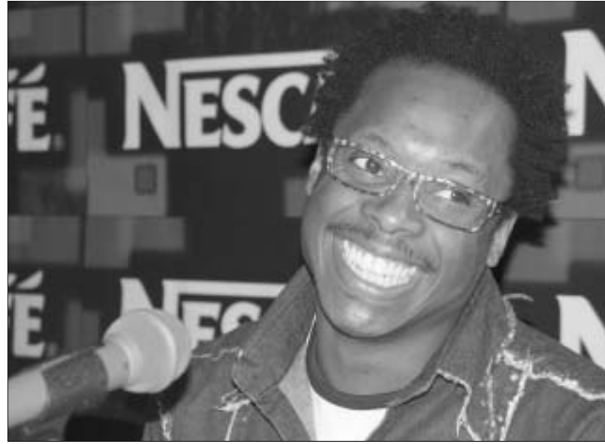
დენის როლინის მეორედ თბილისში

გუშინ "ნესკაფე დენს ფართის" მეორე კონცერტში "აჭარა მიუზიკ ჰოლში" გაიმართა. "ნესკაფესა" და "ისტერ პრომოუშენის" ერთობლივი პროექტი ერევის შემდეგ თბილისში გაგრძელდა. სომხეთში ინგლისელი ტრომბონისტი პირველად ჩავიდა. დენის როლინ-სისთვის უფრო მნიშვნელოვანი თბილისელი აუდიტორიის მეორედ გაოცება იყო. დენის როლინის ამირეკავკასიაში მეორედ ჩამოყვანა კვლავაც "ზრითომ ეარვეისმა" აიღო თავის თავზე. "ის რომ, ჩემი დღევანდელი კონცერტი ჯავ-ფესტივალის ფარგლებში არ იმართება, მეტ თავისუფლებას მაძლევს. შეზღუდული არც საკონცერტო პროგრამა შექმნება ხანგრძლივობის ნათესაზრისთვის", - თქვა ინგლისელმა მუსიკოსმა კონცერტამდე რამდენიმე საათით ადრე.