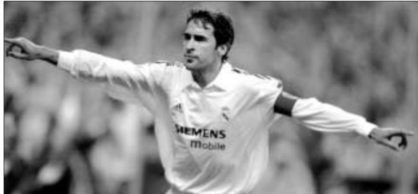
რაულის ანგარიშზე "მილანის" კარში გატანილი ორი გოლია

"რეალი" მთელი მატჩის მანძილზე ფლობდა უპირატესობას, გამარჯვების გზაზე ცხადი რაულია - ორი ჩინებული გოლის ავტორი. "მილანელთა" ალბათ ერთადერთი შანსი, რეალდომ გამოეყენა, თუმცა შეცვლაზე თამოსულმა გუნდში ყველაფერი კვლავ თავის ადგილზე დაბრუნდა და "რეალს" ორბურთიანი უპირატესობა შეუნარჩუნა. რაულის გარდა, გუშინდელ შეხვედრაში კიდევ ერთი ფეხბურთელი იყრობდა ყურადღებას: ფერნანდო რედონდო. "რეალის" ყოფილი ნახევარმცველი ორი წლის უკან გადაბრავდა "მილანში", ხოლო გუშინ მისი დებიუტი შედგა ჩემპიონთა ლიგაში, ცხადია ეს დებიუტი "მილანის" შემადგენლობაში იგულისხმება, თორემ "რეალი" თამაშის ის ამ ტურნირის საუკეთესო მოთამაშედ კი იქნა აღიარებული 2000 წელს. "სანტიაგო ბერნაბეუზე" შეკრებილი 76 ათასი გულშემატკივარი გულთბილი ოვაციებით შეეგება რედონდოს, მათ ხომ კარგად იციან, რომ რედონდოს გული კვლავინდობურად "რეალისთვის" ძვრის. არგენტინელი არასოდეს მალავს, რომ დღემდე მადრიდში დარჩენილი იყრობდა ყურადღებას: ფერნანდო რედონდო. "რეალის" ყოფილი ნახევარმცველი ორი წლის უკან გადაბრავდა "მილანში", ხოლო გუშინ მისი დებიუტი შედგა ჩემპიონთა ლიგაში, ცხადია ეს დებიუტი "მილანის" შემადგენლობაში იგულისხმება, თორემ "რეალი" თამაშის ის ამ ტურნირის საუკეთესო მოთამაშედ კი იქნა აღიარებული 2000 წელს.