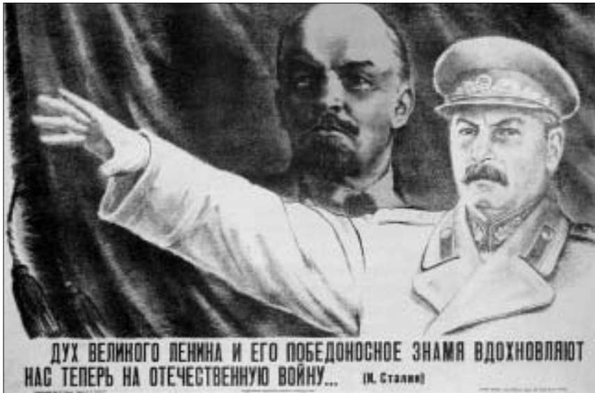
მეორე მსოფლიო ომის დროინდელი პლაკატი

ორი ლენინის ორდენის და ოქტომბრის რევოლუციის ორდენით დაჯილდოებული გაზეთი "პრავდა"