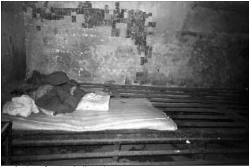
საკანი, სიღრმადი პატიმარმა გაქვევა სკვადი.

მშრომელი იმის გამო დაჭრა, რომ მის საუბარში ეჭვი შეიტანა – აგენტობას მთავაზობსო. სწორედ ამ საქმის გა- მოძიების პროცესში სკვადი პატიმარ- მა საპრობოლიდან გაქცევა. ნახევრ- ად სარდაფის ტიპის საკანში, რომე- ლშიც ქებაზე მარტო იმყოფებოდა, შემონებისას ორი მეტრი სიღრმის ორმო იპოვეს. შემონებმა საკნებში,