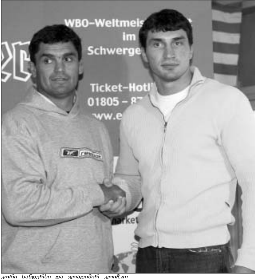
კორი სანდერსი და ვლადიმერ კლიჩკო

ამასობაში კი ტელეკომპანია HBO ვლადიმერ კლიჩკოსთან დადებული ხელშეკრულების გადახედვის შესაძლებლობას განიხილავს. კონტრაქტი, რომელიც სამხრეთაფრიკელთან ორთაბრძოლამდე სულ ცოტა ხნით ადრე დაიდო, უკანონო მორიგის ცხრა ბრძოლის ტრანსლაციას ითვალისწინებს. ასე რომ, გამორიცხული არ არის, HBO-მ კლიჩკო-უმცროსის კონტრაქტის ცალკეული მუხლები შესთავაზოს. კერძოდ, ყოველი მიმავალი ორთაბრძოლის წინ ვლადიმერის ცალკეულ, უფრო ზუსტად, ერთჯერად კონტრაქტს დაუდებენ. რა გამოვა აქედან, ამას მომავალი გვიჩვენებს, მანამდე კი სანდერსი აცხადებს: ვიდრე გამარ-