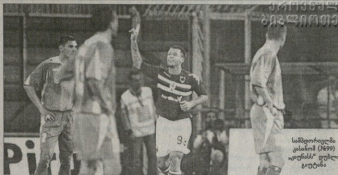
სამარეილია ქასანი (1699) კოპენსის სტადიონზე