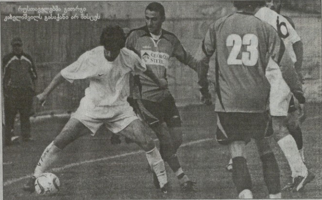
რუსთაველებმა ვიოტი გახელა და გასწავლეს