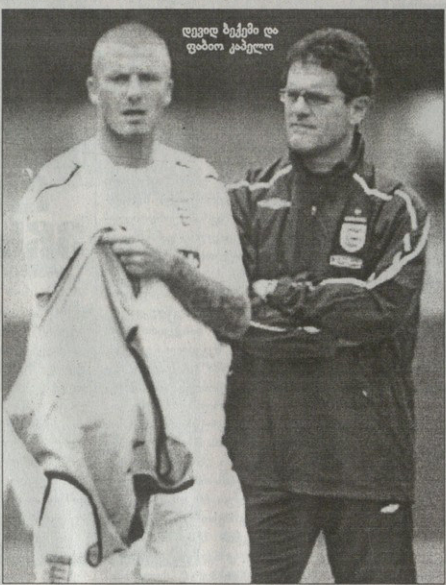
დევიდ ბექემი და დიბო კაკალო

ხვედრობის ის არ გამოიძიება არადა, ანერ კაქალომ მინიშნა, რომ ბექემი, შესაძლოა, გერმანიის ეროვნულ ნაკრებში გასაშვებლად გერმანიის ნაკრებში ემსახურებოდნენ კი არა. ლეს სიტყვათა სხვაობად ჩანს. სავარაუდოდ, იგი კერძო ბერლინის ინტელის ნაკრები და 7 ათასი ფანი მის გარეშე ვიკოს-ზარება.