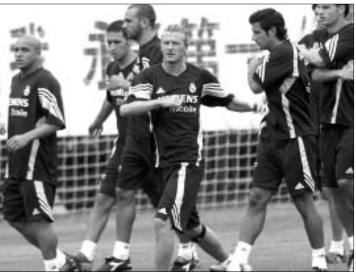
"რეალი" ორშაბათის ვარჯიშისას

"რეალის" ვარჯიშებზე ჩინეთში ბილეთები იყიდება. მადრიდელთა პირველ ვარჯიშს ადგილობრივი გულშემატკივარი მოულოდნელად ელოდა და უამრავი ბილეთიც გაიყიდა, მაგრამ სპორტულ ბაზაზე შეკრებილი ქომაგები ხახამშრალები დარჩნენ: "რეალი" საერთოდ არ მოვიდა სავარჯიშოდ. გუნდის ხელმძღვანელობამ განაცხადა, რომ იმ დღეს (ეს კვირას ხდება) ისინი საერთოდ არ გეგმავდნენ ვარჯიშს და ეს მხოლოდ გაუგებრობის ბრალი იყო. მეორე დღეს, ორშაბათს, "რეალი" მოვიდა ვარჯიშზე, თუმცა, მის სანახავად მიუსული ჩინელები ისევ იმედაცურებდნენ.