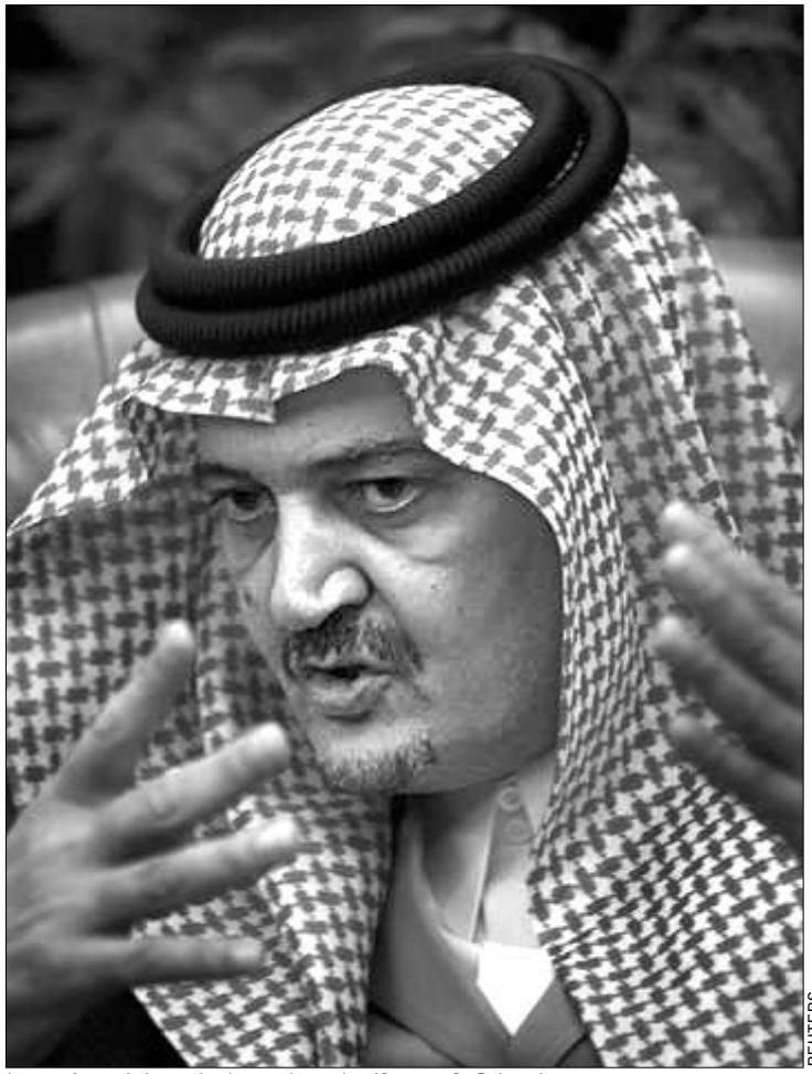
საუდის არაბეთის საგარეო საქმეთა მინისტრი პრინცი საუდ ალ-ფიასალი.

გასულ კვირას შეერთებულ შტატებში საუდის არაბეთის ელჩმა პრინცი ხადარ ბინ სულთანი ფიჩენ საკითხების საჯაროდ განხილვა, განაცხადა, რომ მოხსენების