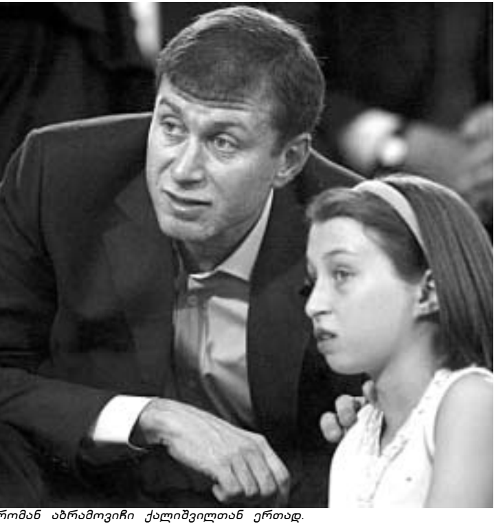
რომან აბრამოვიჩი ქალიშვილთან ერთად