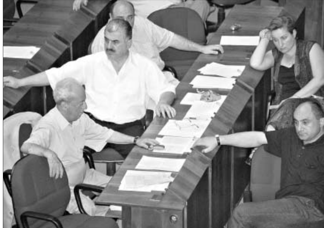
გუშინდელ სხდომაზე სახელისუფლებო ბლოკმა „სირიკლემის პოზა“ აირჩია და თავისი სათქმელი „აღორძინება“ ათქმევინა

გუშინდელ სხდომაზე სახელისუფლებო ბლოკმა „სირიკლემის პოზა“ აირჩია და თავისი სათქმელი „აღორძინება“ ათქმევინა. საპარლამენტო უმრავლესობის მიზნების მიხედვით, რომ განსაზღვრული უკან დარჩა. მართლაც, ბიუჯეტის გეგმის ბოლომდე მიყვანა, ერთი შეხედვით, თითქოს, სისხელს აღარ წარმოადგენდა, მაგრამ გუშინ გაირკვა, რომ ყველა ნაღმი გაუვრცელდებოდა არ არის და საბოლოო მიღებამდე საარჩევნო კოდექსს კიდევ გრძელი გზა აქვს გასავლელი. ძნელი სათქმელია, რა შედეგს გამოიღებს „აღორძინება“ და სამთავრობო ფრაქციების ზოგიერთი წევრის მტკიცებით, რომ პირველი მოსმენით უკვე მიღებული კანონპროექტის ანულოტივობა მოხდეს, მაგრამ გუშინდელი დღე მათ ნამდვილად შუქლია, საკუთარ აქტებში ჩაწერონ: პარლამენტის რიგგარეშე სესიის სხდომა უნაყოფო