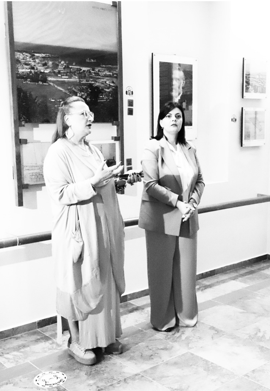
რესო ადამიანებთან შეხვედრები, ისტორიული თამაშები, რომლებიც გაცოცხლებს იმ პერიოდს, რომელსაც მიეკუთვნება მუზეუმი. არსებული ესა თუ ის ექსპონატი.

- განსაკუთრებულ მნიშვნელობას ვანიჭებ სამ ძირითად კომპონენტს. პირველი - აუცილებლად უნდა გაიზარდოს ნობელების მუზეუმის ცნობადობა, რაც, ბუნებრივია, ვიზიტორთა რაოდენობასაც გაზრდის. ასევე, საგანმანათლებლო პროგრამების განვითარება არის უმნიშვნელოვანესი, იქნება ეს ექსკურსიის, ლექციის, წიგნების სახით თუ წარმოდგენებით მიწოდებული. ასევე, აუცილებელია კონკურსები, ვიქტორიები, საინტერესო ადამიანებთან შეხვედრები, ისტორიული თამაშები, რომლებიც გაცოცხლებს იმ პერიოდს, რომელსაც მიეკუთვნება მუზეუმი. არსებული ესა თუ ის ექსპონატი.