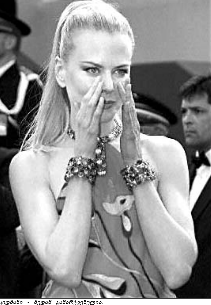
კიდმანი - მუდამ გამარჯვებულია.

პოლიეუდის ვარსკვლავთან დაკავშირებული უსამართლო ისტორია ასე დაიწყო: ნელს, 6 მარტს, "ოსკარების" დაჯილდოების ცერემონიალის წინა დღეს გაზეთის "დეილი მელის" გამოაქვეყნა სტატია. ნერილის ავტორი ირწმუნებოდა, რომ ნიკოლ კიდმანისა და ბრიტანელი მსახიობის ჯუდე ლოს ურთიერთობები თანდათან ღრმავდებოდა. ასეთი ინფორმაცია, კი როგორც მოგვიანებით აღმოჩნდა, არ აწყობდა