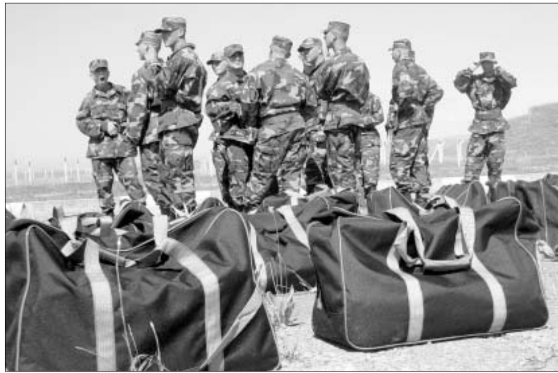
ქართული ასეული გასამგზავრებლად მზადაა.