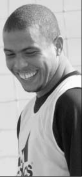
არც სხვათა კერპია უკერპო