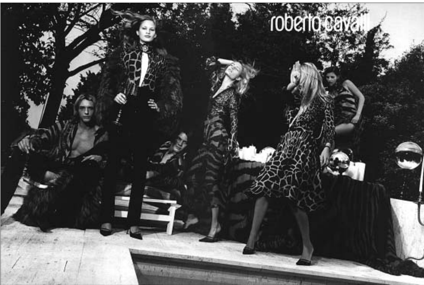
რობერტო კავალის მოდელები

"ჩემი ტანსაცმლის ჩაცმისთანავე ქალს აგონდება, რომ ქალია. მე ქალს ვეზმარები, რომ სწორედ ისე გამოიყურებოდეს, როგორც თავად ოცნებობს..."