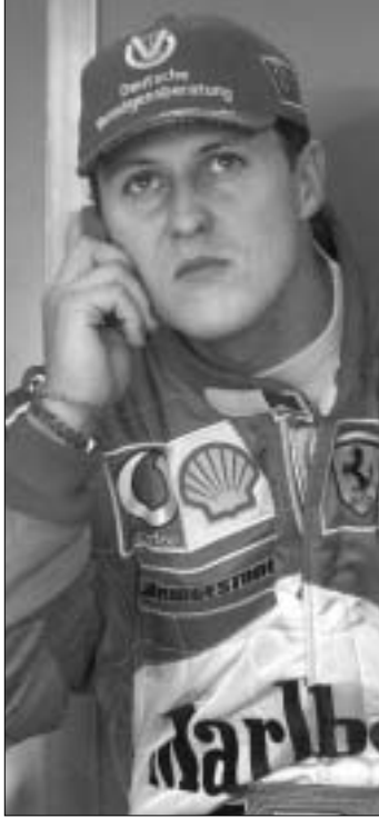
ლას კიმი რაიკონენი მოიგებს, შუმახერს ძალიან გაუჭირდება ფინეთისთვის გადასწრება. შუმახერი ახალი „ფორთი“ დაქრის, რაიკონენს ისევ ძველი ბოლიდი ჰყავს და ზოგჯერ ვერც კი ახერხებს ფინშიამდე მისვლას, მაგრამ, ამის მიუხედავად, „მაკლარენ-მერსედესი“ მაინც იმედოვნებს, რომ „ვერცხლისფერი პაპა“ (ასე შეარქვეს „ვერცხლისფერი ისრების“ დაძველებულ ბოლიდს, რომლის ასაკიც უკვე 20 თვეს ითვლის) რაიკონენის ამჯერად აღარ უღალატებს. რონალდოს და „ფერარის“ სხვა ტიფონებს კი სწორედ რაიკონენის კრახის და შუმახერის ტრიუმფის იმედია ალბათ, ამიტომაც არ მოწონდა.

რობლი ბრაზილიელი ფეხბურთელის იდეალი. მიხაელ შუმახერს კი რონალდო პირადად იცნობს. ყველადაც კარგადაა ცნობილი, რომ უფროსი „შუმი“ ფეხბურთითაა გატაცებული და საკმაოდ კარგად თამაშობს კიდევ. რონალდოს და შუმახერს ერთადაც გაულოვრება ბურთი. რონალდო აცხადებს, რომ ფორმულა 1-ის რბოლებს მიხაელ შუმახერის ხათრით ადევნებს თვალს. უფროსი „შუმი“ ახლა მძიმე დღეებში უდგას. პოკენჰამის ტრასა მისთვის ან დაფის გვირგვინის მომტანი იქნება, ანდა სრული კატასტროფის. სამ ავგისტოს, შესაძლოა, წლებანდელი ჩემპიონი ამიტომ გახდა ამერიკელი ევლო-