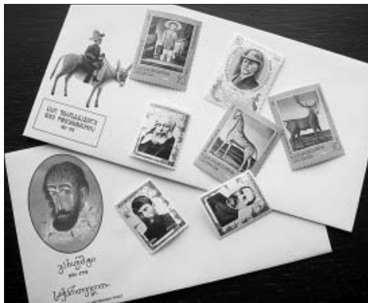
ქართული მარკები საბერძნეთში იბეჭდება.

საბჭოთა პერიოდში ქვეყანაში წელიწადში რამდენიმე ასეული მილიონი წერილი ბრუნავდა. დღეს საქართველოში მხოლოდ მილიონნახევარმდე გზავნილი მოძრაობს, მაგრამ ერთი დიდი განსხვავებით - უკვე ათი წელია კონვერტს ქართული მარკა აკრავს.