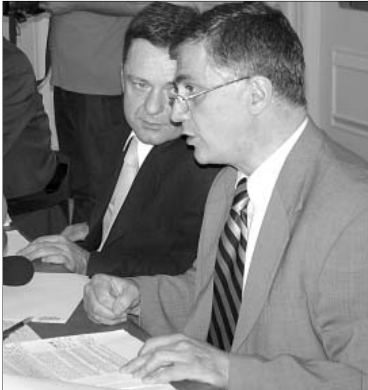
საკარეო საქმეთა უწყება ლტოლვილების მიმედ აფხაზეთში დაბრუნებას კატეგორიულად მოითხოვს.