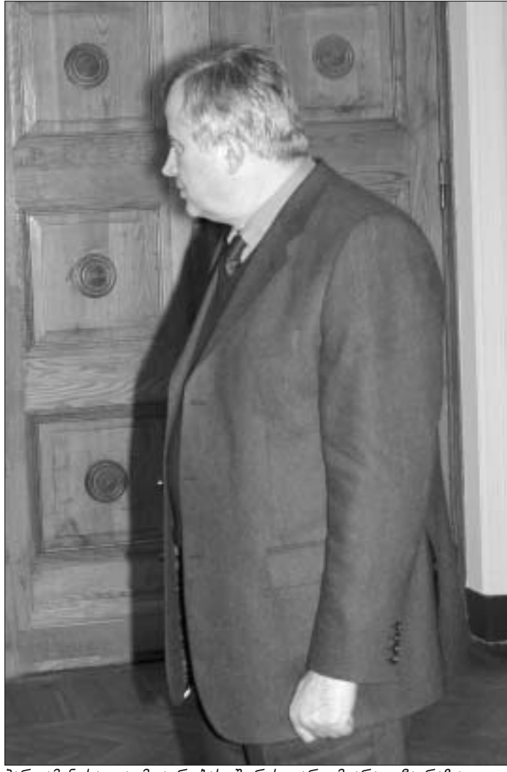
პარლამენტისა და მთავრობის შორის კარი მყარად ჩირჩხა.