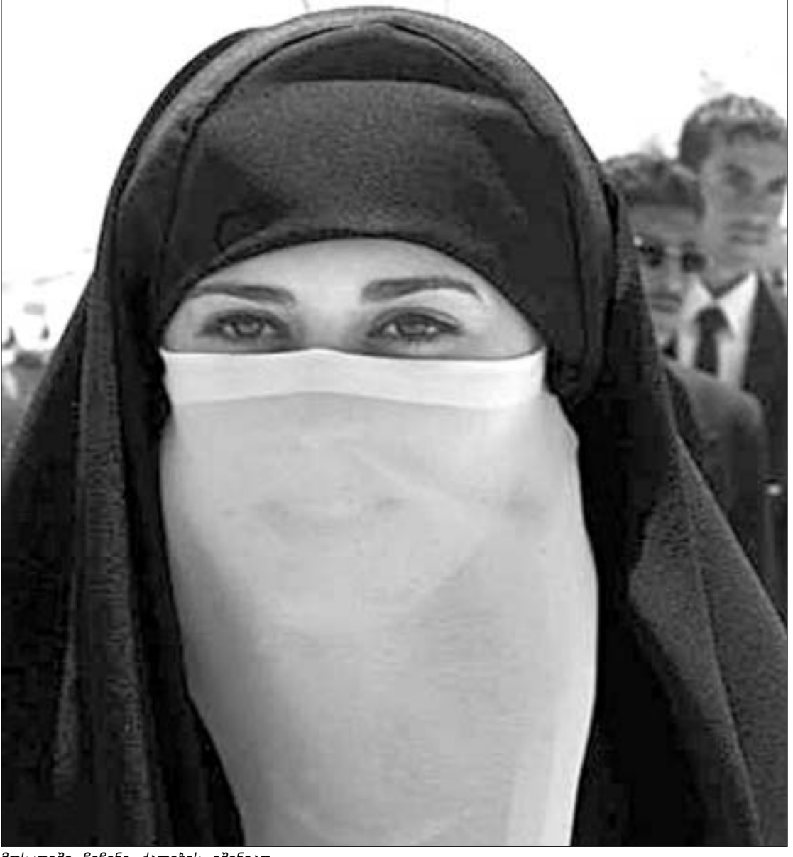
მოსკოვში ჩიჩენი ქალების ემინითა.