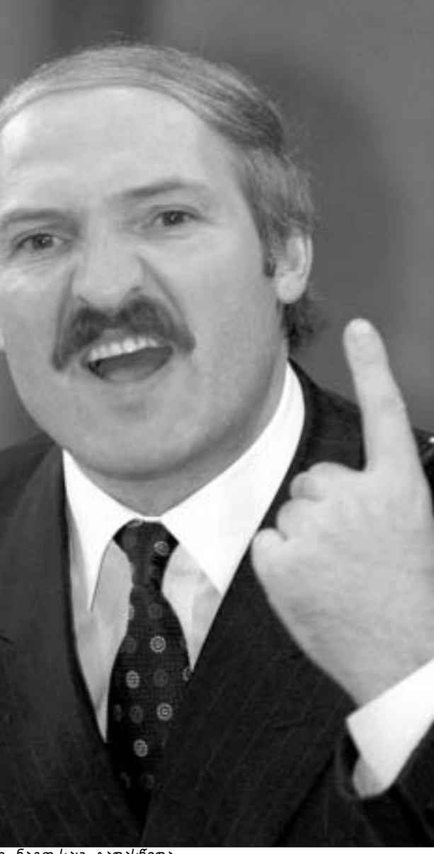
ლუკაშენკო ნატო-საც გადასწვდა.

გუშინ ბელარუსის პრეზიდენტი ლუკაშენკომ ერთდროულად გაილაშქრა შიდა ოპოზიციისა და დასავლეთის იმპერიალიტური ქვეყნების წინააღმდეგ. "მათი სადამის ორი შვილი მოკლეს, და ნახე, როგორ უხარიათ. ეს, სადამდე დაეცა კაცობრიობა", - ფილოსოფოსობდა იგი, თან თავის ოპოზიციას აფრთხილებდა, თუ არ გაჩერდებით, არჩვენებს ჩავშლი და რევერენდებით გავიგრძელვთ ვადასა.