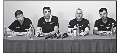
პერსპექტიული ბიჭები არიან და მათი კმაყოფილი ვარ.

ცხადია, აკროპოლისის თასის მოგება კარგია, მაგრამ მზად ვართ ყველა მატჩის წასაგებად, ოღონდ ევრობასკეტზე მძალი მოვიგოთ.