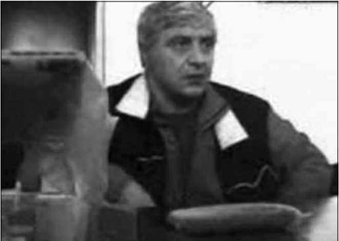
რა მიზნით უკავშირდებოდა წარიდ ფოცხვერია რუსეთში მყოფ „ქურდებს“