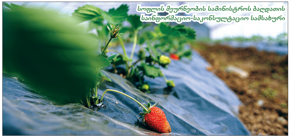
სოფლის მეურნეობის სამინისტროს ბაღდათის საინფორმაციო-საკონსულტაციო სამსახური

2017 წელს, ბაღდათის მუნიციპალიტეტში ყველაზე მნიშვნელოვანი პროექტი იყო სამელიორაციო ინფრასტრუქტურის სისტემატური აღდგენითი სამუშაოები. განხორციელდა აფხაზურის სარწყავი სისტემის სარეაბილიტაციო პროექტი, რომლის ფარგლებში რეაბილიტაცია ჩაუტარდა 5 კმ-მდე მაგისტრალურ არხს, მოეწყო მილხიდები და წყალსარეგულაციო კვანძები. გაინმინდა წყალმიმყვანი და გამანაწილებელი არხები, ჩატარებული სარეაბილიტაციო სამუშაოების შედეგად, მუნიციპალიტეტში წყლით უზრუნველყოფილია ფერსათისა და ვარციხის 250 ჰექტარი სასოფლო-სამეურნეო მიწის ფართობი.