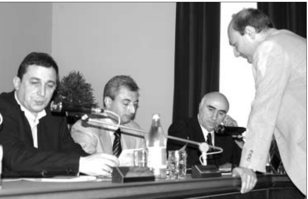
ახლა მათ მოუწევთ საზოგადოებისთვის პრეზიდენტის გამოხატვაების თარგმანა.