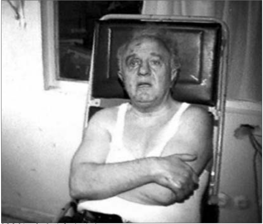
მაშინ მას დემოკრატიის ნიღაბი უხდებოდა.