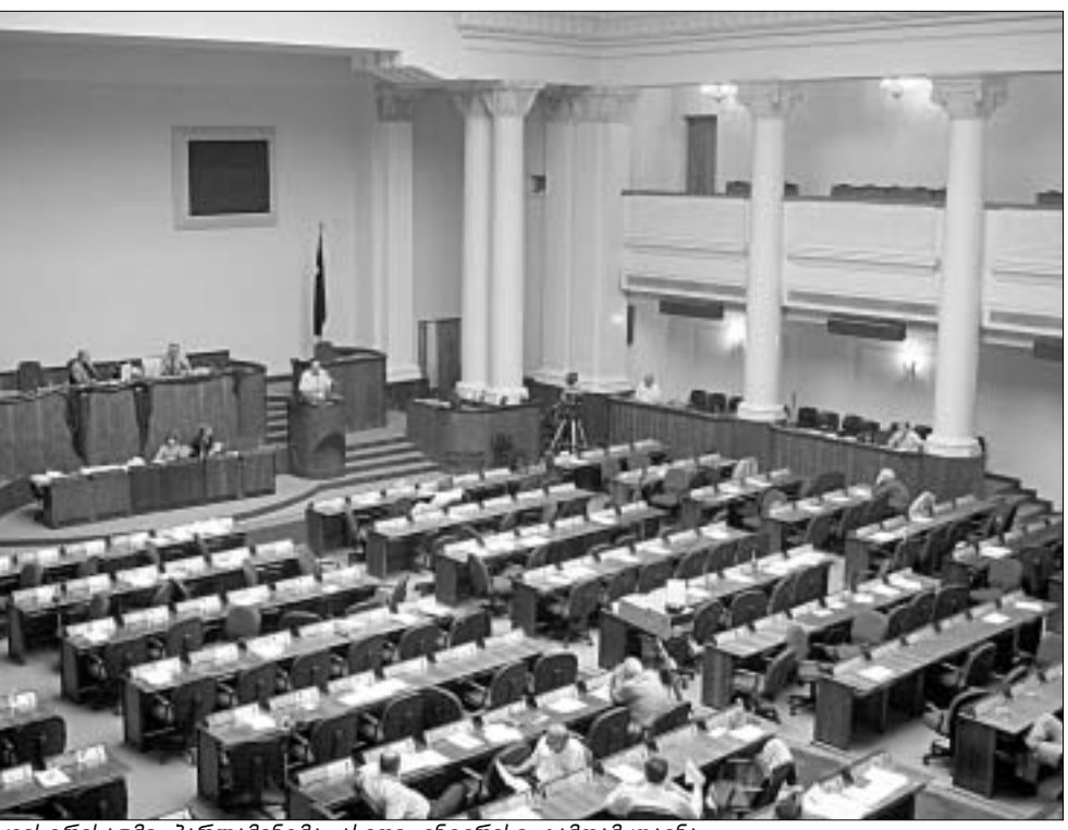
ბიუჯეტის სეკვესტრისადმი პარლამენტმა ასეთი ინტერესი გამოამჟღავნა.

კავშირგაბმულობის სხვა სფეროებშიც ტარიფების გაზრდას გამოიწვევს. თუმცა, მინისტრის მოადგილე საზოგადოებას იმით "ამჟივდება", რომ ნაჯარადევი საგადასახადო ცვლილებები სოციალურად უღებულ ფუნჯებს არ შეეხებათ და მათ არ დაზარალებს. გადასახადების გაზრდის მოთხოვნის ფონზე გაოცებას იწვევს ის ფაქტი, რომ კანონპროექტის მიხედვით აქციის გადასახადი უნდა შემცირდეს შემოტანილ... თართზე, ორაგულზე და ხიჯილატზე, აგრეთვე, ავტომობილების საბურავებზე.