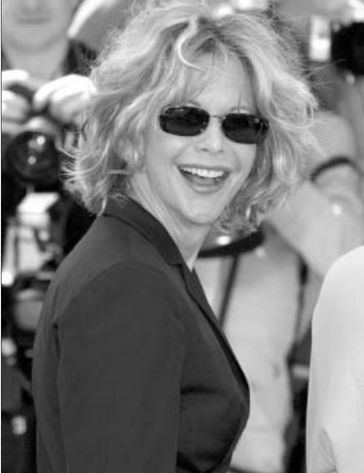
მეგ რაიანი ტორონტოს ერთ-ერთი ვარსკვლავია