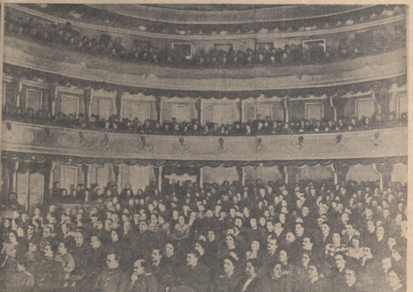
კაპანაძის ლენინის საარჩევნო ოლქის ამომრჩეველი წინასარჩევნო კრებაზე 1951 წლის 8 თებერვალს ბრუილის სახელობის ლენინის ორდენის სახელმწიფო თეატრში.