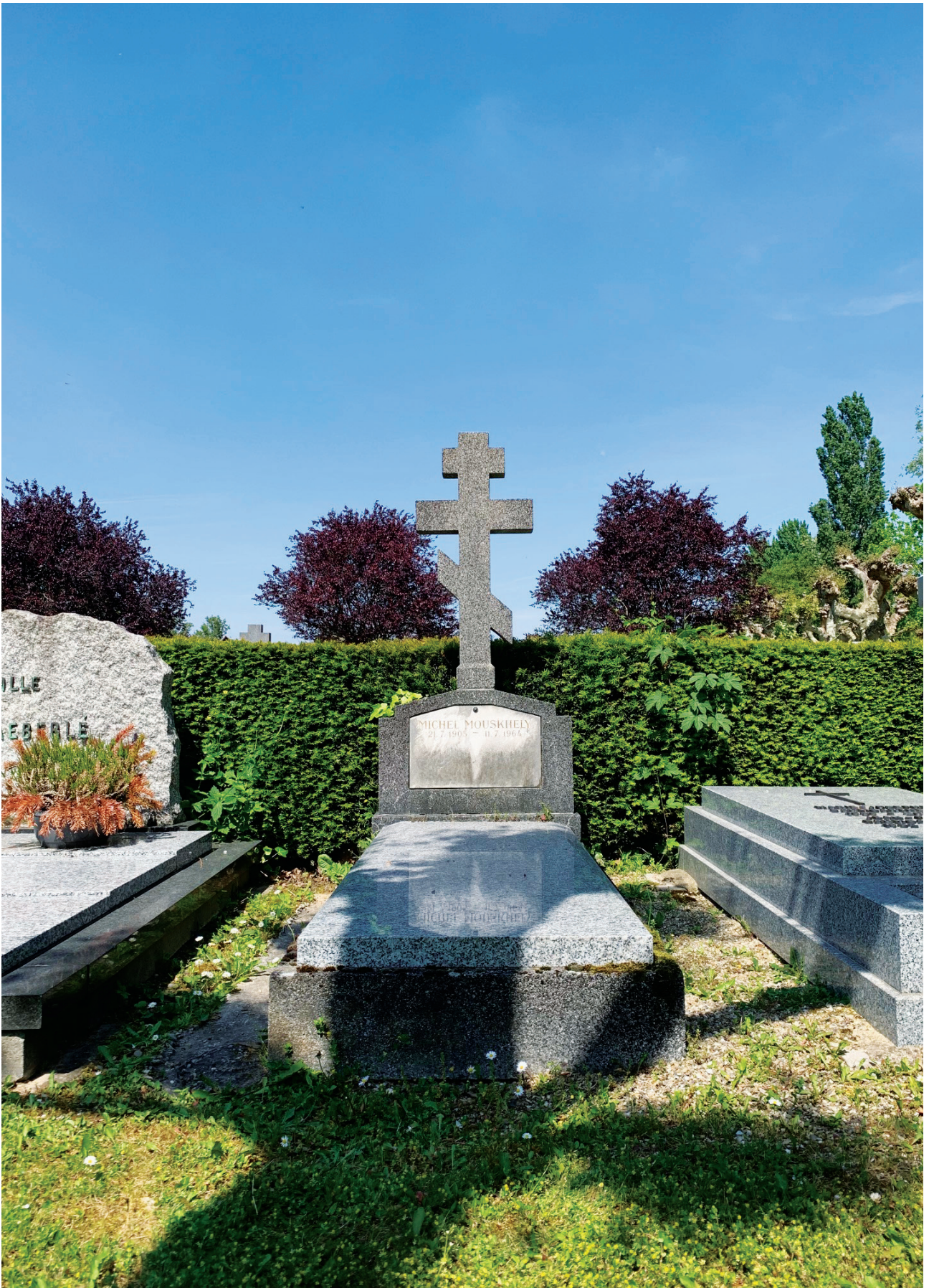
მიშელ მუსხელის (მიხეილ მუსხელიშვილი) საფლავი, სტრასბურგი Tombe de Michel Mouskhély (Mikhéil Mouskhélishvili), Strasbourg