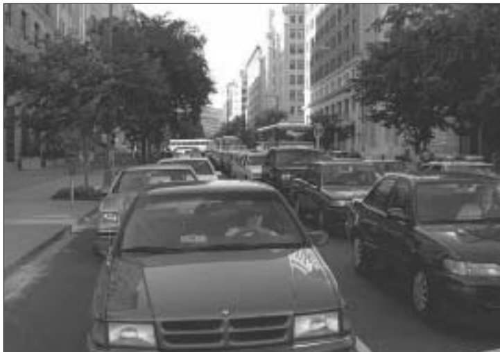
ესეთი “საცობი” ჩვეულებრივი მოვლენაა ამერიკაში

სიარულად, ისინი ერთ ადგილზე დგანან და ცდებიან”, - ხუმრობს ავტოკატასტროფების რაოდენობა ითით-ამერიკის საავტომობილო ასოციაციის სპიკერი ნაკელი. საუბარ ამერიკულ ოჯახზე დღეისათვის 1,75 მძღოლი და 1,90 ავტომა-