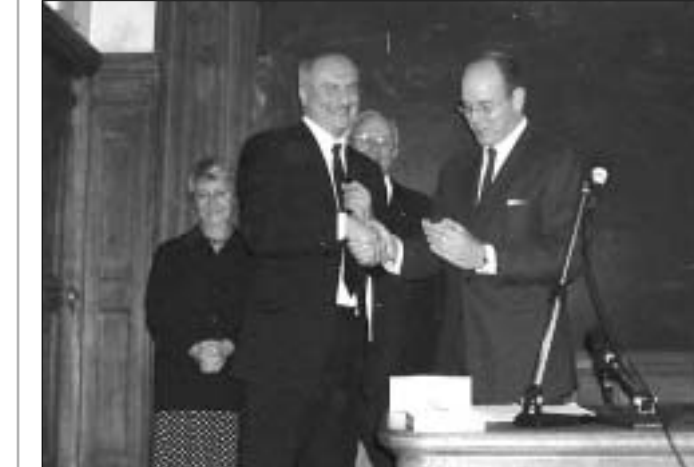
პრინცმა საჩქერად მიიღო დამინისტი აღმორჩენილი ყმის ასლი

ბარამ ნიხახაშვილი ვის ევროპის უდიდეს ცენტრს წარმოადგენს. ცერემონიაზე, რომელსაც ესწრებოდნენ სამეცნიერო წრეების წარმომადგენლები, პარიზში აკრედიტებული დიპლომატები და ჟურნალისტები, ადამიანის პალეონტოლოგიის ინსტიტუტის დირექტორმა საფრანგეთის აკადემიის წევრმა აბრე დე ლუმბეიმ აღნიშნა: “საქართველოში მიმდინარე პალეონტოლოგიურ კვლევებს უდიდესი მნიშვნელობა აქვთ მსოფლიო მეცნიერებისთვის. მედიტორეგიონში სიყვარული უფრო უნდა გავრცელდებოდა და ვიღაცეები უნდა დაეჭვებინათ, რომ ეს არ არის მხოლოდ ეპოქის ანტიპროტოპროტოპოლოგიური ვაჭარობის შედეგი, არამედ საქმარეული პირებიც დიდი ქალაქებდნან, მაგალითად, ნიუ იორკიდან, რომელთაც არ სურთ ზედმეტი თავსატეხი, არც დროის დაკარგვა უნდათ ავტოსადგომის ძეგნაში, და გადასახადებისა და ჯარიმების გადახდასაც ურიდებოდა. ასეთი წინსაძინადი დღე აშშ-ში ავტომანქანის შუშის პრინციპით ხდება. ამიტომ “ელასის” ცნება აქ ავტომანქანებს უფრო შეეფერება, ვიდრე ადამიანებს.