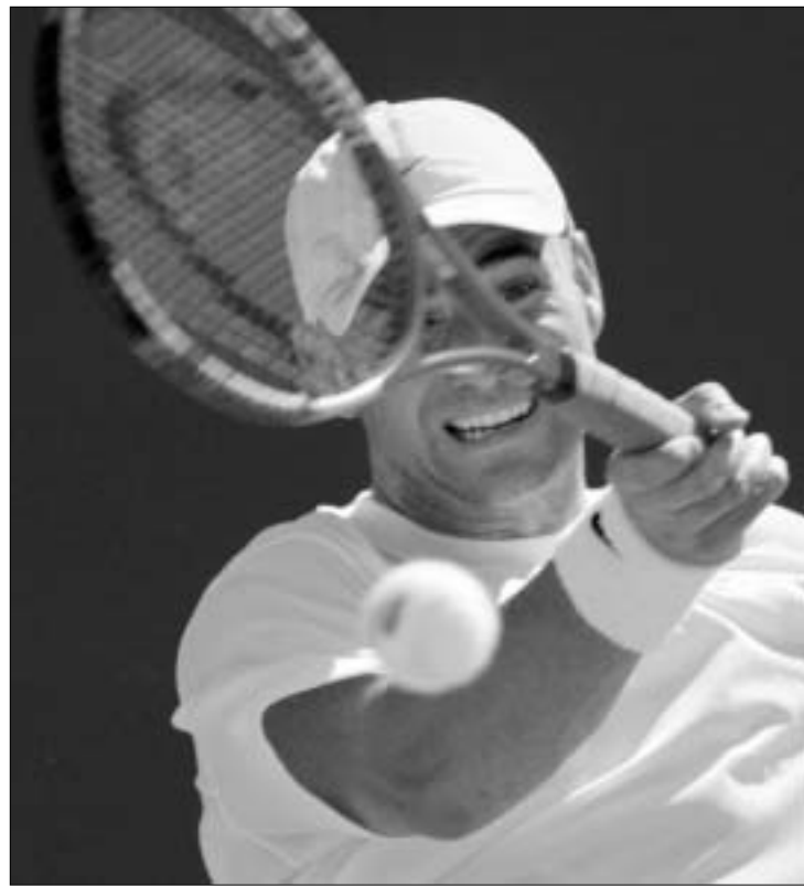
ანდრე აგასიმ უკანასკნელი რუსი დიდორნი

ტურნირის პირველმა ნომერმა მეორე სეტიც თავის სასარგებლოდ დაასრულა. მესამე სეტში აგასისთვის მეტოქის ერთი მოწოდების აღებაც საკმარისი აღმოჩნდა პარტის მოსაგებად. ამ მატჩის გარდა, ნიუ-იორკის კორტზე სხვა მნიშვნელოვანი მოვლენებიც მოხდა. გათამაშებას დაემთხვა ტურნირის მე-10 ნომერული მფრთველი, გამოადრებდას ამერიკელი სეპარად უკეთ შეეგება. მან სასწრაფოდ დაიბრუნა თავისი მოწოდება და თამაში ტაი-ბრეიკში გადაიყვანა. აქ კი, ტურნირის პირველი ნომრის ანდრე აგასის ნიჭსა და გამოცდილებას შეეწინა. ეს გაჯანჯღებულად