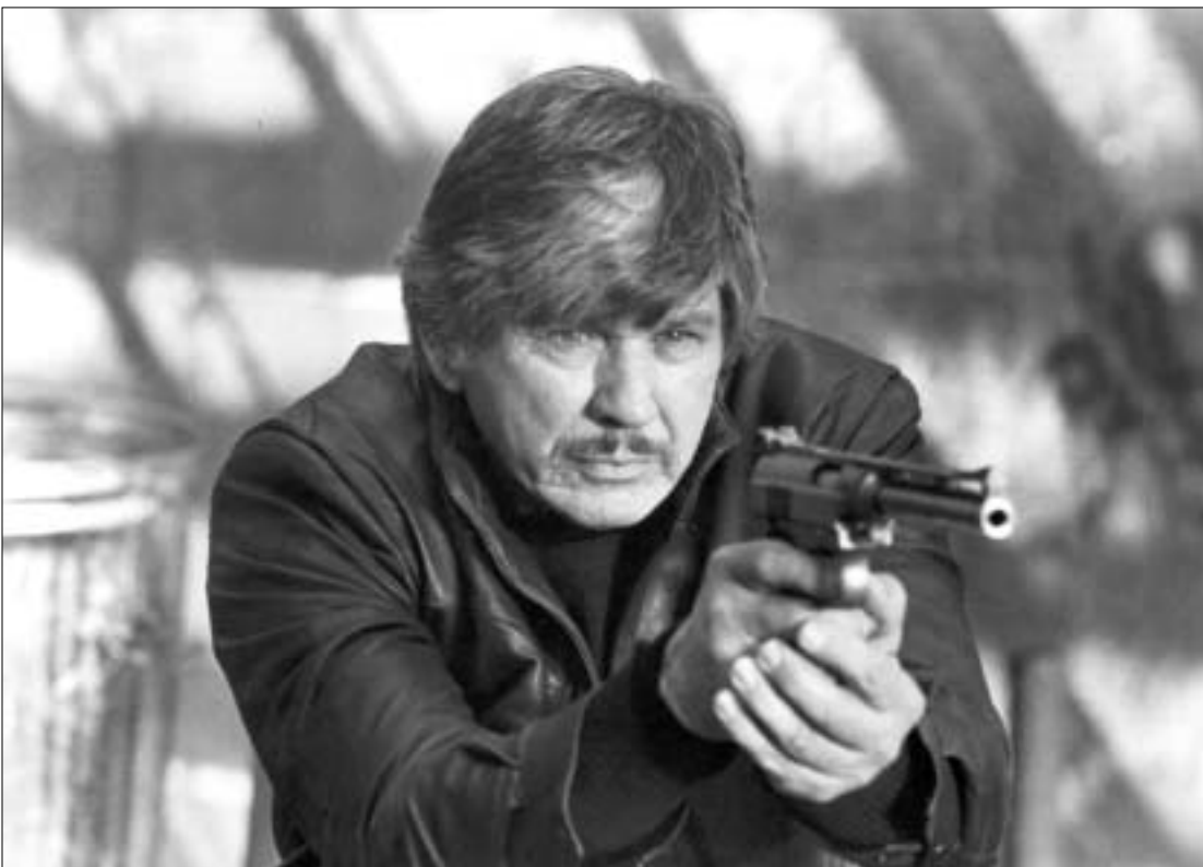
კადრი ფილმიდან “სიკვდილის სურვილი 2”

“ათიოდე წლის წინ ჩემი სახის დანახვა კინოში არავის უნდოდა, ყოველ შემთხვევაში, “კარგი ბიჭის” როლით მაინც. მაგრამ დრო შეიცვალა. ბოლოს მოხდა ისე, რომ საჭირო დროს საჭირო სახე აღმომაჩნდა”, - ასეთი მშვიდი და განონასწორებული განწყობით “აღნიშნა” ჩარლზ ბრონსონმა “გავარსკვალავება”. არავითარი ყალბი პათეტიკა და სტანდარტული ჰოლივუდური ტექსტები: “მაღლოდა მამას, დედას და ჩემ პატარა ძაღლს”... ბრონსონი ამ ტიპის ვარსკვლავი არასდროს ყოფილა. ის ახერხებდა და პოპულარული ჰოლივუდური ფასეულობების დაუცველად ხდებოდა. მეტიც, მას ისე მაინჭეს “ოქროს გლობუსი”, როგორც “მსოფლიოში ყველაზე პოპულარულ მსახიობს” (ეს 1972 წელს მოხდა), რომ თავისი პირადული ცხოვრების შესახებ ჟურნალისტებთან არასდროს უსაუბრია. პირიქით, მათ ყოველთვის უბნებდა თავგზას და შეძლებისდაგვარად უმაღლვდა თავის ნამდვილ “მეს”.