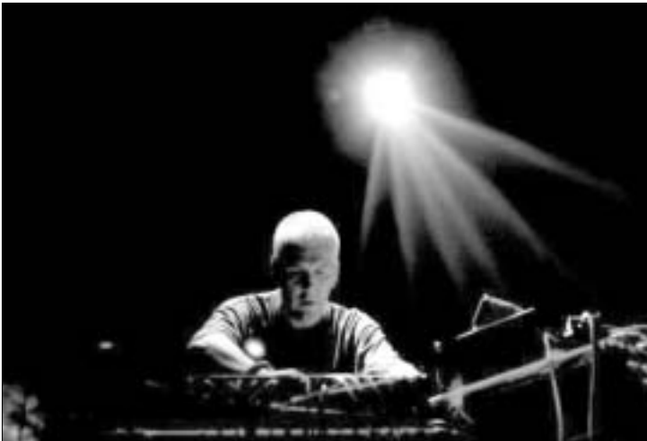
Banco de Gaia სცენაზე მუშაობს

როგორ მუსიკას ქმნის ერთ დღეში მსოფლიოში Banco de Gaia-ს ფსევდონიმით ცნობილი ბრიტანელი მუსიკოსი, ტობი მარკსი, ამას თბილისელები მალე შეამოწმებენ. ჩვენ ხომ მთელი სამი დღე გვაქვს საამისოდ. Banco de Gaia-ს სალაშქრობი თბილისში, შემოდგომის პირველ უიკენდზე, კლუბებში: “ნოა-ნოა”, “აჭარა მიუზიკ ჰოლი” და “ჯოი”, გაიმართება. პროექტის ორგანიზატორია ვანიკო თარხნიშვილი, რომლის ინიციატივასაც ფინანსურად ზურგი კომპანია “კენტმა” გაუმაკვრა.