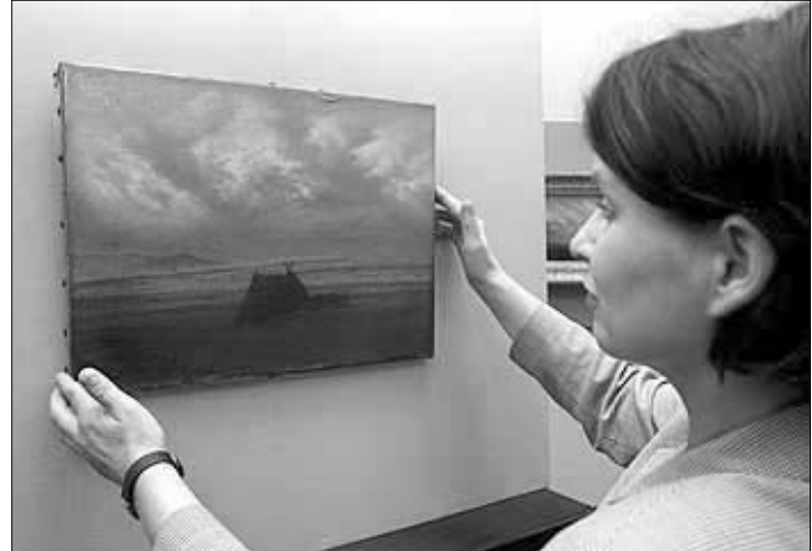
ნახაბს თავის ადგილზე კიდებენ

კასპარ დავიდ ფრიდრიხი ჰამბურგს დაუბრუნდა