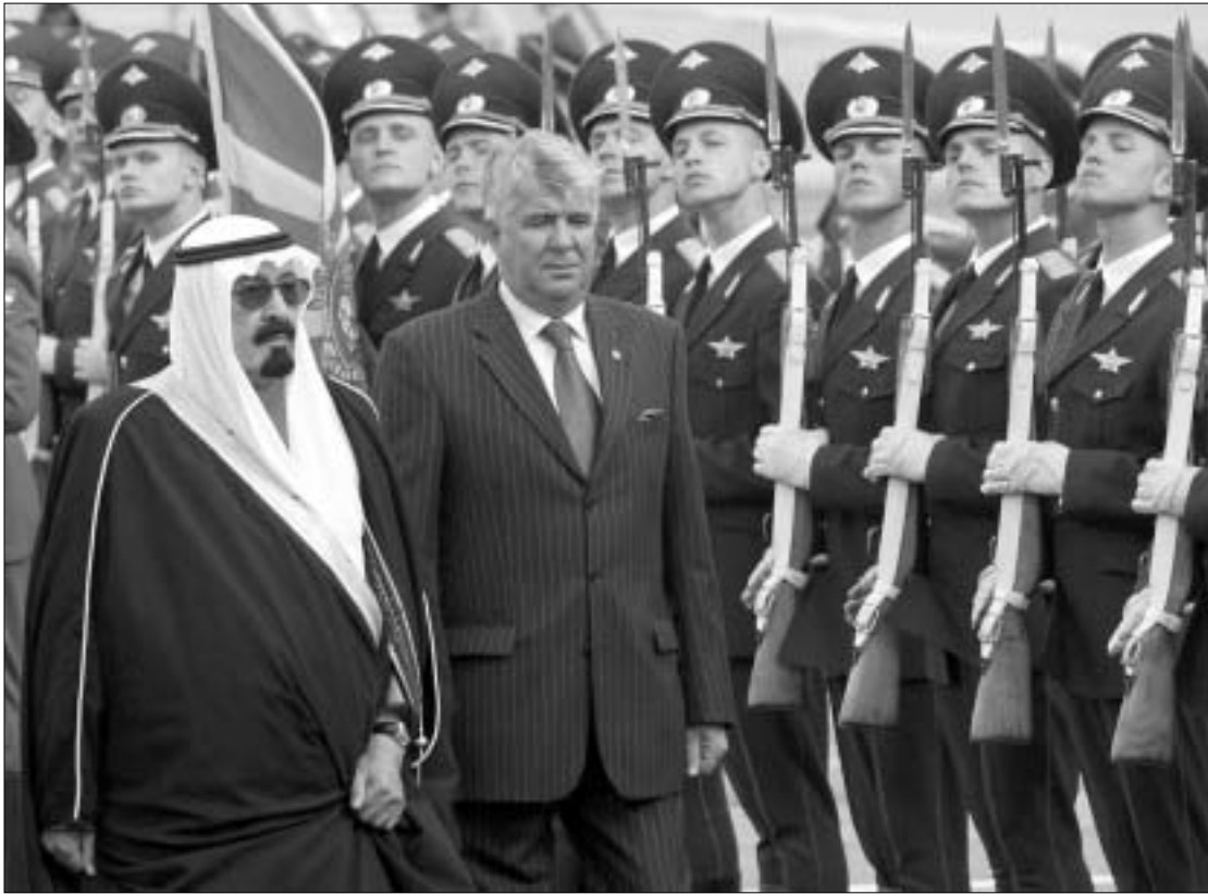
საუდის არაბეთის პრინცი აბდულა მოსკოვის აეროპორტში

გუმინ ოფიციალური ვიზიტით რუსეთის ფედერაციის დედაქალაქ ეწვია საუდის არაბეთის პრინცი აბდულა. მას შემდეგ, რაც 1926 წელს ორ ქვეყანას შორის დიპლომატიური ურთიერთობები დაამყარა, ეს ასეთი დონის პირველი ვიზიტია. საუდის არაბეთის პრინცი, რომელიც სამშობლოში სამეფო ტახტის პირველ მემკვიდრედ ითვლება, ვიზიტის ფარგლებში შეხვედბა რუსეთის ფედერაციის პრეზიდენტს ვლადიმერ პუტინს, პრემიერ-მინისტრს მიხაილ კასიანოვს, მოსკოვის მერს იური ლუჟკოვს, მუსულმანური და მართლმადიდებელი სასულიერო სტრუქტურების ხელმძღვანელებს. ვიზიტის დროს დაგეგმილია ორ სახელმწიფოს შორის შთანხმებაზე ხელმოწერა ისეთ სფეროებში, როგორცაა ნავთობისა და გაზის მრეწველობა, ინვესტიციები და თანამშრომლობა საერთაშორისო ტერიტორიის ნინა-ალმდეგ ბრძოლაში.