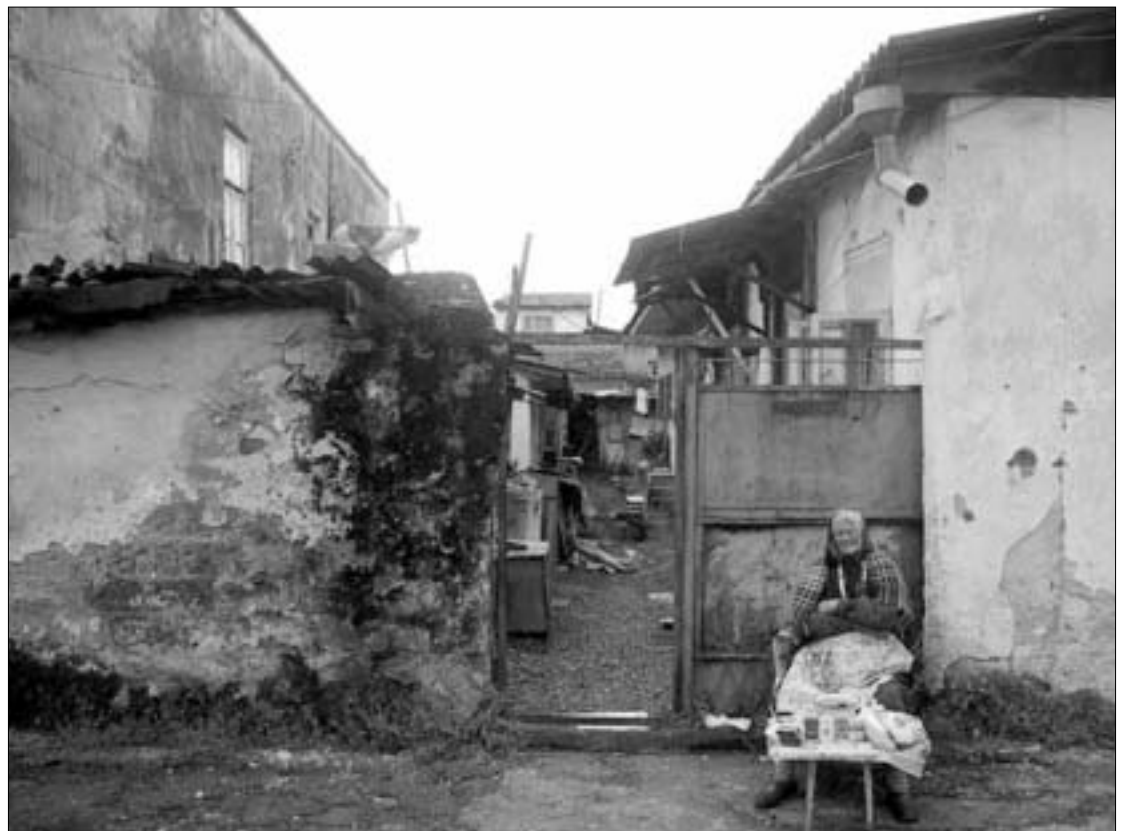
საკონკურსო ფოტო N5