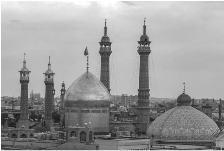
(გაბრძენა, დასაწყისი №ს. „სბ.“ N22-26)

უკვე გვიან იყო. კომუნისტთა მიერ დარბეული, გაძარცვული, ნაცემი და შეურაცხყოფილი ირანის პროვინციის მოსახლეობა „ჯანგელიელთა“ და კურეკ-ხანისადმი სიძულვილით იყო სავსე და ამბობდა: იმის მაგივრად, რომ უწინდებურად ტყვენი დარჩენილიყვნენ და ხალხი დაეცვათ, უცხოელ დამპყრობლებს - ბოლშევიკებს შეეკრუნენ, ხალხი აძარცვივნენ, ახოცინენ, აწამებინენ და როცა მტერმა თავად კურეკ-ხანს დაუბოძა მოკვლა, ბრძოლა მერე დაუწყესო.